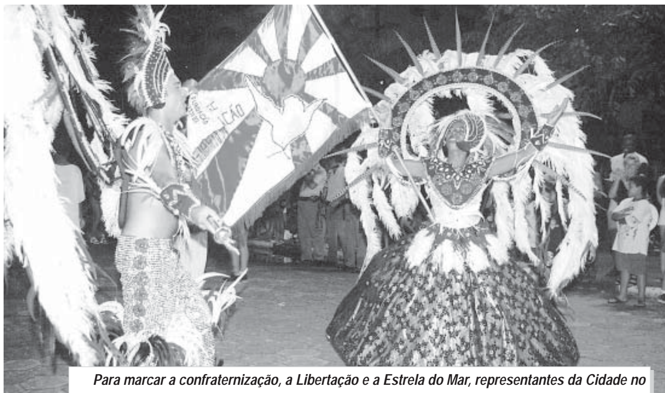
Para marcar a confraternização, a Libertação e a Estrela do Mar, representantes da Cidade no Carnaval Metropolitano, promoverão uma grande festa neste sábado, na Praça Benedito Calixto