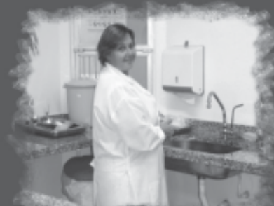
Postos de enfermagem melhor equipados