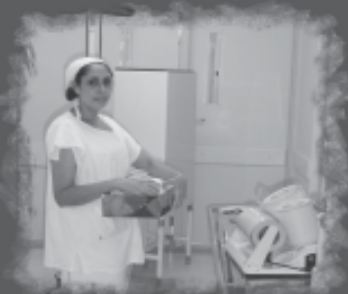
Três salas de cirurgia e uma de parto totalmente estruturadas