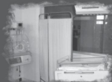
Berçário com aparelhos modernos