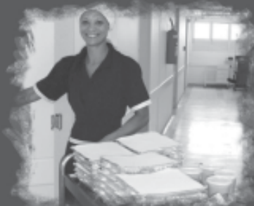
Humanização no atendimento