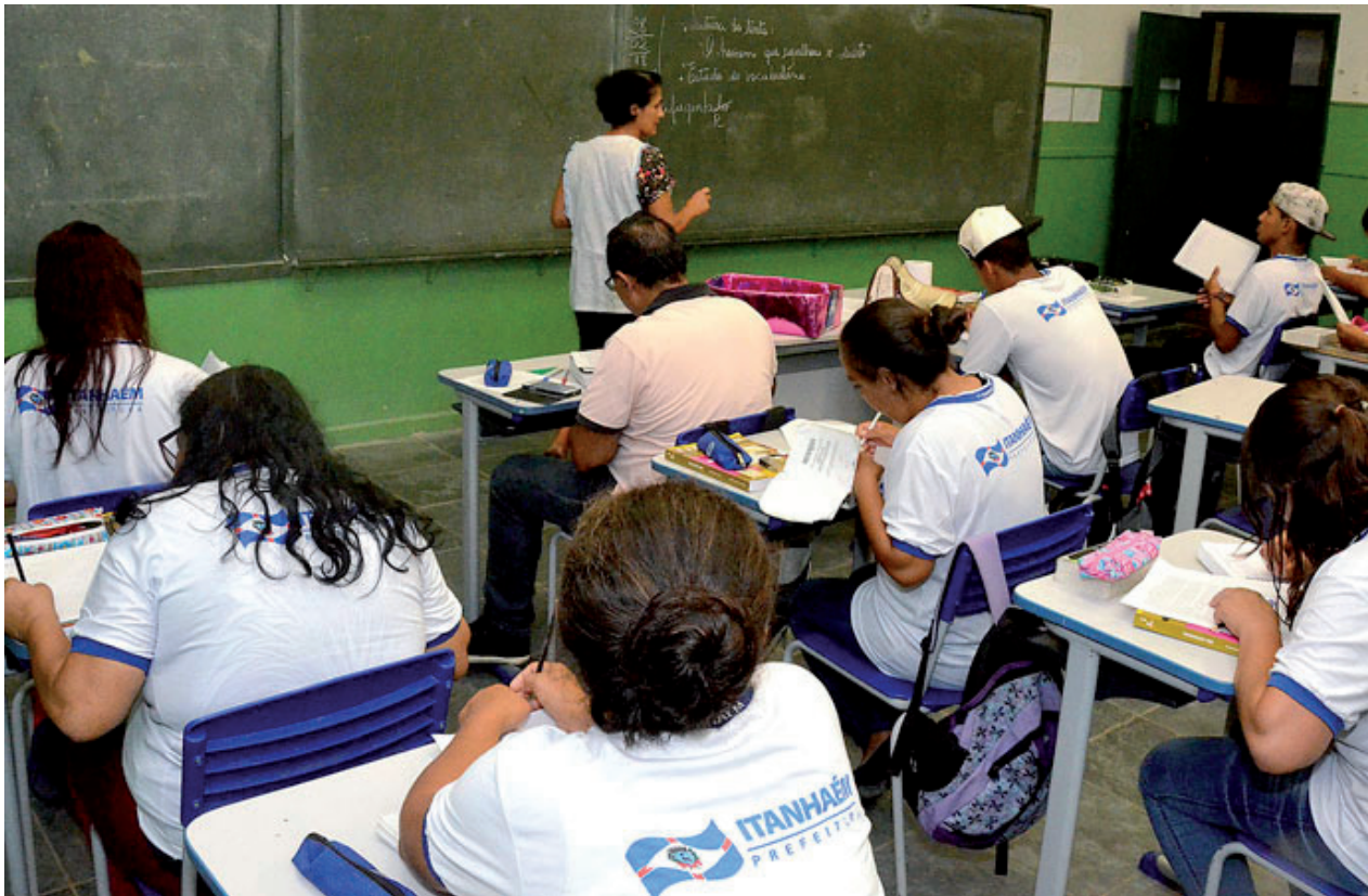
Programa desenvolve ensino com qualidade para aqueles que por qualquer motivo, não tiveram oportunidade de estudo