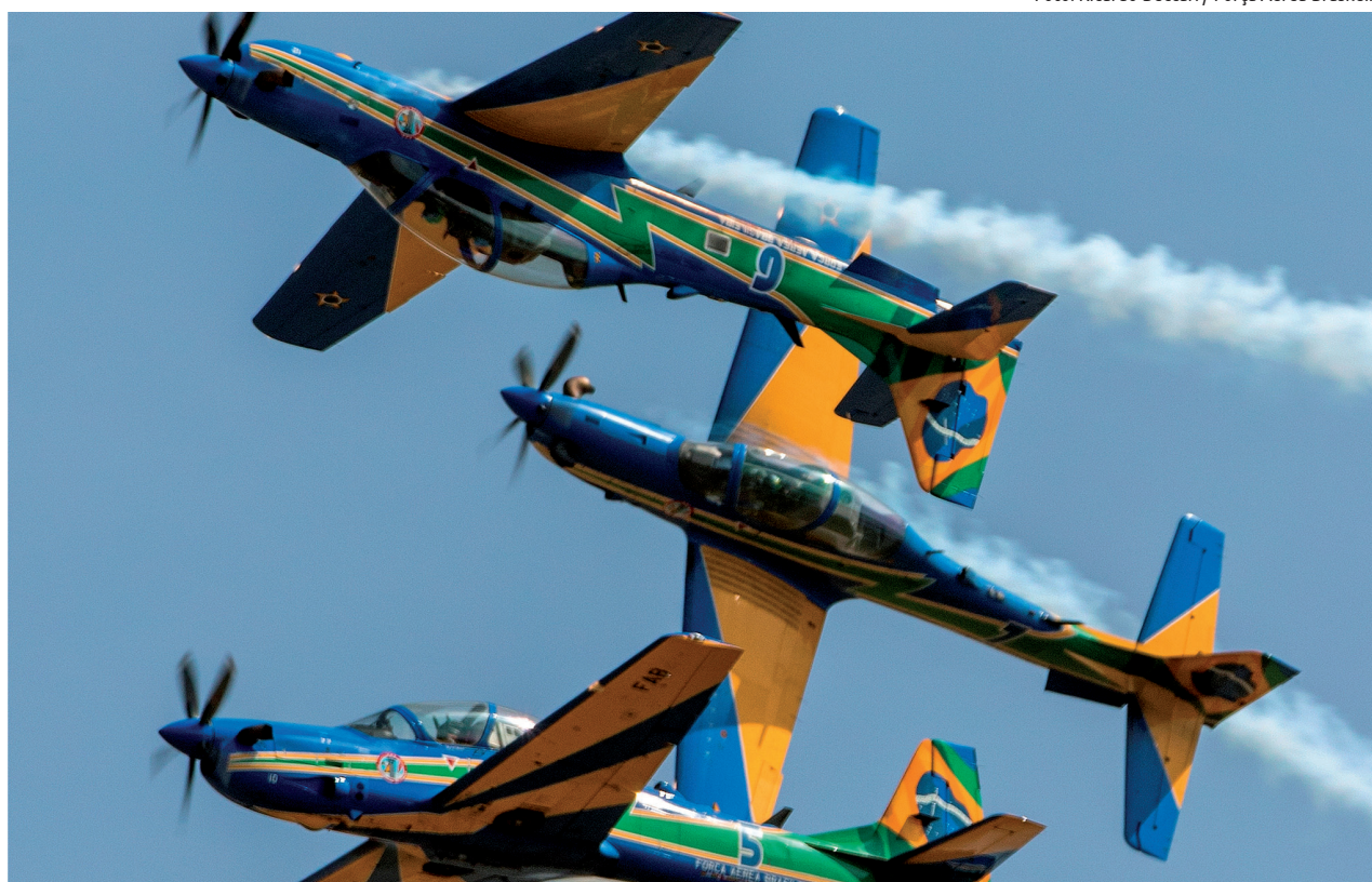
As acrobacias acontecerão na orla da praia do Centro (no trecho da Rua Cunha Moreira à Av. Jaime de Castro)

As cores da Bandeira do Brasil compõem a pintura das aeronaves, com tonalidades fortes e marcantes: a própria Bandeira Nacional é destacada na cauda do A-29, ressaltando o alto grau tecnológico da indústria brasileira e o excelente profissionalismo dos pilotos da Força Aérea, além de evocar o sentimento patrió-