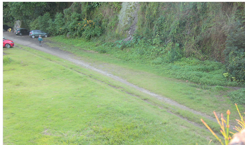
A empresa será obrigada também a apresentar à Prefeitura um cronograma de trabalho