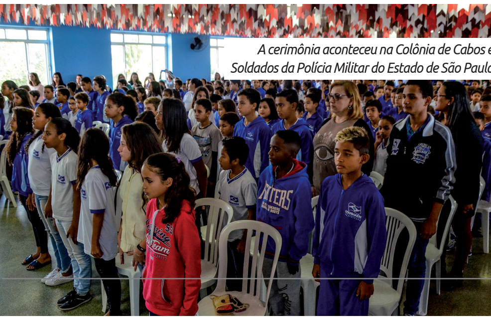
A cerimônia aconteceu na Colônia de Cabos e Soldados da Polícia Militar do Estado de São Paulo

As escolas participantes foram a EM Olga Lopes Mendonça, EM Walter Arduini, EM Profª Filomena Dias Apelian e EM Profª Maria da Penha Correa Sanches.