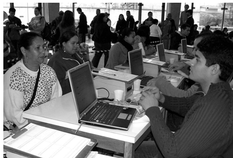
De acordo com informações da Secretaria Municipal de Habitação, 1.529 pessoas participarão do sorteio

APARTAMENTOS - Cada unidade possui dois quartos, sala, banheiro e cozinha conjugada com área de serviço, em uma área de 46 metros quadrados. Outras informações podem ser obtidas no site da Secretaria Estadual de Habitação, pelo endereço eletrônico www.habitacao.sp.gov.br .