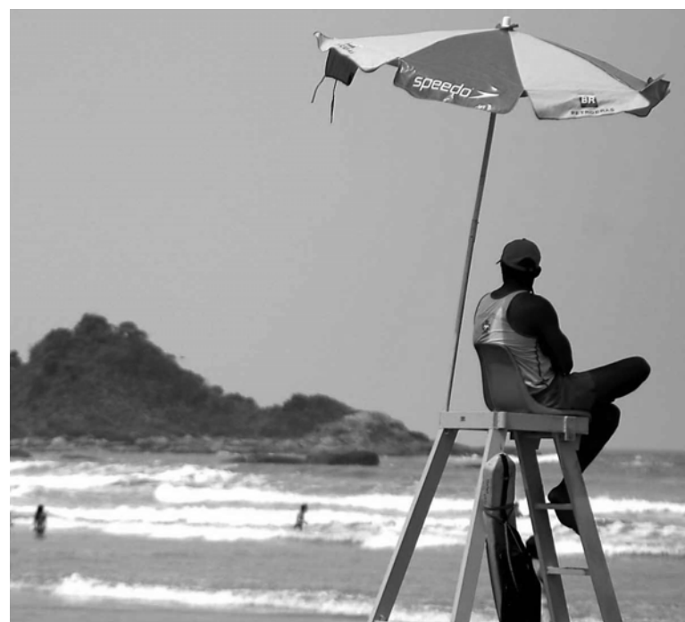
Os interessados devem comparecer todos os dias, das 9 às 17 horas, ao Posto do Corpo de Bombeiros, na avenida Mario Covas Júnior, s/nº, no Cibratel II

Os inscritos também farão o treinamento físico, com salvamento em área costeira, travessia da arrebentação, resgate com helicóptero, jet ski e bote inflável, teste de resistência em águas geladas, salvamento com pranchão, e ainda corridas diárias e abdominais. Tudo isso com o intuito de tornar os candidatos aptos a serem contratados como guarda-vidas.