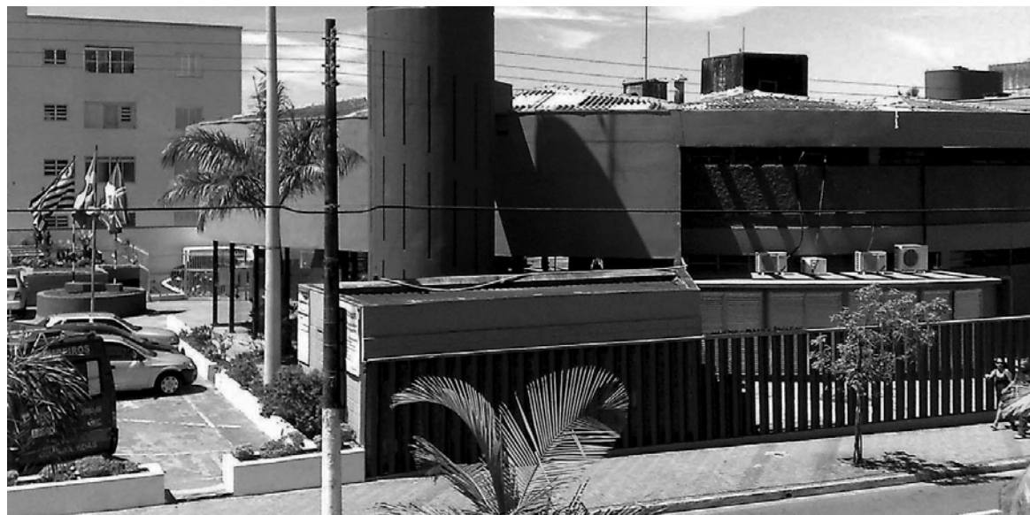
Para negociar os débitos é necessário comparecer ao Paço Municipal, até o dia 30 de outubro

É importante ressaltar que o não pagamento dos débitos ocasionará na execução fiscal, penhora on-line e/ou protesto. A determinação foi aprovada através da Lei 3547, de 27 de agosto de 2009. O Paço Municipal fica na avenida Washington Luiz, 75, no Centro.