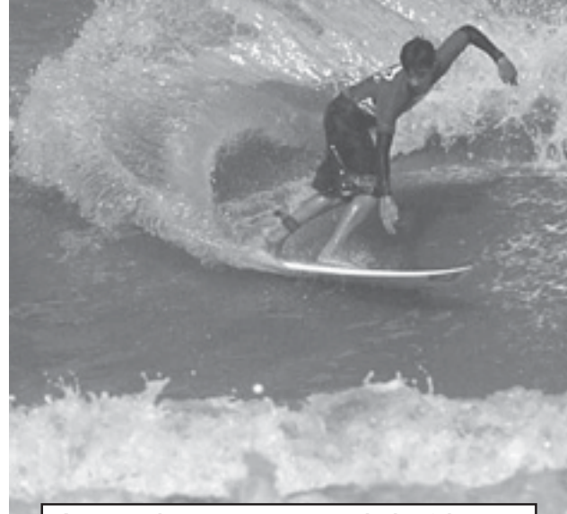
A competição acontece a partir das 9 horas

No próximo final de semana (23 e 24), a Praia dos Pescadores ficará pequena, para receber as maiores promessas do surf brasileiro do Circuito Nicoboco Paulista de Escolas de Surf.