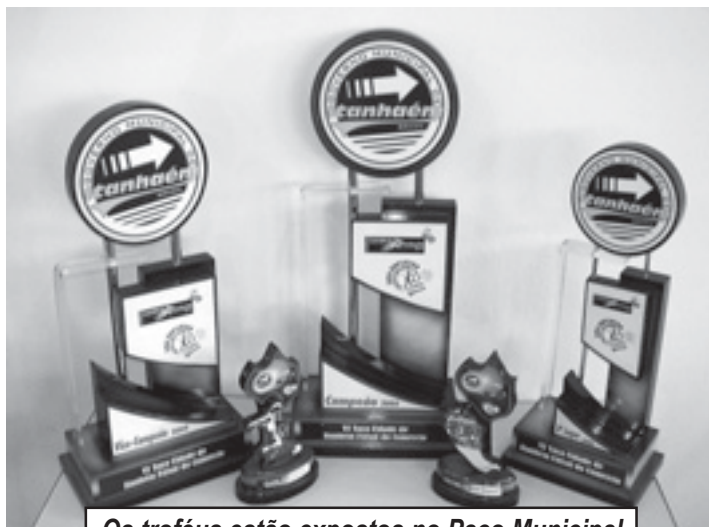
Os troféus estão expostos no Paço Municipal

Trazida à Cidade pela Secretaria Municipal de Trânsito e Segurança e pelo Departamento de Cultura, a peça já conquistou prêmios em importantes festivais no Estado de