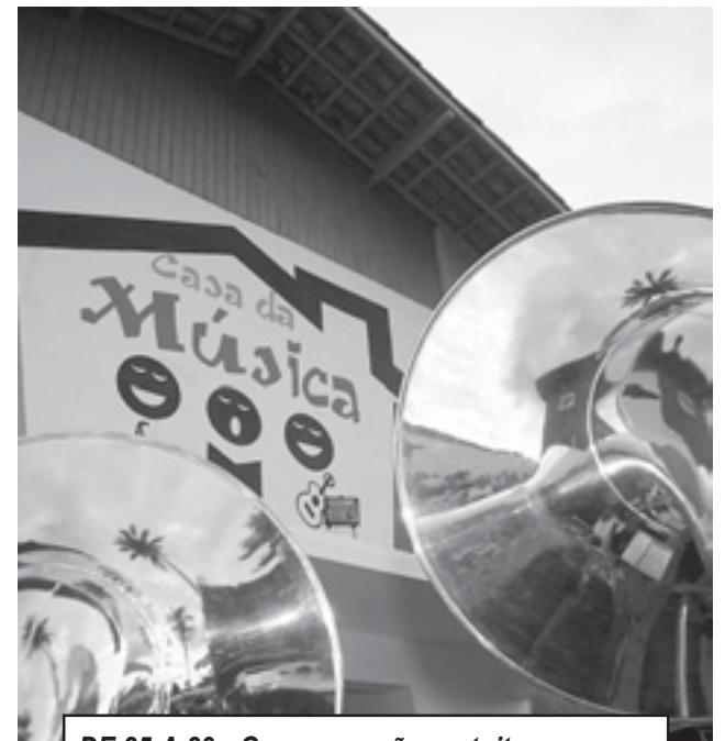
DE 25 A 29 - Os cursos são gratuitos

Para o diretoria de Cultura, a abertura de novas inscrições é uma representação das conquistas da Casa da Música, que surgiu da necessidade de criar condições para o desenvolvimento de um segmento cada vez mais pulsante na Cidade. No local, são oferecidas toda a estrutura