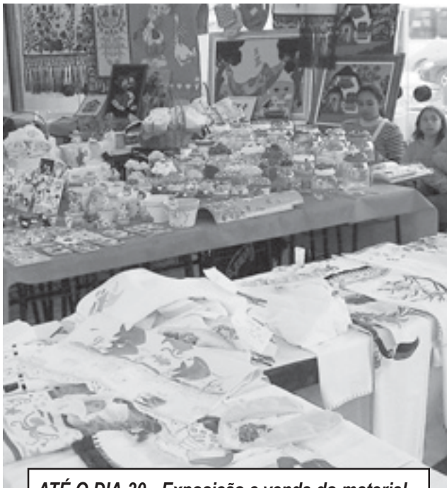
ATÉ O DIA 30 - Exposição e venda do material