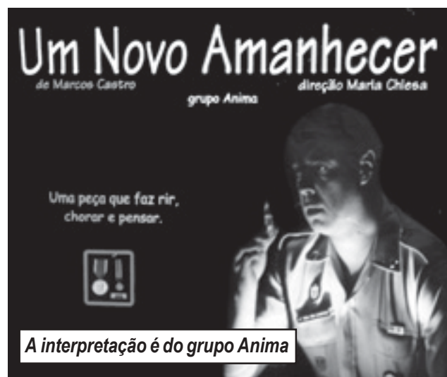
A interpretação é do grupo Anima

Para a secretaria de Comércio e Produção do Município, os resultados estão demonstrando a qualidade da competição. O torneio que começou em maio com 16 equipes, a competição foi acirrada, com superação dos times a cada rodada.