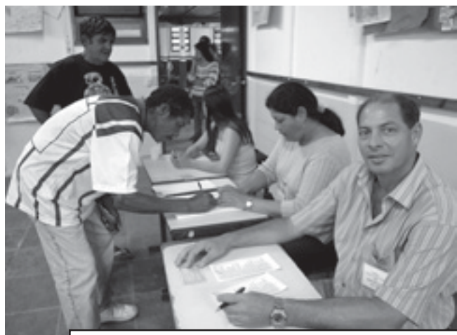
O processo eleitoral ocorreu em clima de tranquilidade na escola Leonor Mendes de Barros