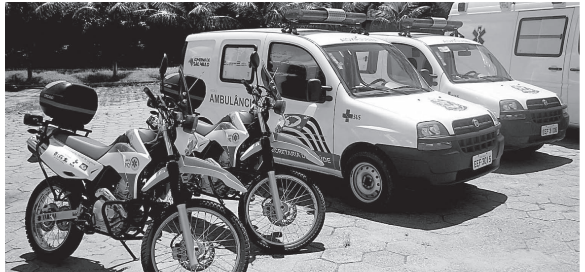
A entrega das chaves ocorreu no dia 29, na sede do Serviço de Atendimento Móvel de Urgência (SAMU - 192)

Além da entrega dos novos automóveis, na ocasião foram repassadas as chaves das motolâncias para o SAMU - 192. Os novos equipamentos, adquiridos por meio do Ministério da Saúde, são da marca Yamaha, modelo Lander XTZ 250 cilindradas. As motocicletas vieram equipadas com bagageiro baú, adesivos de sinalização e sirene. Elas integrarão a frota do SAMU - 192, que ainda conta com duas ambulâncias de suporte básica e um UTI móvel.