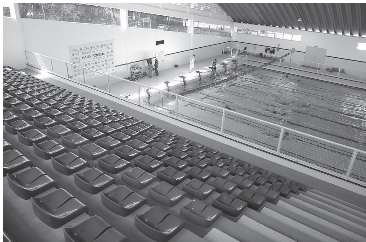
O complexo possui arquibancada para 608 espectadores além de espaço reservado para cadeirantes