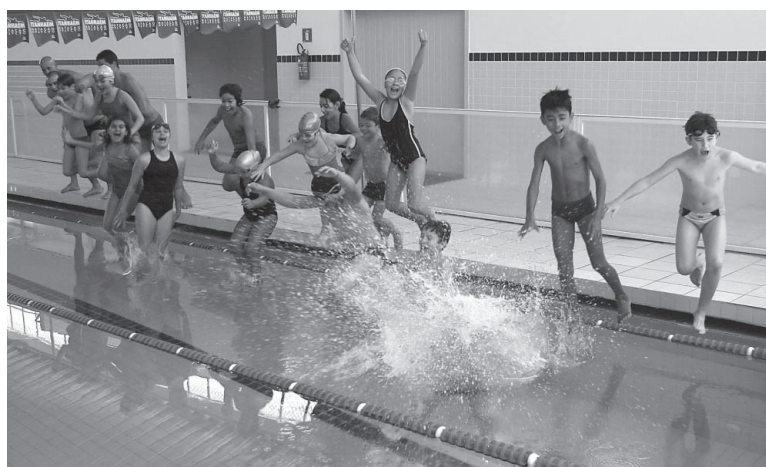
A empolgação já toma conta da equipe itanhaense