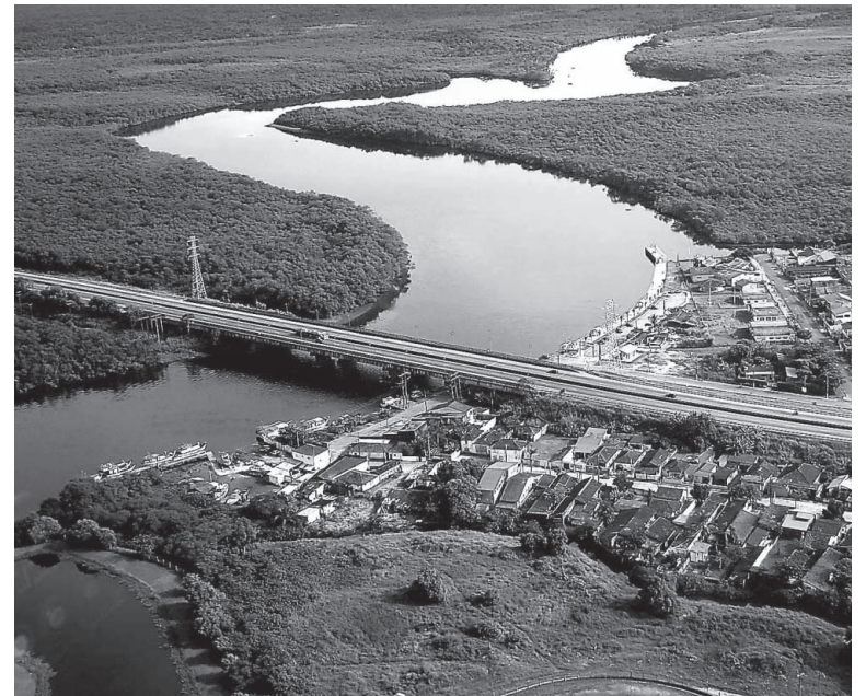
O objetivo do Programa é identificar e mapear a vegetação ciliar de oito rios da Cidade, e elaborar um plano para recuperação das áreas degradadas

MATAS CILIARES - As matas ciliares têm um papel importante na proteção dos recursos hídricos, pois estão localizadas nas margens e ao longo do curso dos rios, funcionando como um filtro, protegendo os rios e as nascentes. Sem as matas ciliares, ou se elas estiverem degradadas, queimadas, descaracterizadas ou ralas, os rios ficam passíveis de processos de poluição, assoreamento e degradação. Além disso, as matas ciliares são importantes para preservação da biodiversidade, pois permitem o deslocamento da fauna local e propiciam a dispersão de espécies da flora nativa.