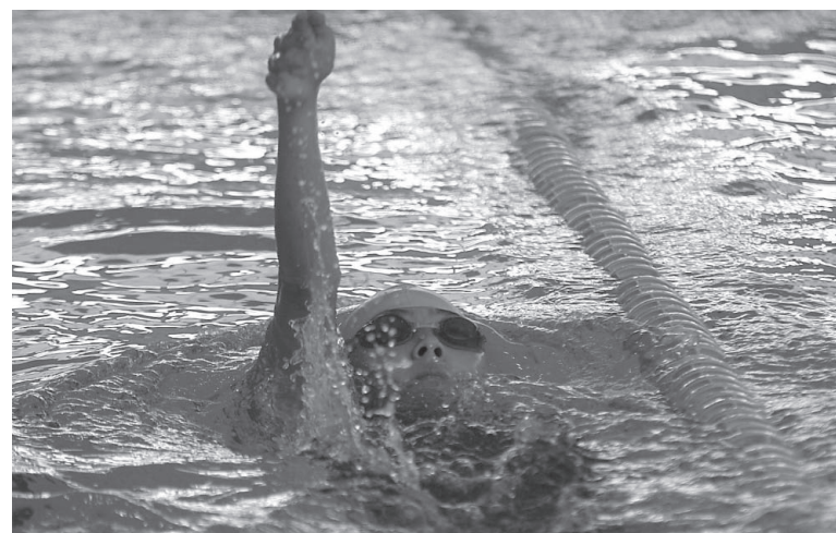
Evento terá categorias do pré-mirim à master