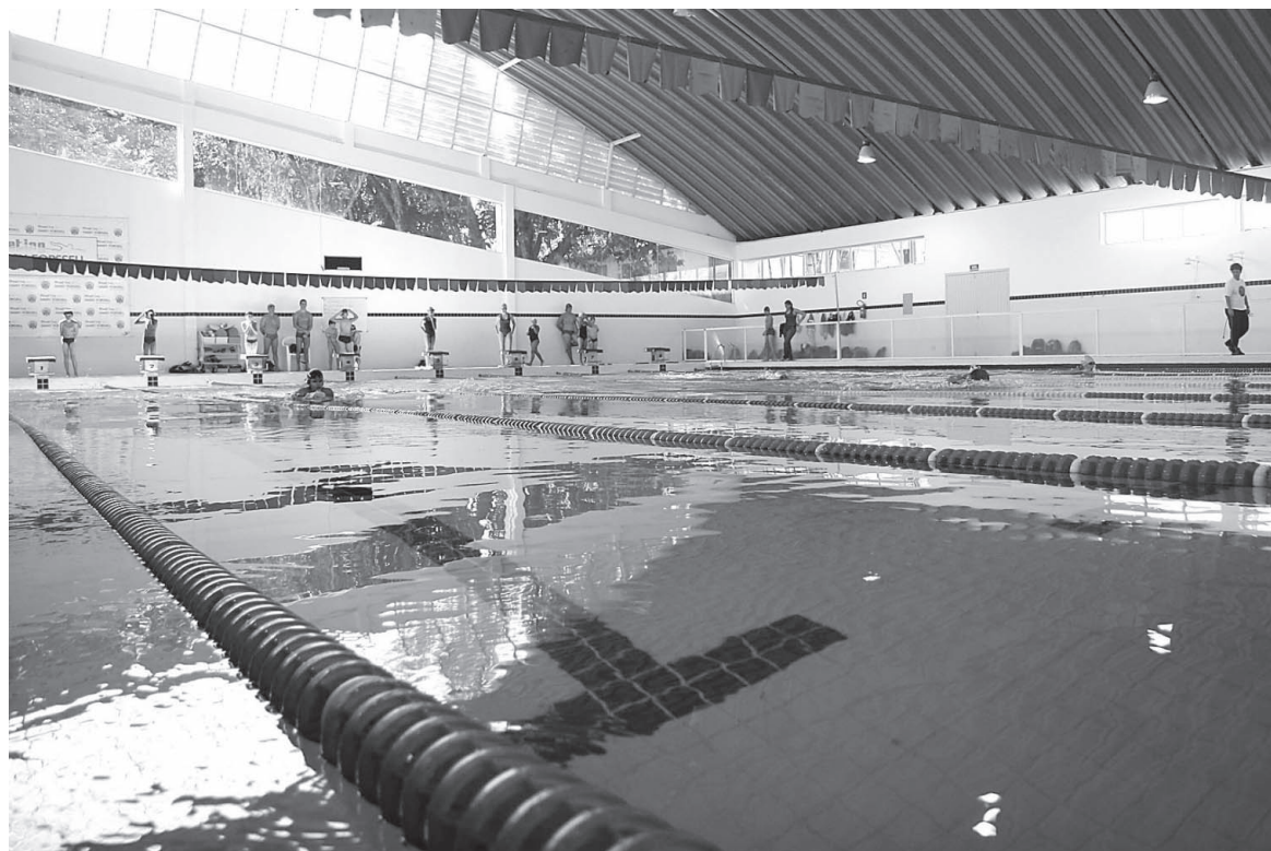
A piscina principal tem 8 raias oficiais e cerca de 459 metros quadrados

A competição será realizada no Complexo Educacional Harry Forssell, situado na avenida Rui Barbosa, s/nº, no Centro. Os nadadores disputarão nas categorias Pré-Mirim a Master.