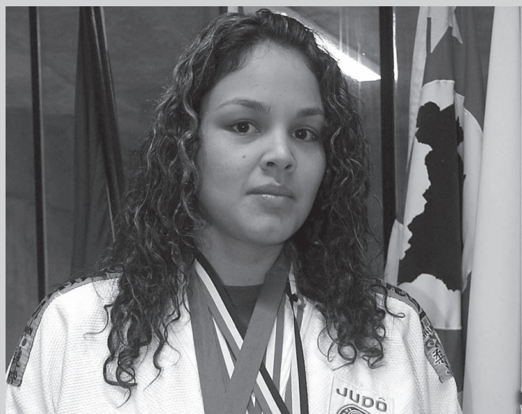
A judoca, que atualmente está na faixa marrom e treina pelo Palmeiras Esporte Clube, começou no judô há nove anos em Itanhaém

A atleta é tricampeã regional e estadual, e foi campeã nos Jogos Regionais de 2009, além