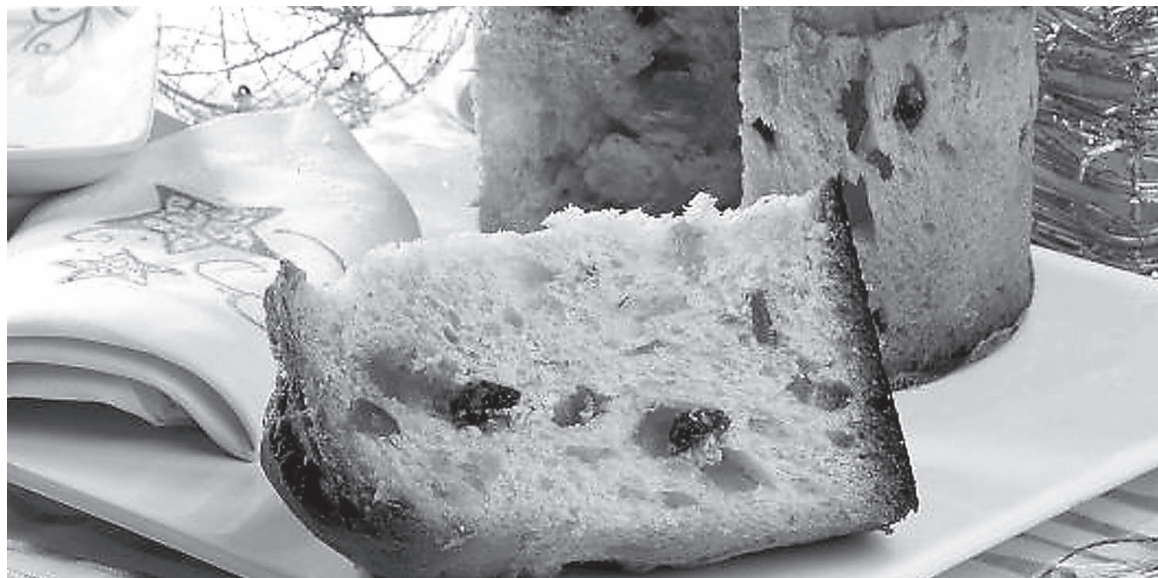
Ao todo são 80 vagas disponíveis e as inscrições vão até o seu preenchimento

BRINQUEDOS - O Fundo Social está arrecadando brinquedos usados para serem doados às crianças carentes do Município durante o Natal. O local onde podem ser feitas as doações é na sede da entidade, na rua Cunha Moreira, 61, no Centro.