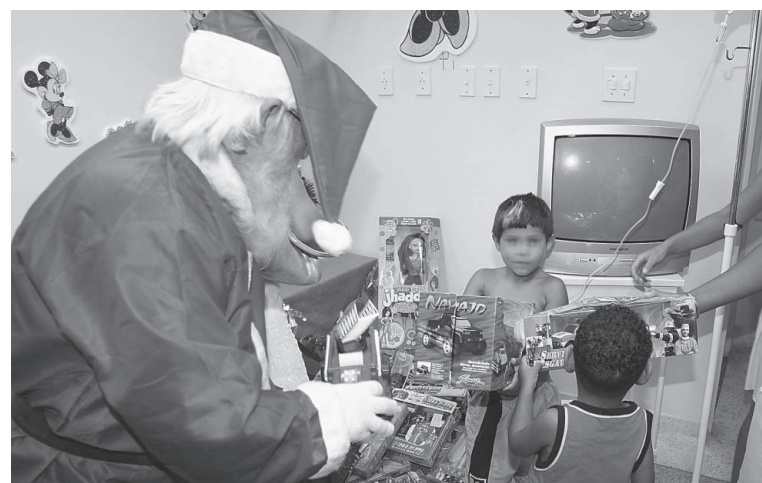
Pessoas de todas as idades poderão participar das festividades

na Vila Loty. O evento será das 9 às 12 horas e terá a presença do Papai Noel entregando os presentes, além da distribuição de doces e algodão-doce. No mesmo dia, das 14 às 17 horas, será a vez das crianças do Parque Vergara receberem os presentes do Papai Noel.