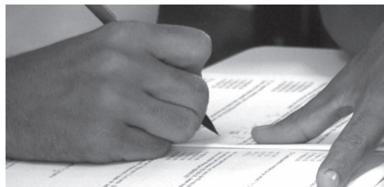
As questões estão relacionadas à Língua Portuguesa, Matemática, Conhecimentos Específicos e Conhecimentos Gerais

Para obter a confirmação da inscrição, basta acessar o site oficial do Município ( www.itanhaem.sp.gov.br ) ou o do Instituto Cetro ( www.institutocetro.org.br ). E também por meio do telefone (13) 3421-1632.