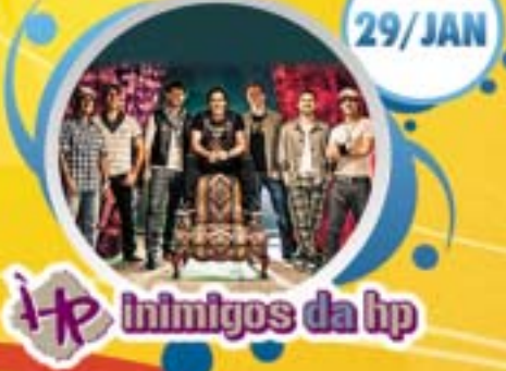
HP Inimigos da hp

Av. Jaime de Castro, a partir das 20 horas - Entrada: 1 kg de alimento