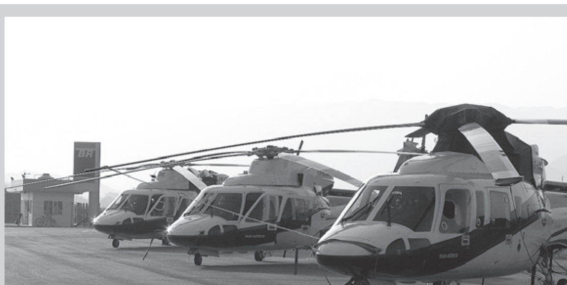
A obra confirma plano de expansão das atividades aéreas que já serve de base para o pré-sal

Na ocasião também foi sugerida a elaboração de um projeto padrão com o objetivo de agilizar a execução das obras dos aeroportos e média e baixa densidade, bem como a formação de profissionais qualificados de acordo com as normas da Agência Nacional de Aviação Civil (Anac).