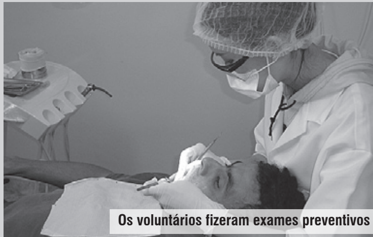
Os voluntários fizeram exames preventivos