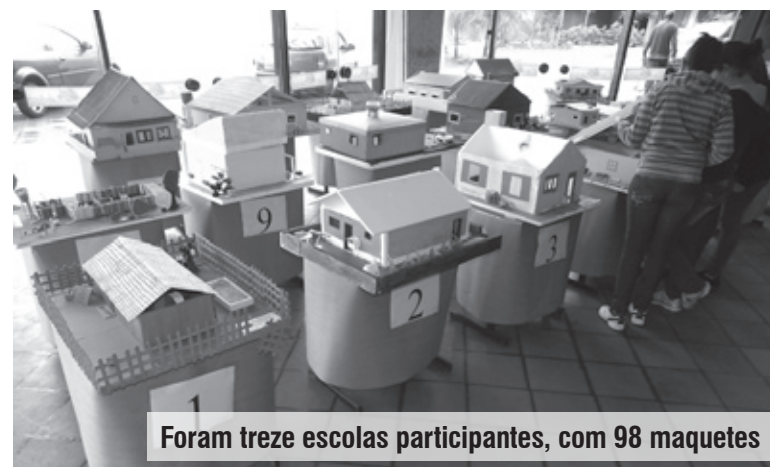
Foram treze escolas participantes, com 98 maquetes