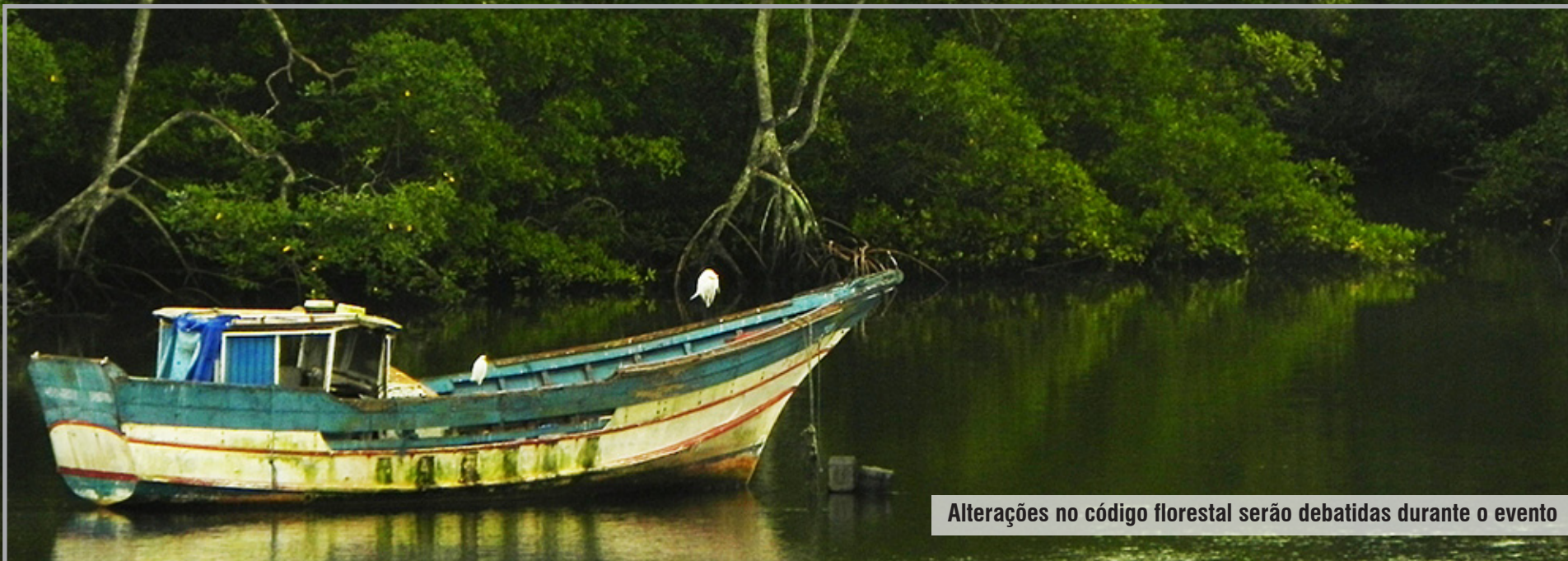
Alterações no código florestal serão debatidas durante o evento