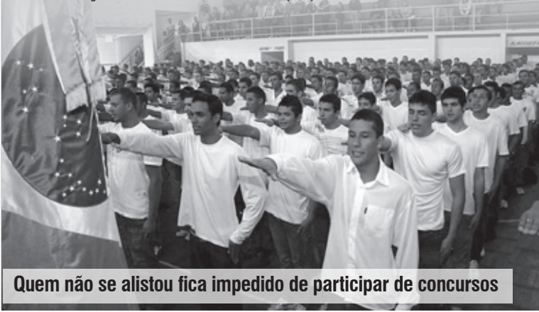
Quem não se alistou fica impedido de participar de concursos

Os jovens que não se alistarem no prazo previsto são considerados refratários e não poderão se matricular em Universidades Públicas, tirar Passaporte ou prestar Concurso Público, além de ficar em débito com o Serviço Militar e pagar multa, que varia conforme a demora para regularização da situação. Para informações, entrar em contato pelo telefone (13) 3426-3320.