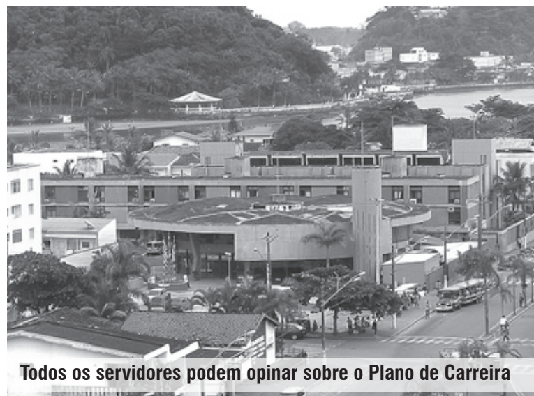
Todos os servidores podem opinar sobre o Plano de Carreira