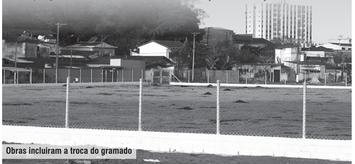
Obras incluíram a troca do gramado

As obras serão executadas pela empresa Termaq Terra-planagem, vencedora no dia 24 de maio no valor de R$ 3.649.949,63, com prazo de execução total de 360 dias.