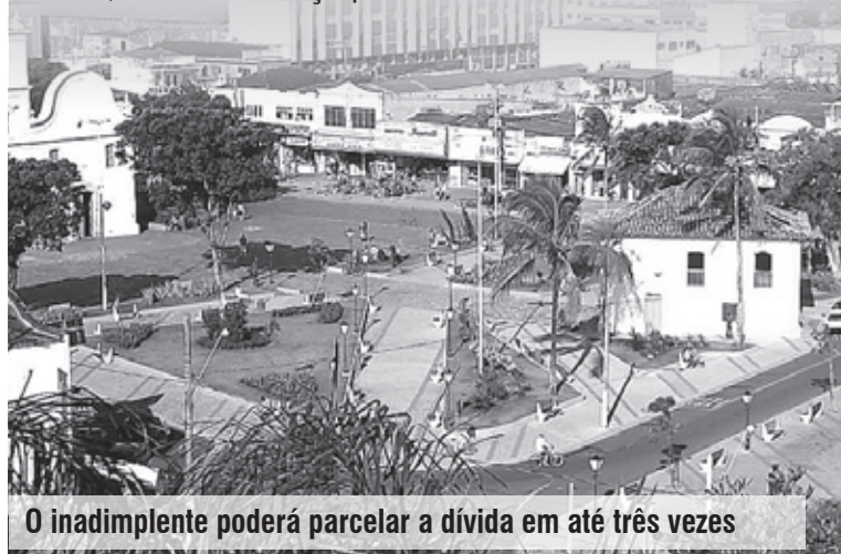
O inadimplente poderá parcelar a dívida em até três vezes

Para quitar o débito ou fazer o parcelamento, o munícipe deve comparecer ao setor de Dívida Ativa, no Centro de Atendimento do Paço Municipal, que fica na Avenida Washington Luiz, 75, no Centro. Mais informações pelos telefones (13) 3421-1617 ou 3421-1606.