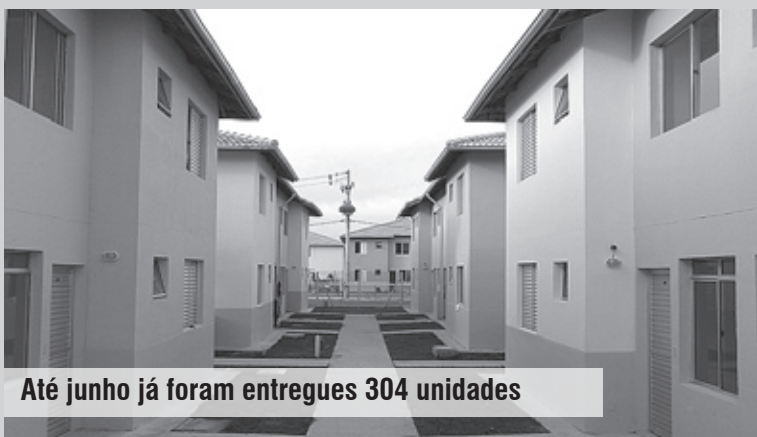
Até junho já foram entregues 304 unidades

Na Educação, Cultura e Esportes o investimento atual é de quase R$ 12 milhões, incluindo a construção de quatro novas escolas de educação infantil nos bairros do Guapurá, Santa Júlia, Savoy e Suarão. Outro grande benefício é a construção do Anfiteatro da Educação, o novo espaço na Cidade dedicado a apresentações culturais.