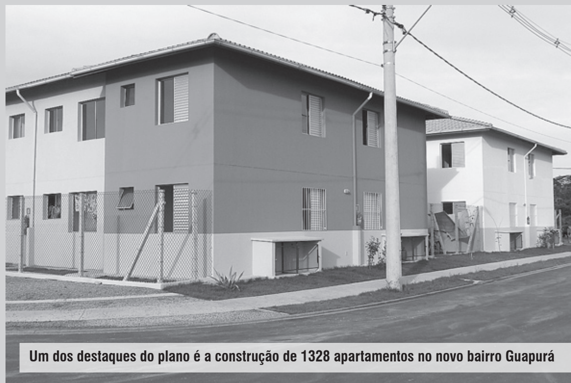
Um dos destaques do plano é a construção de 1328 apartamentos no novo bairro Guapurá

“Já tiramos do papel mais de R$ 158 milhões em obras e serviços, sendo que cerca de R$ 128 milhões estão em andamento. O pacote visa dar um grande salto de desenvolvimento econômico e social para a Cidade neste ano. É o maior investimento da história de Itanhaém”, ressaltou ainda o