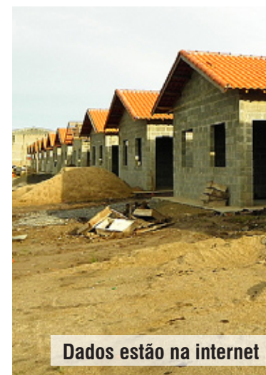
Dados estão na internet

Enquanto o Governo Federal tenta garantir o sigilo dos dados sobre os orçamentos das obras previstas para Copa do Mundo de 2014, em Itanhaém, o programa de investimentos públicos coloca à disposição dos cidadãos os dados sobre gastos feitos com a realização de obras essenciais para a Cidade. Página 3