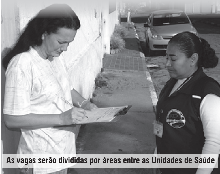
As vagas serão divididas por áreas entre as Unidades de Saúde

O local, dia e horário da prova serão divulgados no dia 11 de julho, no site da Prefeitura e em listas afixadas no Paço Municipal. Serão classificados o quintuplo do número de vagas.