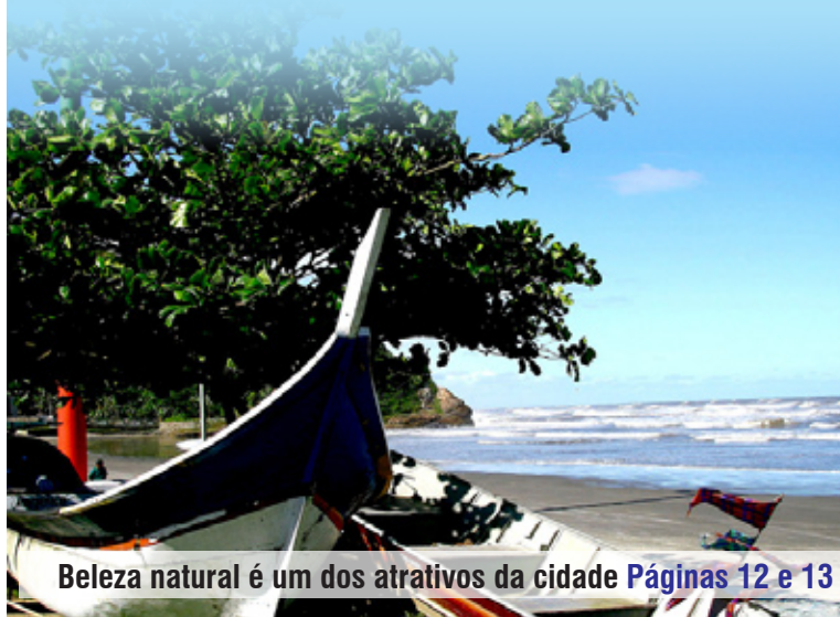
Beleza natural é um dos atrativos da cidade Páginas 12 e 13

A Cidade está entre os municípios do País mais visitados por brasileiros. Num estudo realizado pela Fundação Instituto de Pesquisas Econômicas (Fipe), publicado pelo Ministério do Turismo em 2009, Itanhaém ficou em 25º entre 137 cidades brasileiras pesquisadas.