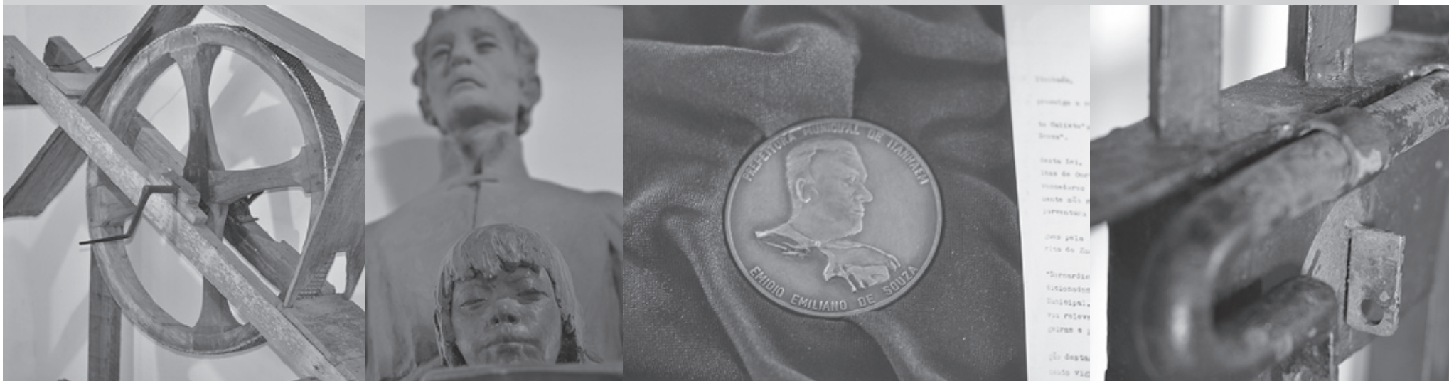
Entre as atrações estão equipamentos dos antigos engenhos, estátua de José de Anchieta e medalhas comemorativas. Detalhes confirmam a existência da antiga cadeia

O Museu Conceição de Itanhaém foi inaugurado em 22 de abril de 2010, em comemoração aos 478 anos do Município.