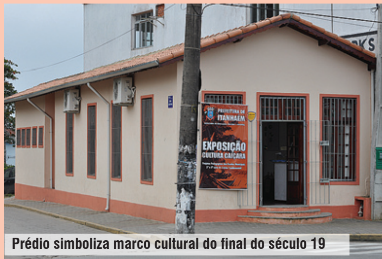
Prédio simboliza marco cultural do final do século 19

Inaugurado há 115 anos, o Gabinete de Leitura de Itanhaém representava muito mais que um simples espaço dedicado a leitura. Mas enfrentou um período de decadência e acabou sendo demolido. Este ano, a Prefeitura resgatou a memória do antigo monumento, concluindo a reconstrução do prédio em sua característica e posição originais, ao lado do Cruzeiro existente no início da rampa do Morro do Convento, no Centro.