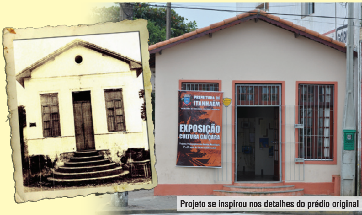
Projeto se inspirou nos detalhes do prédio original

Em maio de 1900, houve uma grande exposição em São Vicente, como parte das comemorações da inauguração do Monumento ao IV Centenário da descoberta do Brasil. O Gabinete de Leitura participou do evento, expondo vários objetos do seu museu, entre os quais as dragonas e as insígnias do Capitão-Mor de Itanhaém de 1700.