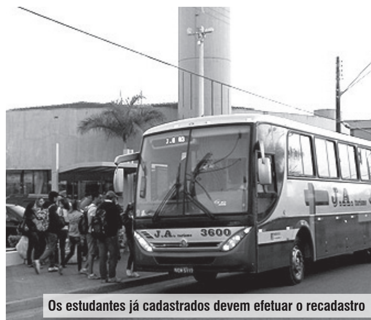
Os estudantes já cadastrados devem efetuar o recadastro

Vale lembrar que os universitários já cadastrados no programa deverão realizar o recadastro, levando um dos seguintes documentos à Secretaria: cópia do boleto pago referente à matrícula; cópia da carteira de identificação estudantil constando selo referente ao 2º semestre de 2011; ou declaração de matrícula atualizada. O nome do estudante deverá constar no documento