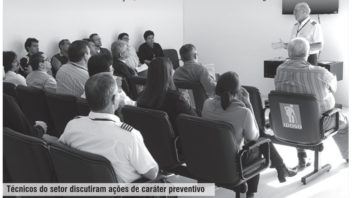
Técnicos do setor discutiram ações de caráter preventivo

Estatísticas do Daesp apontam que, considerando o número de passageiros, Itanhaém foi o 11º entre os 30 aeroportos paulistas, com 16.189 pessoas embarcando e desembarcando em 2010. Em números de aeronaves, o aeroporto itanhaense foi 12º, com 8.386 pousos e decolagens.