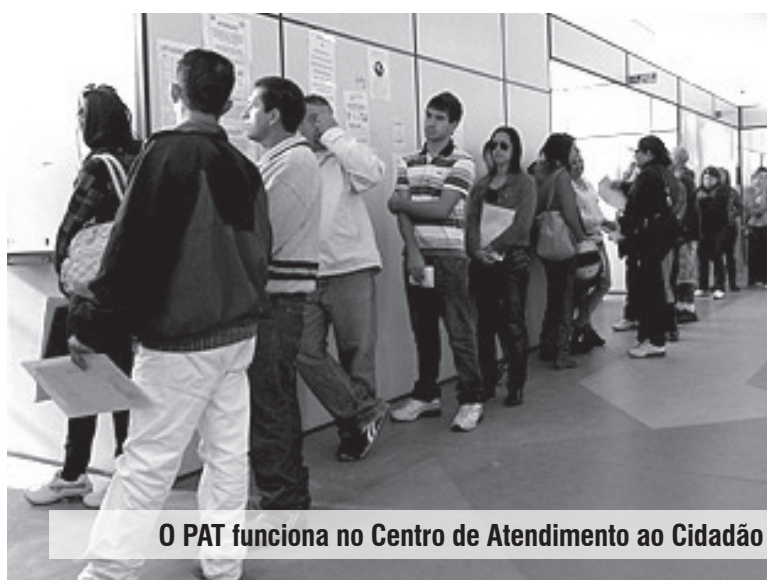
O PAT funciona no Centro de Atendimento ao Cidadão

Serão disponibilizadas 72 vagas: 70 para atendente de restaurante (não é necessário experiência) e 2 para técnico de manutenção, com experiência em refrigeração e manipulação de máquinas industriais. Para a entrega dos currículos serão distribuídas senhas: 400 no dia 27 de julho, 400 no dia 1 de