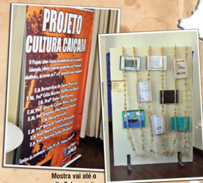
Mostra vai até o dia 5 de agosto