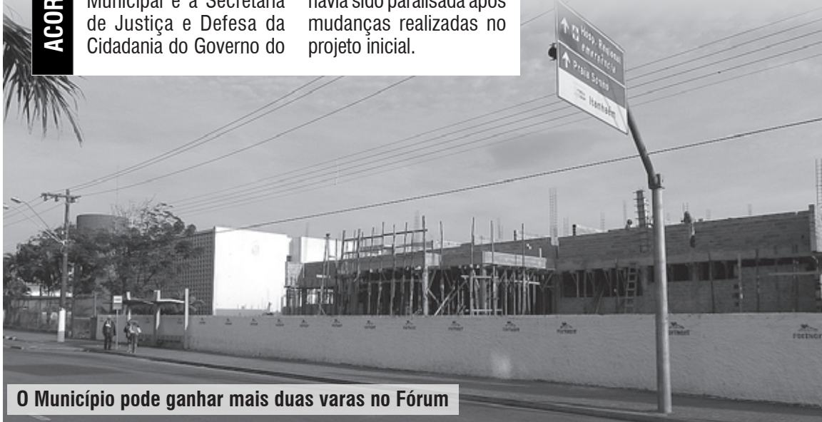
O Município pode ganhar mais duas varas no Fórum