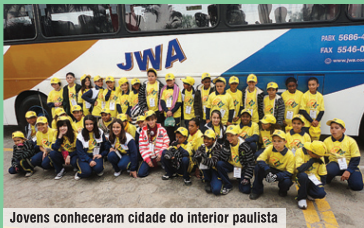
Jovens conheceram cidade do interior paulista