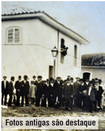
Fotos antigas são destaque

A cidade conta com uma ótima opção de passeio cultural no Centro Histórico. Trata-se do Museu Conceição de Itanhaém, que reúne um acervo com diversas fotos, jornais, livros e documentos raros, que guardam parte da história da segunda cidade mais antiga do Brasil.