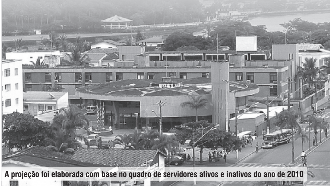
A projeção foi elaborada com base no quadro de servidores ativos e inativos do ano de 2010

O prefeito João Carlos Forssell credita esta estatística à união que o Governo e o Instituto têm para garantir o futuro dos servidores. “O maior bem de nossa administração são os servidores, que são a parte mais importante da estrutura da Prefeitura, tanto é que em nossa gestão, nunca atrasamos o dia de pagamento, porque temos um compromisso com eles. O funcionário se sente motivado com a perspectiva de que sua aposentadoria está segura”.