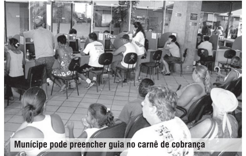
Munícipe pode preencher guia no carnê de cobrança