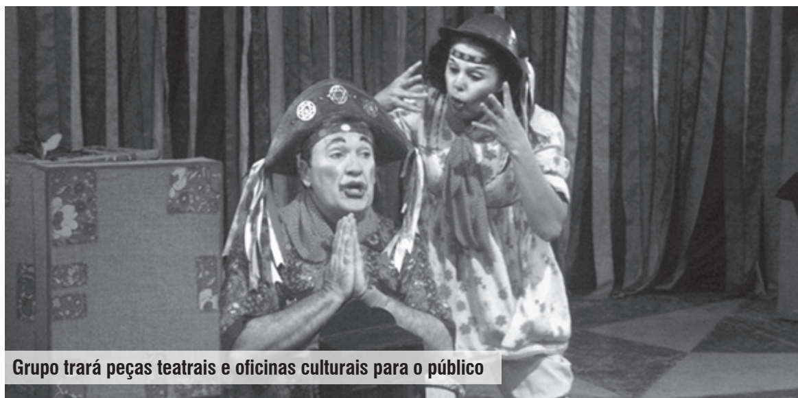
Grupo trará peças teatrais e oficinas culturais para o público