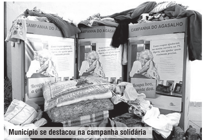
Município se destacou na campanha solidária

A 6ª Campanha Metropolitana do Agasalho 2011 arrecadou 361.441 agasalhos entre os nove municípios da Baixada Santista. Itanhaém ficou em 3º lugar no total de arrecadações, com 68.139 peças, entre cobertores e roupas que foram doados pela população durante a campanha.