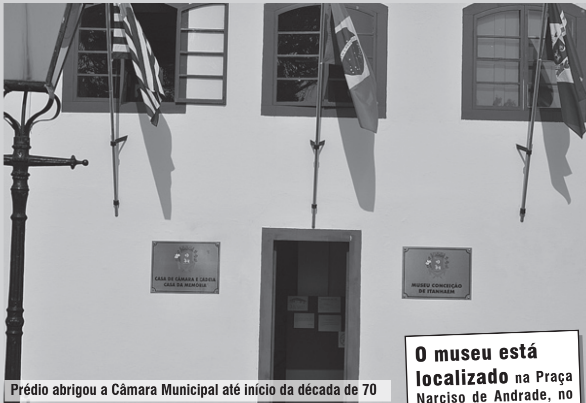
Prédio abrigou a Câmara Municipal até início da década de 70