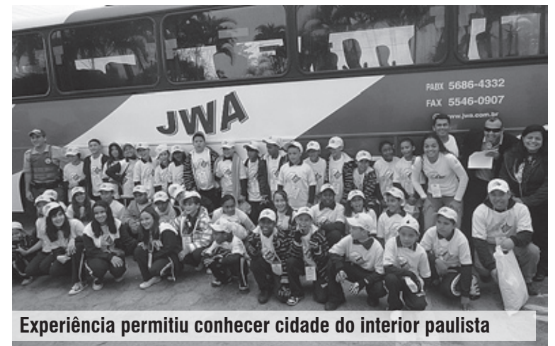
Experiência permitiu conhecer cidade do interior paulista

Entusiasmados e cheios de histórias para contar, os alunos da E.M. José Teixeira Rosas retornaram no dia 22 de julho, do projeto Turismo do Saber. A iniciativa propiciou 40 estudantes entre 9 a 11 anos a conhecerem por cinco dias as montanhas do interior, na Cidade de São Bento do Sapucaí.