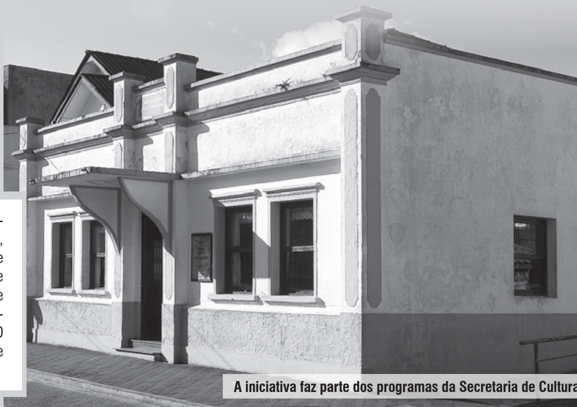
A iniciativa faz parte dos programas da Secretaria de Cultura

Como ator, dedicou-se a diversos espetáculos de teatro, fez contação de histórias no SESC/SP, enquanto na televisão construiu e deu voz à árvore da novela “Meu pé de laranja lima” (TV Bandeirantes), marcante sucesso na época, tendo ainda trabalhado como criador de efeitos especiais (SBT), além de realizar um trabalho de miniaturização para o apresentador Faustão (Rede Globo).