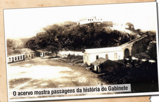
O acervo mostra passagens da história do Gabinete