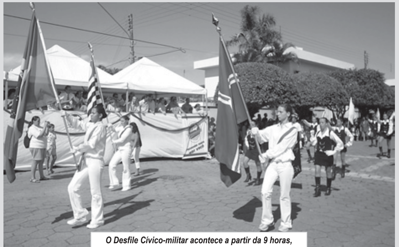
O Desfile Cívico-militar acontece a partir da 9 horas, na Avenida Jaime de Castro (entrada oficial da Cidade)

E, para encerrar a Mostra não poderia faltar a música, produzida pelo Trio Axial. Gerada por máquinas, ela expõe a interação entre a tradição e a tecnologia, que faz com que o músico se relacione com os diversos meios de acesso à democratização cultural.