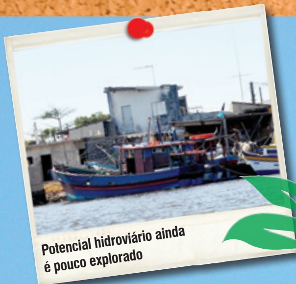
Potencial hidroviário ainda é pouco explorado