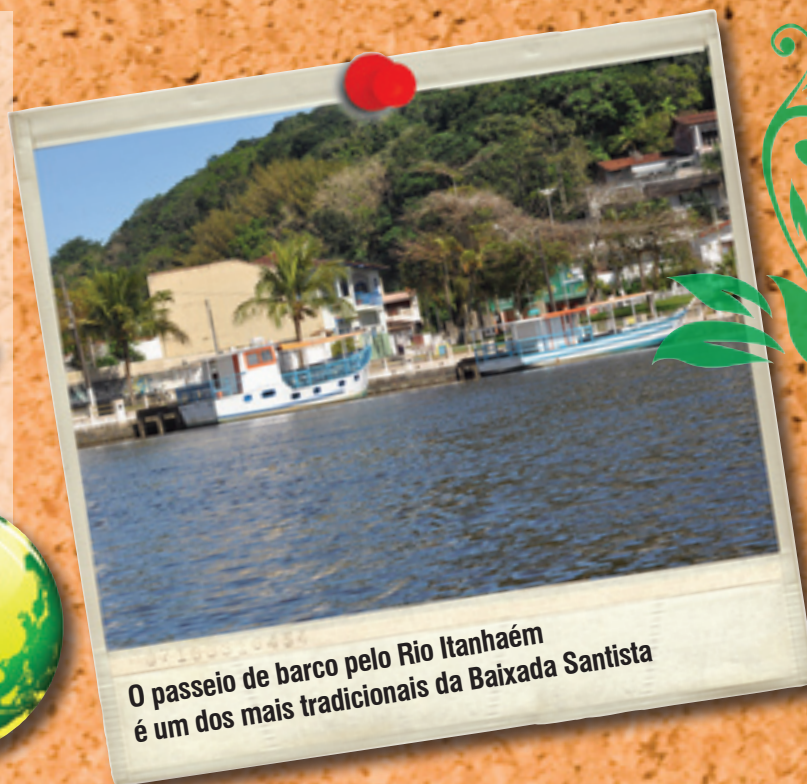
O passeio de barco pelo Rio Itanhaém é um dos mais tradicionais da Baixada Santista