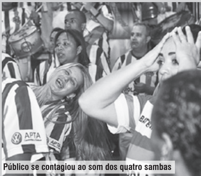
Público se contagiou ao som dos quatro sambas