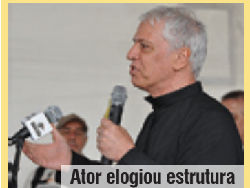
Ator elogiou estrutura

Com 63 anos de idade e mais de 30 anos de carreira, Nuno Leal Maia é um nome consagrado da televisão, cinema e do teatro. Um ator que deixou na memória personagens marcantes, que até são lembrados pelo público. E que mantém uma relação afetiva bem próxima com Itanhaém.