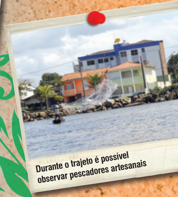
Durante o trajeto é possível observar pescadores artesanais