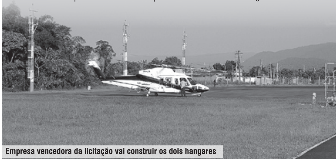
Empresa vencedora da licitação vai construir os dois hangares