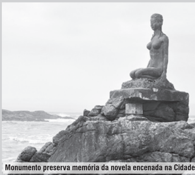
Monumento preserva memória da novela encenada na Cidade

Após a novela, para marcar as gravações externas, Serafim Gonzalez esculpiu uma estátua em pedra na Praia dos Pescadores, em frente à Ilha das Cabras. Mais tarde, a escultura foi substituída por outra de fibra. Atualmente, o local onde está a obra é um dos mais visitados por turistas e munícipes de Itanhaém, sendo muito frequentada por surfistas. Veja fotos do monumento no Flickr da Prefeitura: www.flickr.com/governomunicipaldeitanhaem