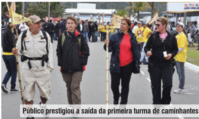
Público prestigiou a saída da primeira turma de caminhantes

“A nossa história está intimamente ligada à presença dos jesuítas, em especial do padre Anchieta, que celebrou a paz de