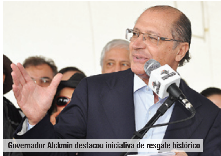
Governador Alckmin destacou iniciativa de resgate histórico

Iperoig, que foi a paz entre índios e os portugueses. Então aqui está toda a nossa história. Começa com Anchieta, mas são os passos dos jesuítas, como teremos os passos dos Bandeirantes”, afirmou o governador Alckmin.