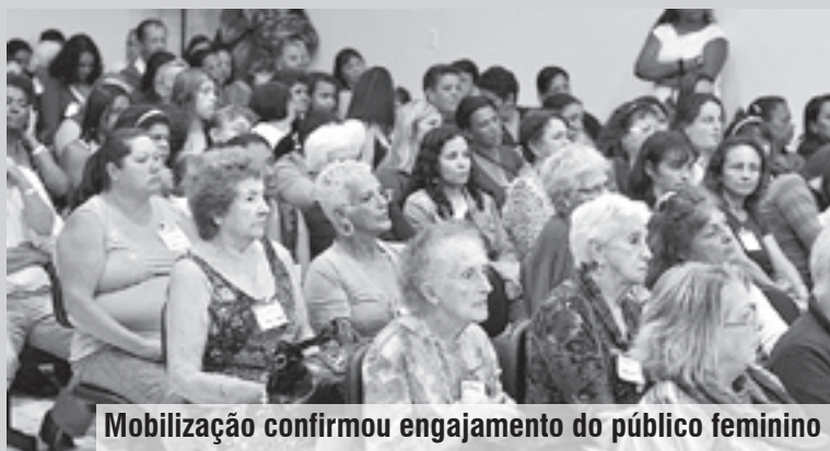
Mobilização confirmou engajamento do público feminino

O evento, que reuniu mais de 300 pessoas na Câmara Municipal, teve como objetivo buscar alternativas quanto às políticas públicas para as mulheres, além de definir prioridades de políticas para o próximo período, tendo como base a avaliação, atualização e aprimoramento das ações propostas no II Plano Nacional de