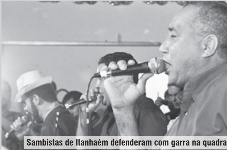
Sambistas de Itanhaém defenderam com garra na quadra