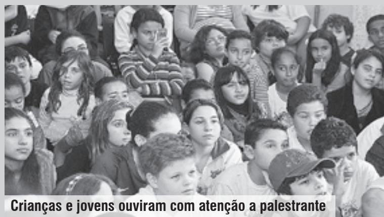
Crianças e jovens ouviram com atenção a palestrante

Este ano, o Viagem Literária já trouxe ilustres convidados para participar dos módulos. Passaram pelo espaço escritores como Ignácio Loyola e Roberto Rocha Pombo.