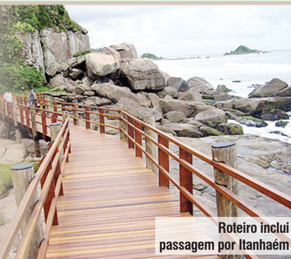
Roteiro inclui passagem por Itanhaém

O cartão servirá como identificação para que o caminhante receba descontos em pousadas e restaurantes. Ele contém um chip que, ao ser passado por pórticos eletrônicos espalhados pela rota oficial, registra a passagem na página pessoal do usuário no site. Essa página terá um espaço em que o usuário poderá escrever relatos, publicar fotos e compartilhar sua experiência com outros participantes do Caminho.