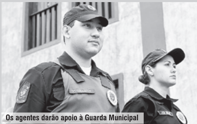
Os agentes darão apoio à Guarda Municipal