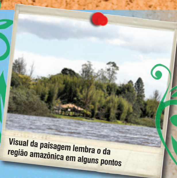
Visual da paisagem lembra o da região amazônica em alguns pontos