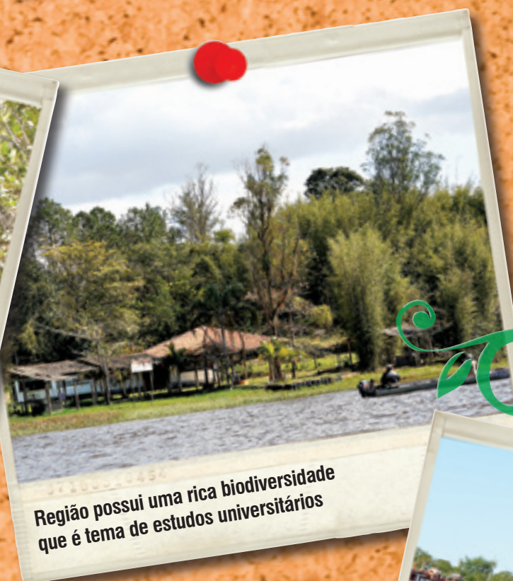
Região possui uma rica biodiversidade que é tema de estudos universitários