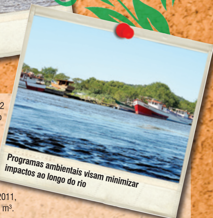
Programas ambientais visam minimizar impactos ao longo do rio