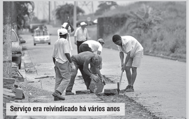
Serviço era reivindicado há vários anos

“Levando a água tratada pela Sabesp para as residências, estaremos sem dúvida contribuindo para a melhoria da qualidade de vida dos moradores”, assinalou o secretário.