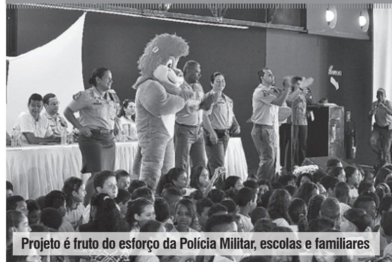
Projeto é fruto do esforço da Polícia Militar, escolas e familiares

O programa que teve duração de três meses, formou 480 estudantes de ensino fundamental das escolas