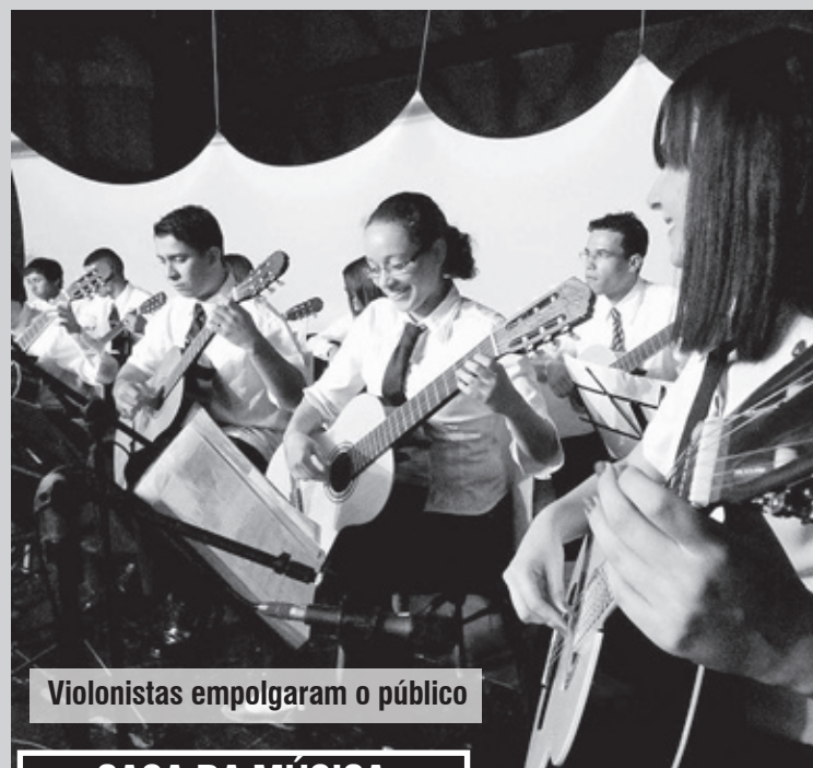
Violonistas empolgaram o público