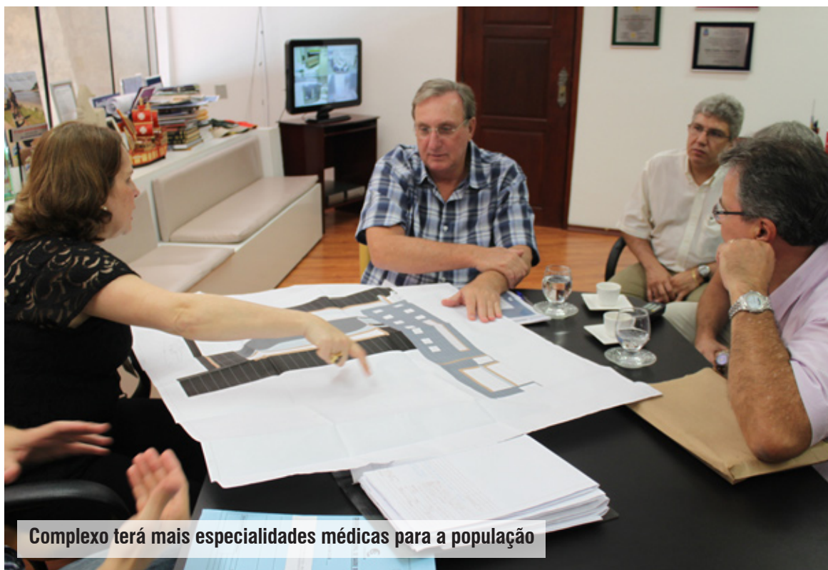
Complexo terá mais especialidades médicas para a população

Com a ampliação, o hospital, que atualmente dispõe de 94 leitos, passará a ter 240, sendo 20 destinados a UTI Adulto, 10 UTI Neonatal, 10 pediátricos e 10 semi-intensivo. Além disso, o local contará com um heliponto para transporte de pacientes em extrema urgência. A obra está orçada em aproximadamente