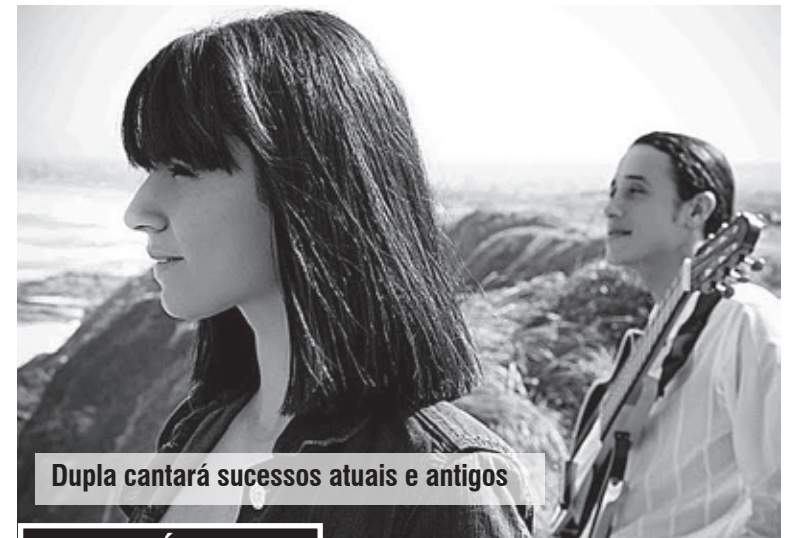
Dupla cantará sucessos atuais e antigos

O trabalho do duo no formato de voz e violão, já foi destaque na Casa das Rosas, em São Paulo, no Espaço Cultural Raul Cortez, em Mongaguá, no Palácio das Artes, em Praia Grande e no II Festival de Música em São Vicente.