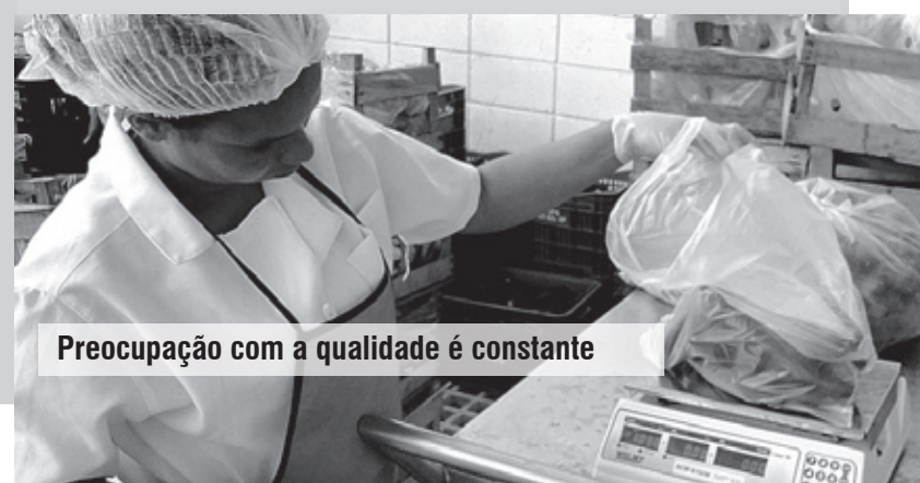
Preocupação com a qualidade é constante

Itanhaém conta com a parceria: Sacolão RB; CUCA Supermercados; Supermercados Saito; Supermercados Prático; Kroiks; Feira Livre do Bopiranga, Cabuçu, Suarão e KM 100.