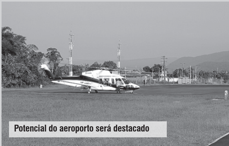
Potencial do aeroporto será destacado