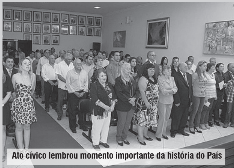
Ato cívico lembrou momento importante da história do País