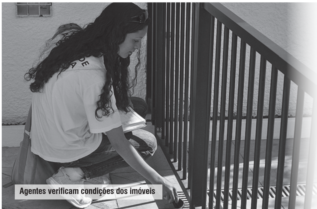
Agentes verificam condições dos imóveis