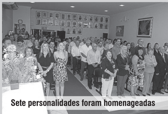
Sete personalidades foram homenageadas