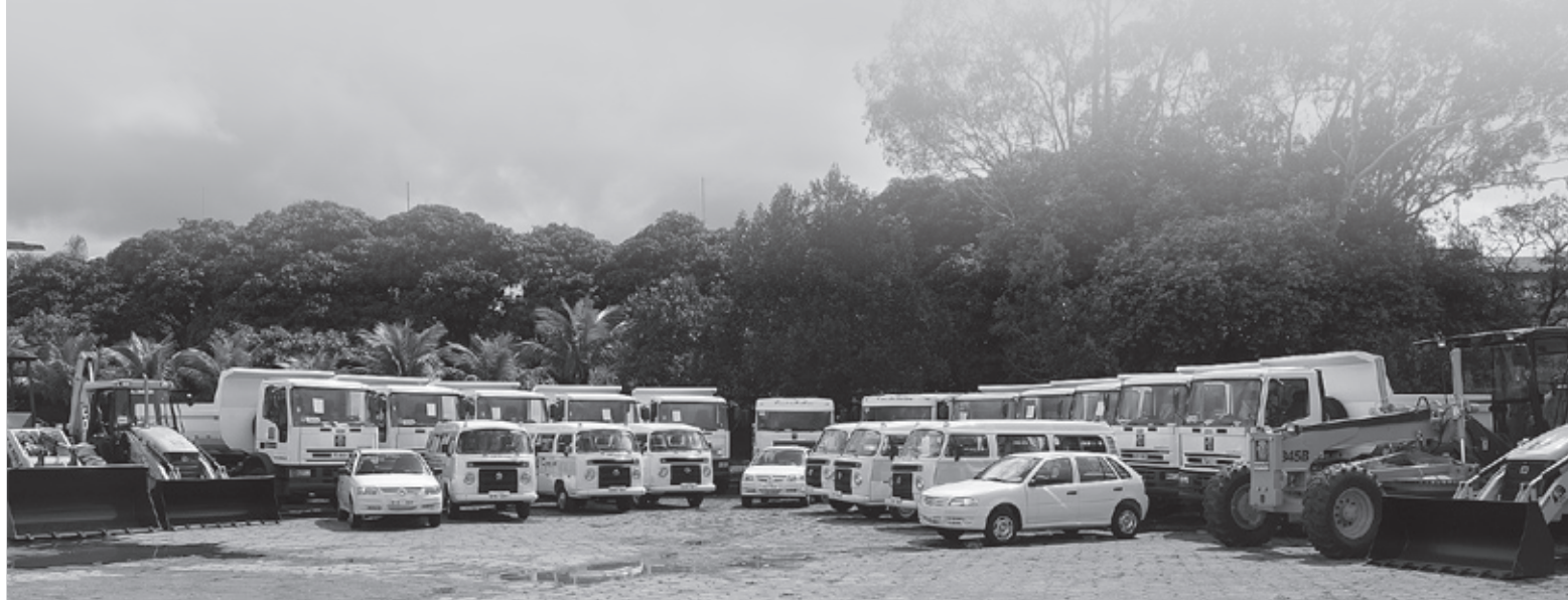
Equipamentos serão usados nos serviços de manutenção de vias e transporte para o serviço público

PAI – Obras, Serviços, Limpeza e Reurbanização de Espaços Públicos é uma das cinco prioridades do Plano de Ação de Itanhaém (PAI), o maior plano de investimento da história da Cidade. Somente nesta área será aplicado um volume inicial de mais de R$ 34 milhões durante este ano.