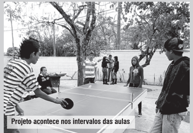
Projeto acontece nos intervalos das aulas

Construída em alvenaria há dois anos, a mesa ajuda a melhorar o rendimento escolar,