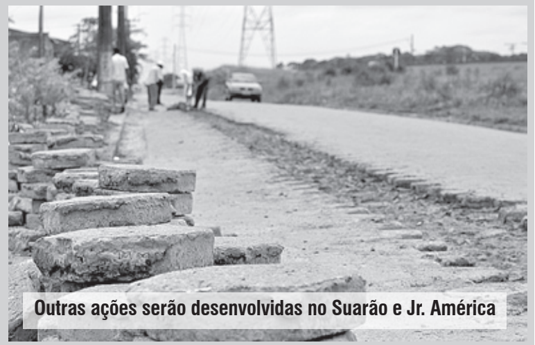
Outras ações serão desenvolvidas no Suarão e Jr. América