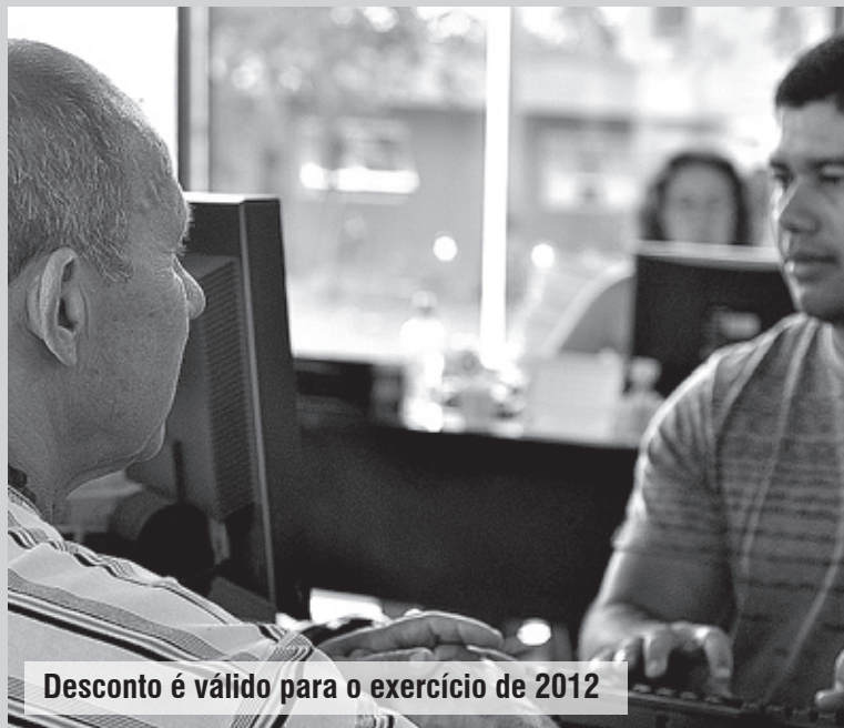
Desconto é válido para o exercício de 2012

Vale lembrar que, com a autorização do pedido de desconto, o aposentado, pensionista ou beneficiário só precisará