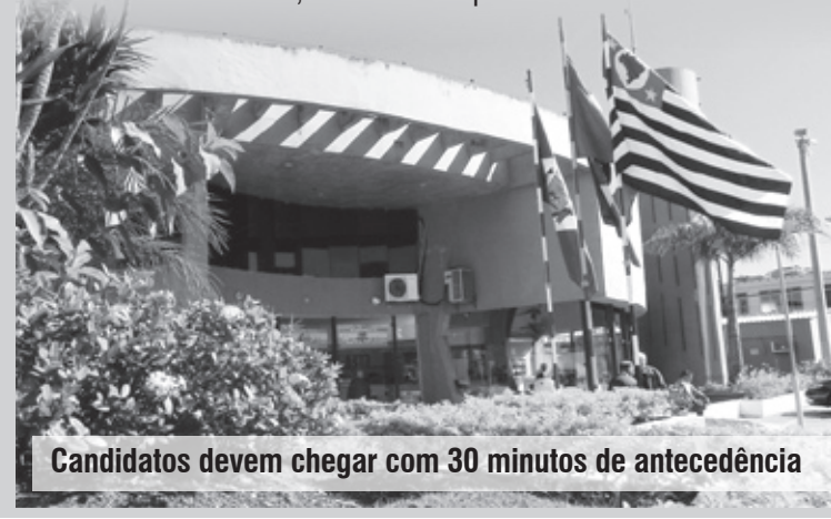
Candidatos devem chegar com 30 minutos de antecedência