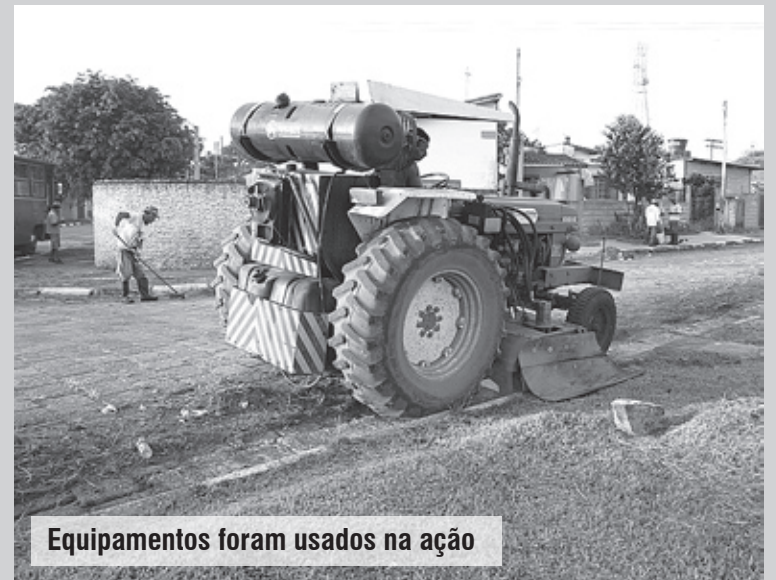
Equipamentos foram usados na ação

O Mutirão nos Bairros é uma das prioridades do Plano de Ação de Itanhaém (PAI), iniciado em janeiro deste ano. A novidade é que a Prefeitura fez a aquisição equipamentos, entre caminhões, escavadeira, pás e moto niveladora. O maquinário, orçado em cerca de R$ 3 milhões, estará em breve nas ruas.