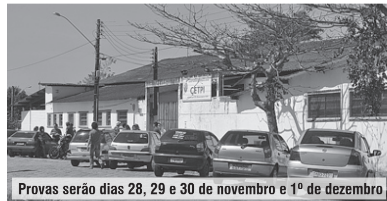
Provas serão dias 28, 29 e 30 de novembro e 1º de dezembro

Para realizar a prova, os candidatos deverão comparecer ao local com pelo menos 30 minutos de antecedência, munidos do comprovante de inscrição, RG