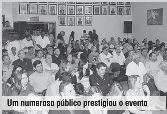
Um numeroso público prestigiou o evento