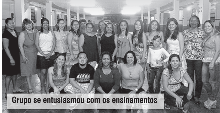
Grupo se entusiasmou com os ensinamentos