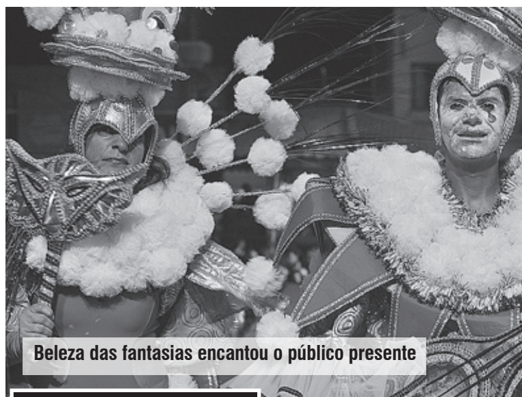
Beleza das fantasias encantou o público presente