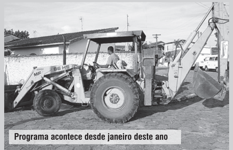
Programa acontece desde janeiro deste ano

gentes do bairro. "A limpeza e conservação das ruas da Cidade são um compromisso do nosso Governo", completa Forssell.