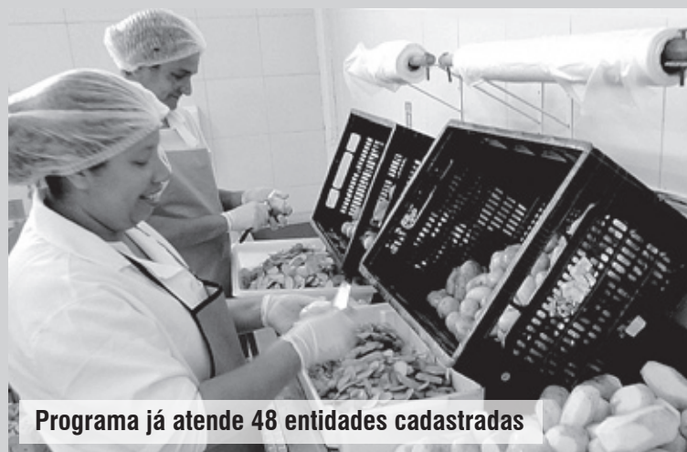
Programa já atende 48 entidades cadastradas

A gestão deste programa do MEC/FNDE está sob responsabilidade compartilhada com o Departamento da Merenda Escolar para a aquisição de produtos da agricultura familiar. Em 2010, os 30% exigidos pela resolução foram destinados a compra da banana. Já em 2011, os fornecedores puderam diversificar a oferta dos produtos tais como couve, inhame, chuchu, entre outros.