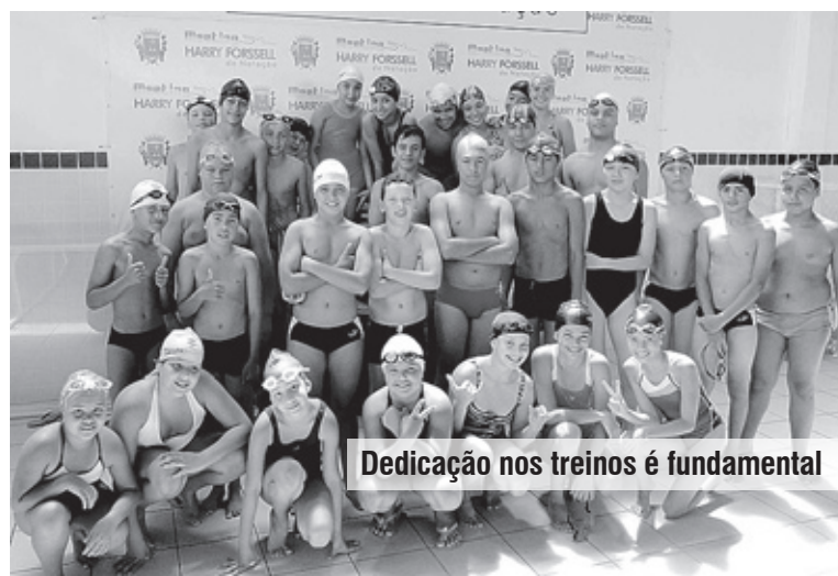
Dedicação nos treinos é fundamental