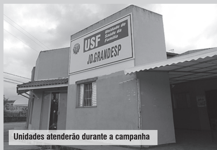
Unidades atenderão durante a campanha

Vale lembrar que o CINI e as unidades de saúde já realizam a testagem convencional de segunda a sexta-feira, das 8 às 16 horas. Além disso,