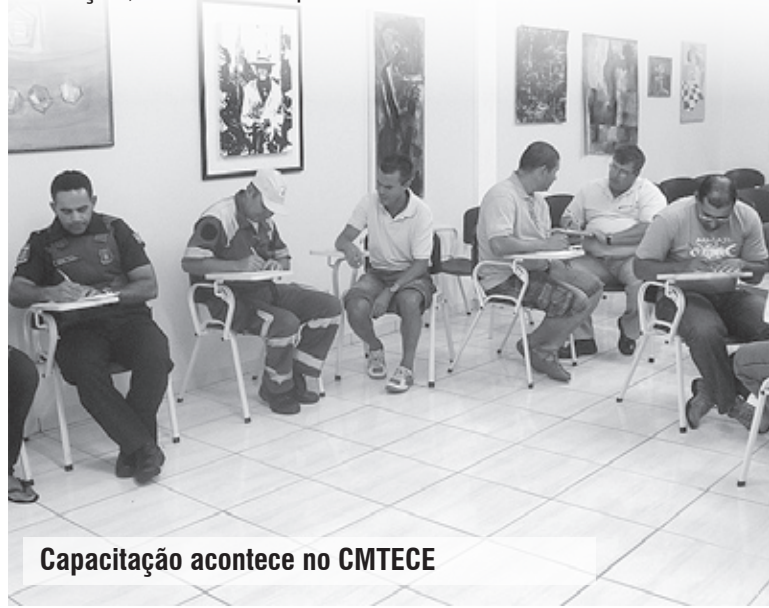
Capacitação acontece no CMTECE

A finalidade do treinamento é dispor ao servidor, de modo descontraído, formas de lidar com adversidades do dia a dia de trabalho.