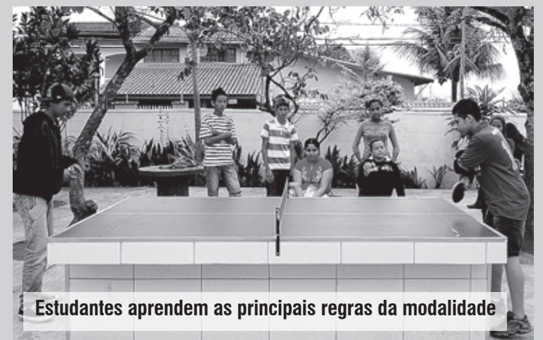
Estudantes aprendem as principais regras da modalidade

Antes de iniciarem, os estudantes aprendem as principais regras para praticar a modalidade. Além da mesa e da rede, os outros equipamentos necessários para a prática deste esporte são bolas e as raquetes, disponibilizadas pela unidade.