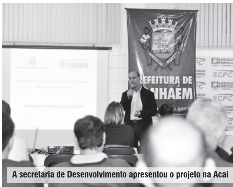
A secretaria de Desenvolvimento apresentou o projeto na Acai

“Atualmente, um alvará expedido pela Prefeitura passa por diversos órgãos. Porém, com a adesão ao SIL, o empresário poderá ter a sua licença de funcionamento na mesma hora. Depois, a fiscalização municipal irá realizar os trabalhos necessá-