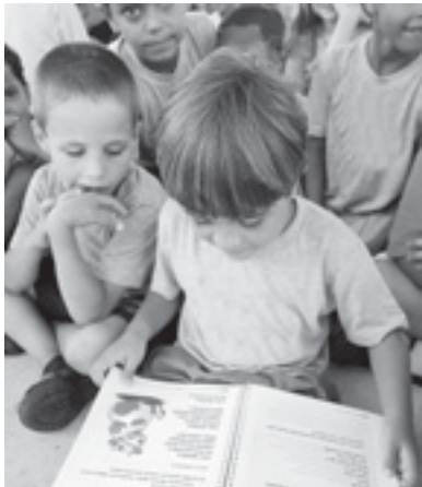
O evento acontece na Faculdades Itanhaém

A I Feira do Livro de Itanhaém conta com o apoio do secretaria municipal de Educação, Cultura e Esportes, através do departamento de Cultura, Quiosque Bezerra da Praia, e com a parceria da Associação Comercial e Agrícola de Itanhaém (ACAI), Colônia de Férias Cabos e Soldados, Sindicato dos Professores do Ensino Oficial do Estado de São Paulo (Apeoesp), Espaço Cultural Suarão, Entre Livros, Circula Art', Adriana e Decorações e Faculdades Itanhaém.