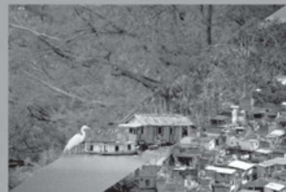
A sua ligação faz a diferença.

Por isso, colabore com a prefeitura denunciando estas violências contra o meio ambiente.