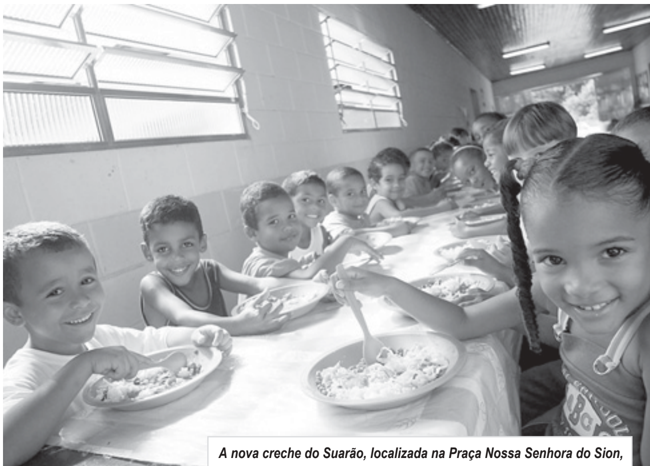
A nova creche do Suarão, localizada na Praça Nossa Senhora do Sion, s/nº, atenderá cerca de 50 crianças, de 4 meses a 4 anos e 11 meses