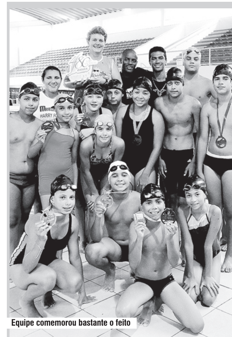
Equipe comemorou bastante o feito

Confira os dias dos grupos de caminhada: