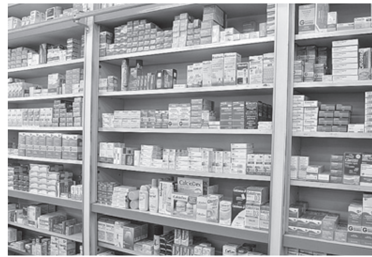
Itanhaém é o único município da Baixada a contar com o serviço

Distribuir remédios gratuitamente. Esse é o objetivo da Farmácia Solidária de Itanhaém, que foi implantada há seis anos na Cidade pelo Governo Municipal, por meio da Secretaria de Saúde. Com doações da população e dos municípios vizinhos, como Peruíbe, Itariri e Pedro de Toledo, a farmácia consegue fornecer todos os tipos de medicamentos. O Município é o único da Baixada a contar com esse serviço.