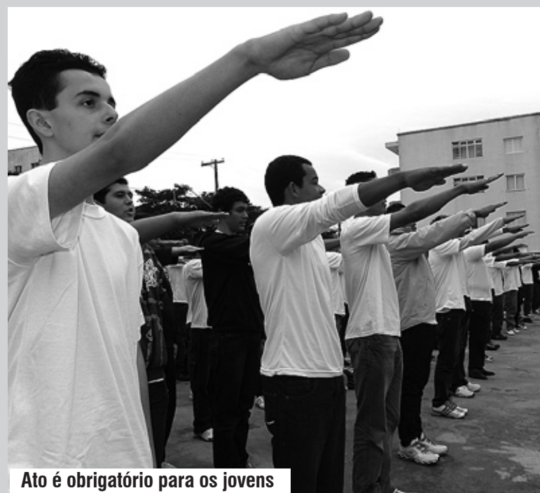
Ato é obrigatório para os jovens

O Serviço Militar consiste no exercício de atividades específicas desempenhadas nas Forças Armadas (Exército, Marinha e Aeronáutica). Todos os brasileiros do sexo masculino são obrigados a realizar o Alistamento Militar no ano em que completarem 18 anos de idade. Os jovens que não se alistarem no prazo previsto são considerados refratários terão dificuldades em obter outros documentos pessoais necessários, além de pagarem multa.