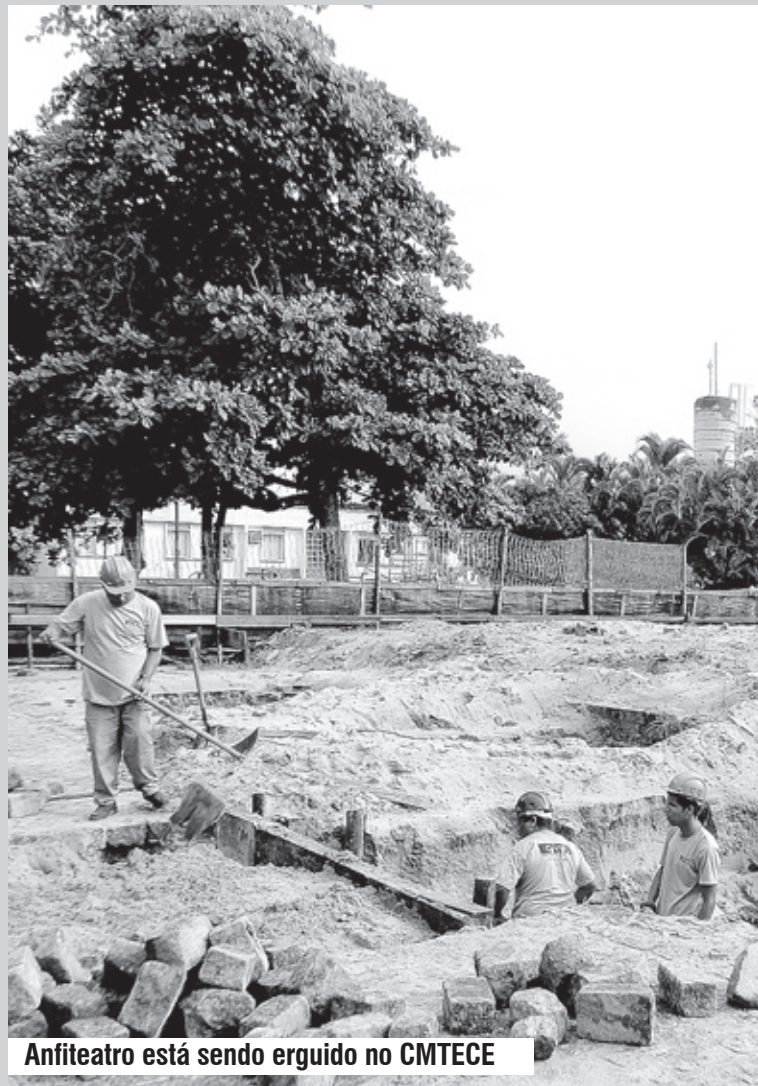
Anfiteatro está sendo erguido no CMTECE