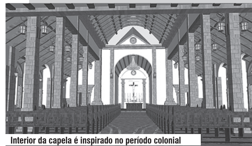
Interior da capela é inspirado no período colonial

Itanhaém pode ter um santuário em homenagem ao Padre José de Anchieta, no Bairro Cibratel. O projeto do complexo turístico religioso foi apresentado no dia 12 de janeiro pelo prefeito João Carlos Forssell para o Governo do Estado, que está analisando a viabilidade econômica para concretizar a obra, orçada em torno de R$ 12 milhões.