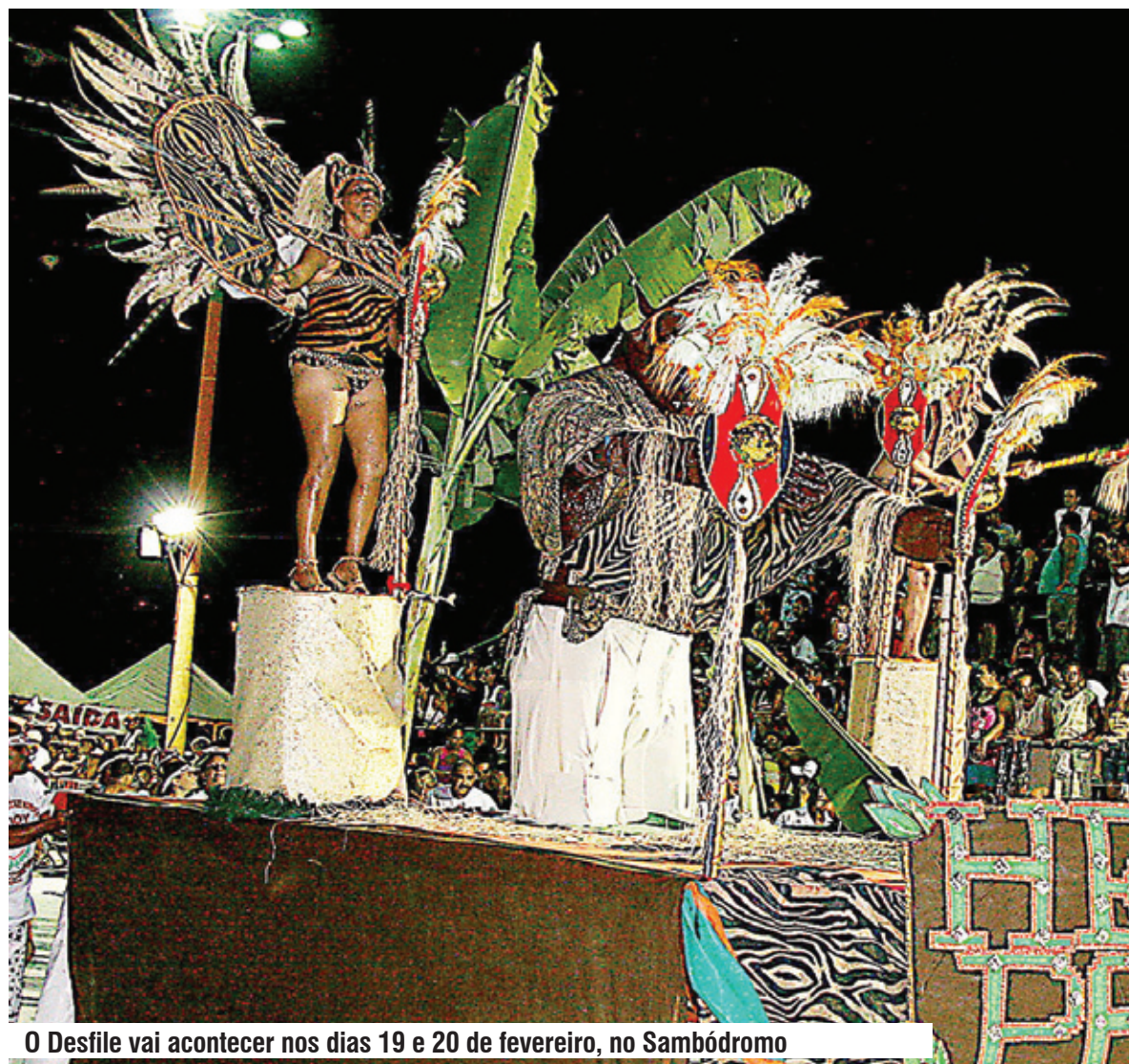
O Desfile vai acontecer nos dias 19 e 20 de fevereiro, no Sambódromo

a Explosão do Cesp, do Grupo de Acesso. A escola do Grupo Especial com menor pontuação cai para o Grupo de Acesso do Carnaval 2013. Página 5