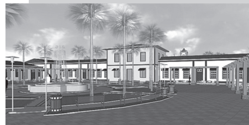
Projeto inclui centro de recepção aos romeiros

DEVOÇÃO ■ Conceito do projeto consiste em criar um espaço de contemplação, valorizando a figura do chamado Apóstolo do Brasil, que teve passagem por Itanhaém