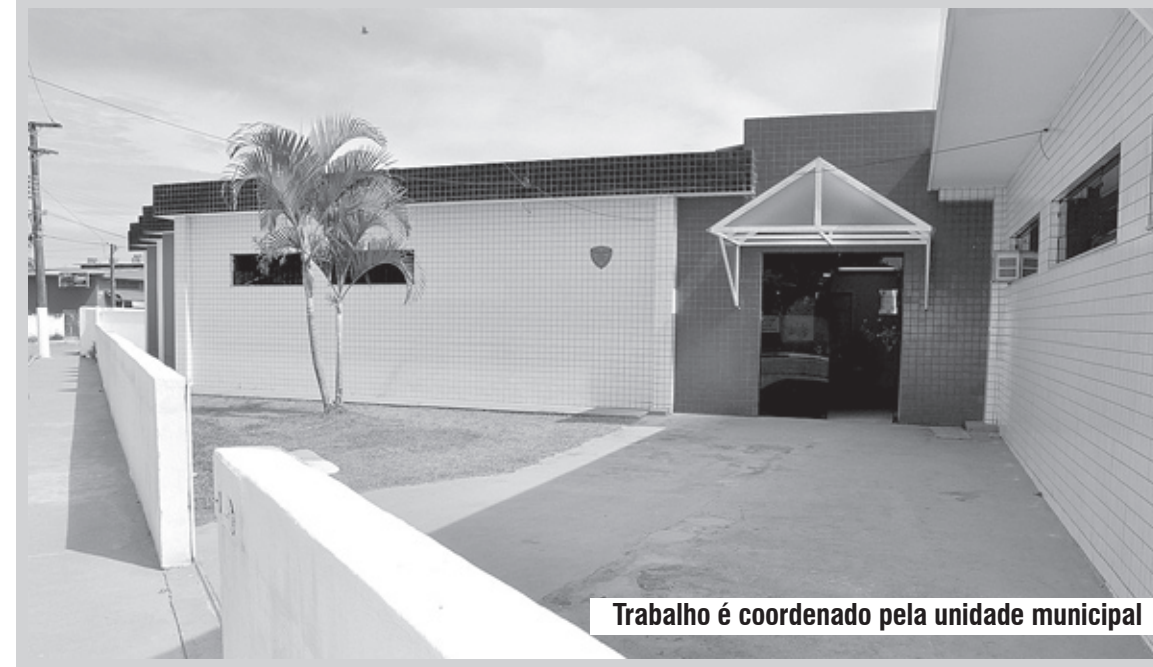
Trabalho é coordenado pela unidade municipal

Em fevereiro, iniciam os encontros do grupo de aleitamento. As mães se reúnem e recebem orientações sobre os cuidados na hora do banho do bebê, importância da amamentação, entre outras dicas.