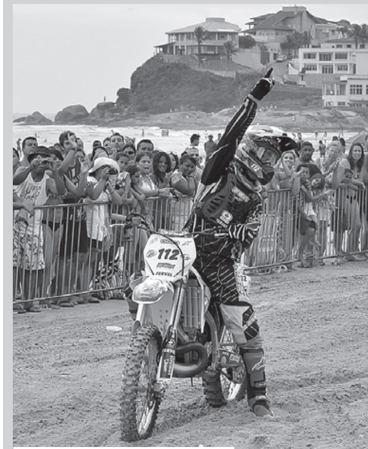
Presença dos pilotos atraiu multidão

RADICAL ■ Munícipes e turistas tiveram a chance presenciar manobras radicais de uma das melhores equipes de Motocross Freestyle do Brasil