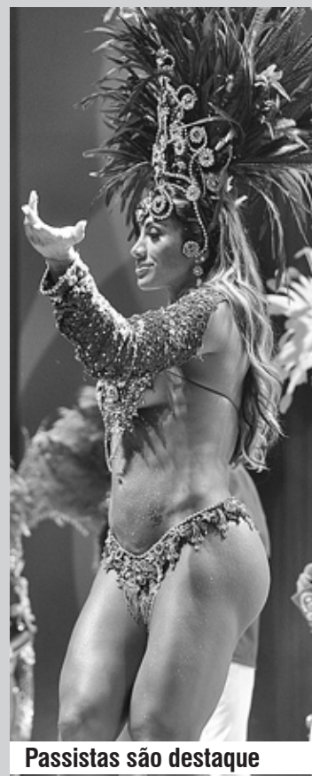
Passistas são destaque

A tradição da segunda cidade mais antiga do País será levada para a passarela do samba para milhões de espectadores por meio da televisão em horário nobre, uma vez que a agremiação será a segunda a entrar no desfile do dia 18 de fevereiro (sábado), por volta da meia-noite.