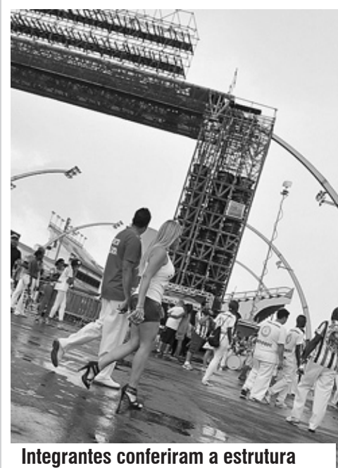
Integrantes conferiram a estrutura