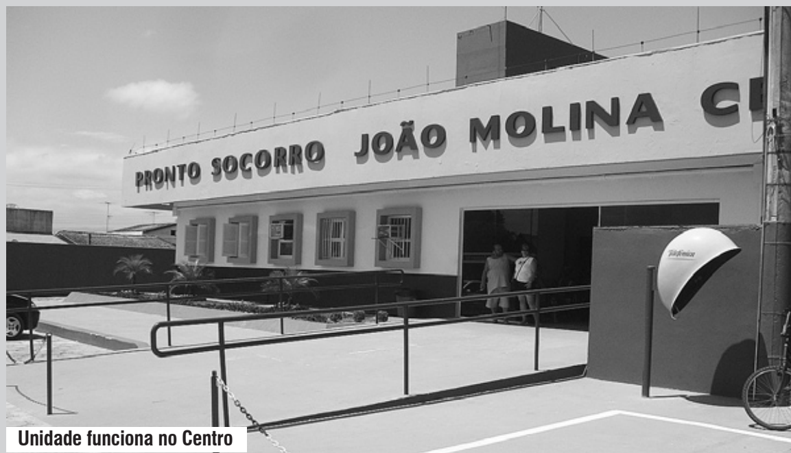
Unidade funciona no Centro

BALANÇO ■ Com efetivo e estoque reforçado, a unidade conseguiu atender ao expressivo aumento da população flutuante