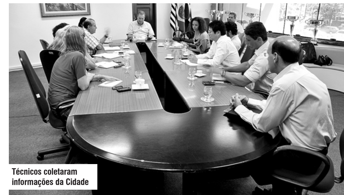
Técnicos coletaram informações da Cidade

www.facebook.com/governomunicipaldeitanhaem