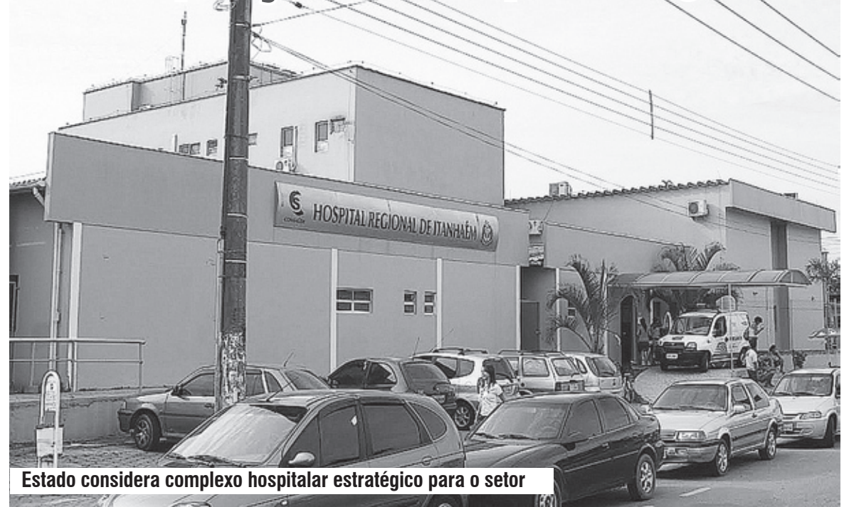
Estado considera complexo hospitalar estratégico para o setor

AMPLIAÇÃO ■ A nova estrutura terá sete pavimentos e irá ocupar uma área de 10.283,49 m 2 , integrada ao prédio atual, oferecendo 240 leitos