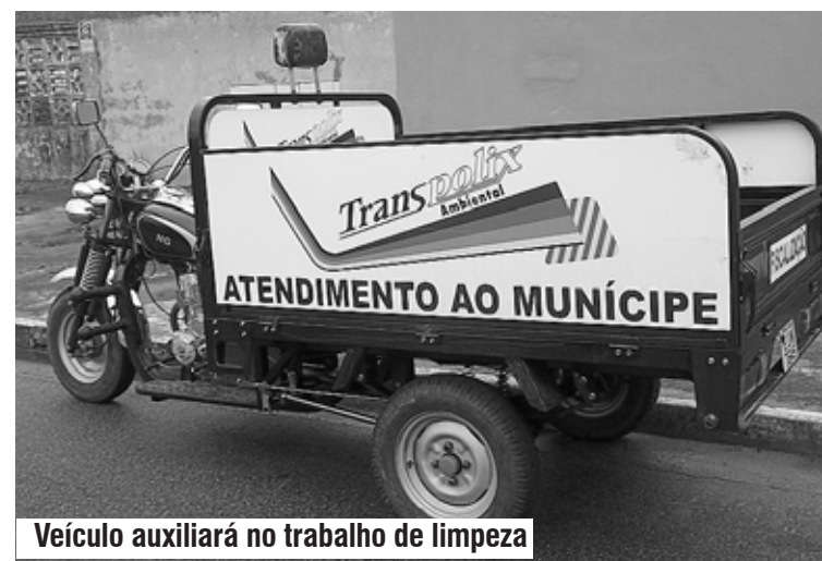
Veículo auxiliará no trabalho de limpeza

Após o chamado, a Prefeitura de Itanhaém vai entrar em contato com a empresa responsável, a Transpolix, e o triciclo irá até o bairro. Caso o caminhão de coleta de lixo não tenha passado no horário e dia previsto, o serviço será realizado. Além disso, o funcionário irá orientar o munícipe sobre o cronograma de coleta na região.