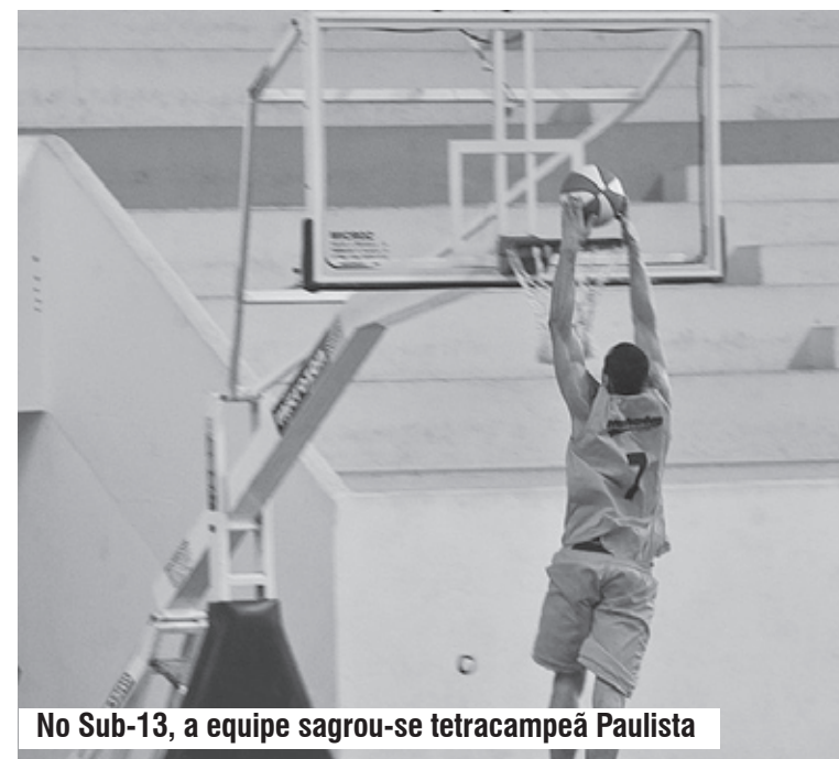
No Sub-13, a equipe sagrou-se tetracampeã Paulista

Após um ano de glória, o basquete itanhaense planeja retornar os treinos ainda no início de fevereiro. Com dois títulos alcançados na última temporada, a comissão técnica pretende manter a forma e repetir os bons resultados atingidos na Liga Paulista de Basquete (LPB) e nas demais competições.