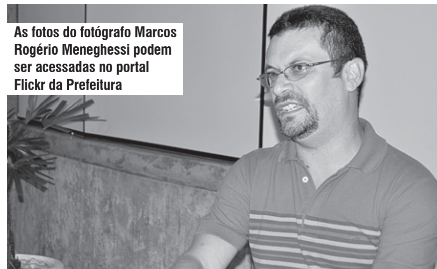
As fotos do fotógrafo Marcos Rogério Meneghessi podem ser acessadas no portal Flickr da Prefeitura

“Nosso próximo passo é o de criar um coletivo de fotógrafos amadores. A ideia, inclusive, partiu do próprio Meneghessi que vai apresentar um projeto nesse sentido”, disse Lousada ressaltando o aniversário da Cidade. “Estamos comemorando os 480 anos de fundação de Itanhaém, nada melhor do que retratarmos em diversos olhares”.