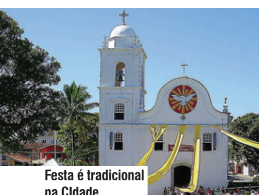
Festa é tradicional na Cidade

Itanhaém terá 15 novos policiais civis para reforçar a segurança