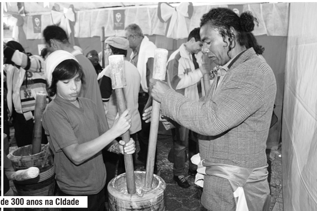
O evento é um dos mais tradicionais da Baixada Santista, sendo realizado há mais de 300 anos na Cidade

Já iniciaram os preparativos para uma das mais antigas celebrações religiosas da Baixada Santista: a Festa do Divino, que esse ano acontece de 19 de maio a 3 de junho em Itanhaém. O festejo terá uma programação repleta de rituais e costumes, como Folia do Rio Acima, Noite da Soca, Alvorada Festiva, Abertura do Império, Missa Solene, Encerramento do Setenário, Procissão do Divino Espírito Santo e outros.