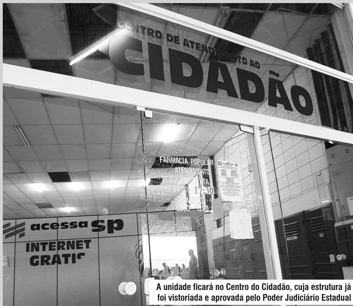
A unidade ficará no Centro do Cidadão, cuja estrutura já foi vistoriada e aprovada pelo Poder Judiciário Estadual