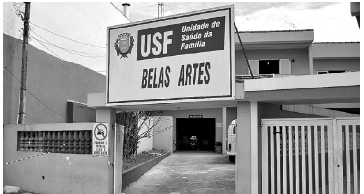
Nos últimos anos a unidade vem conquistando bons resultados em eventos como o Dia da Mulher

Uma equipe de três médicos, três enfermeiros e três de agentes de saúde. Esse é o grupo que atende a população de cerca de 14 mil pessoas de seis bairros que a Unidade de Saúde da Família (USF) do Belas Artes cobre, que são: Praia do Sonho, Cibratel I e II, Jardim Ieda, Jardim Sabaúna, além do próprio Belas Artes.