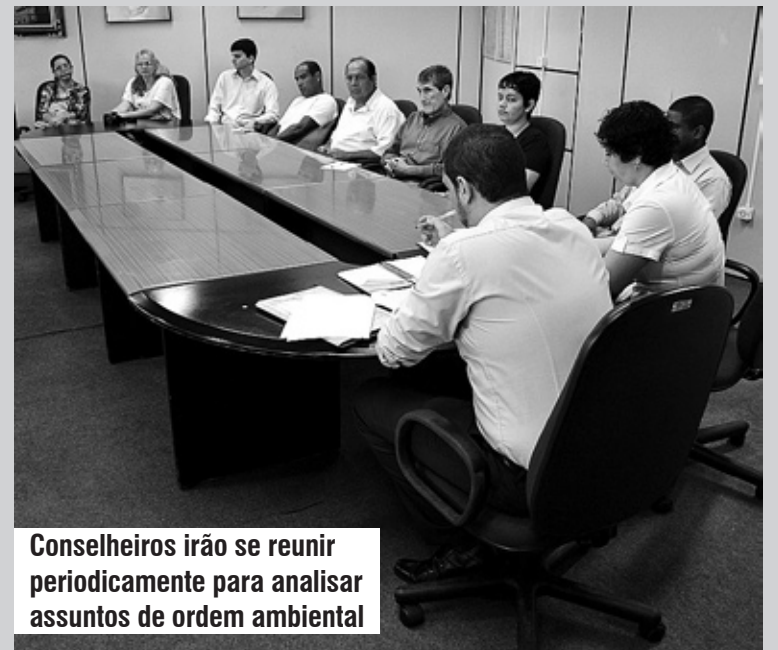
Conselheiros irão se reunir periodicamente para analisar assuntos de ordem ambiental

O encontro serviu para discutir o cronograma de trabalho para o ano. A eleição do presidente do conselho acon-