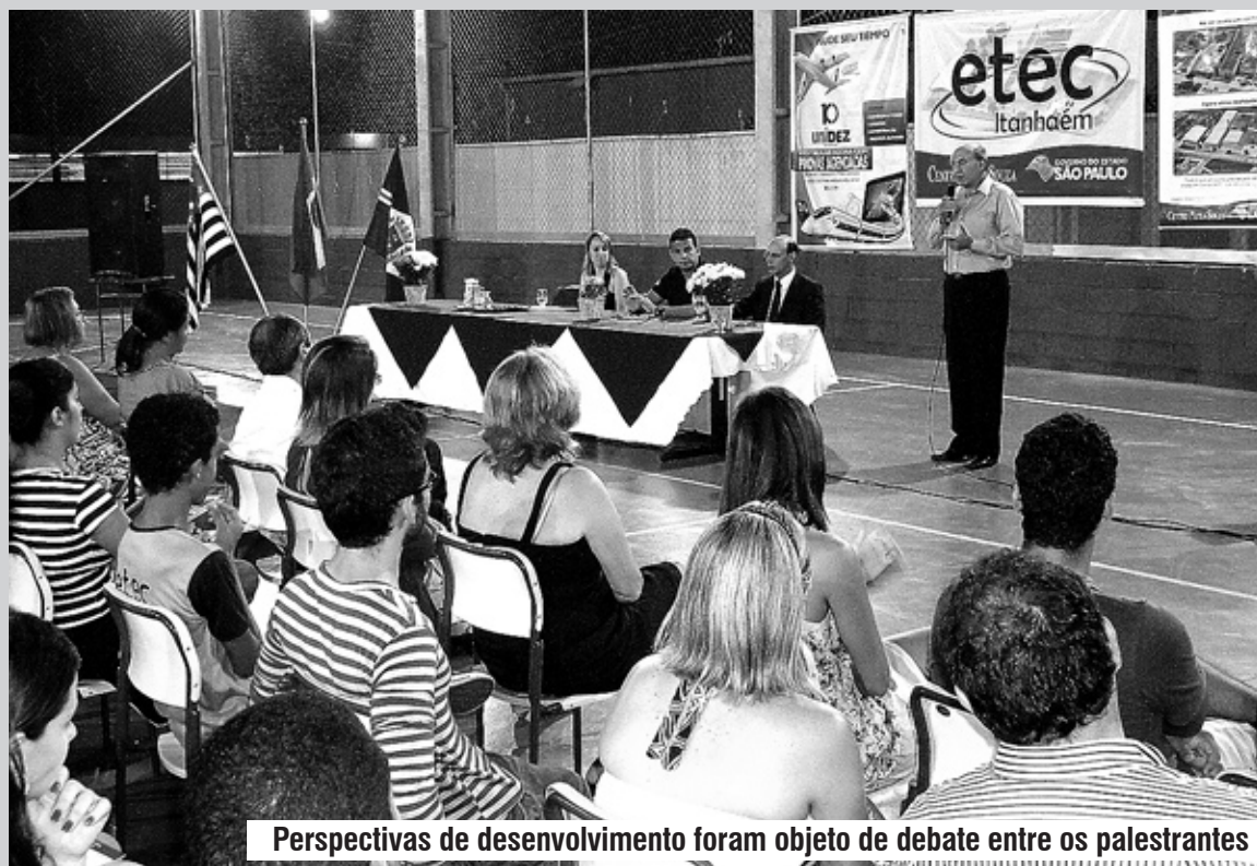
Perspectivas de desenvolvimento foram objeto de debate entre os palestrantes

realizar o Fórum surgiu porque é necessário incentivar os alunos a planejar o futuro profissional. “Decidimos fazer o evento devido às especulações sobre o pré-sal nesta região”, disse a diretora da ETEC.