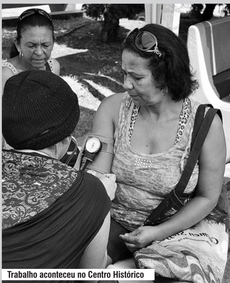
Trabalho aconteceu no Centro Histórico

■ Os municípios dividiram o serviço ficando cada um responsável por elaborar um projeto para melhorar e agilizar os serviços do SAMU