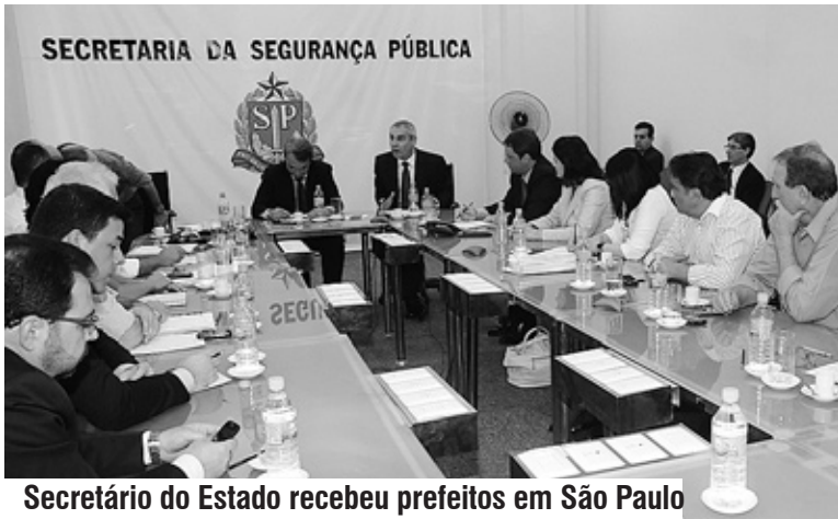
Secretário do Estado recebeu prefeitos em São Paulo