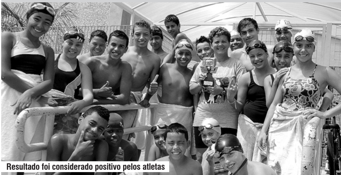
Resultado foi considerado positivo pelos atletas

SUPERAÇÃO ■ O grupo conquistou também um bom desempenho no revezamento de 20 minutos, o mais disputado da competição