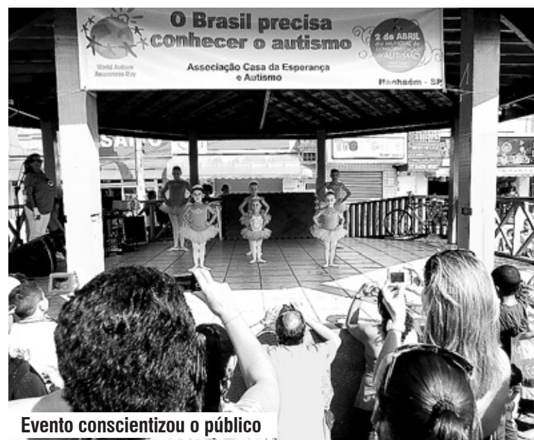
Evento conscientizou o público

O evento foi uma realização da Associação Casa da Esperança Autismo, com o apoio da Prefeitura de Itanhaém.