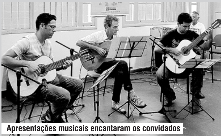
Apresentações musicais encantaram os convidados

CULTURA ■ O local passou por troca de forro, manutenção na parte elétrica e pintura