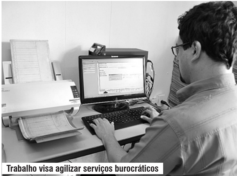
Trabalho visa agilizar serviços burocráticos

AGILIDADE ■ Os cadastros que eram feitos manualmente, estão arquivados no sistema, facilitando assim o contribuinte