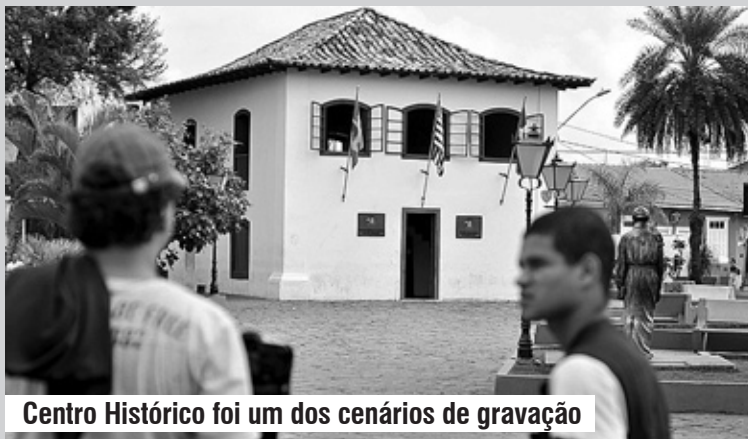
Centro Histórico foi um dos cenários de gravação

Entre os pontos turísticos visitados foram o Pocinho de Anchieta, Passarela de Anchieta, Cama do Anchieta, Painéis de Anchieta, Praia dos Pescadores, Monumento Mulheres de Areia, Centro Histórico, Museu Nossa Senhora da Conceição, Igreja Matriz de Sant'Anna,