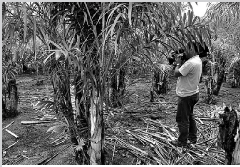
Plantio do palmito foi uma das atividades enfocadas na reportagem

DESTAQUE ■ A reportagem irá mostrar a área rural da Cidade, cuja a produção agrícola abastece o Município