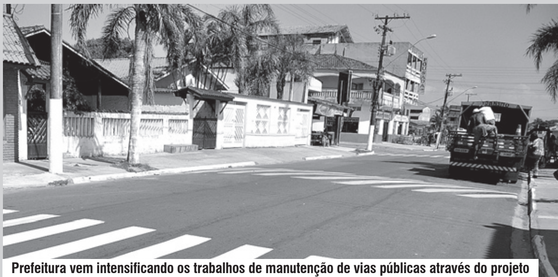
Prefeitura vem intensificando os trabalhos de manutenção de vias públicas através do projeto