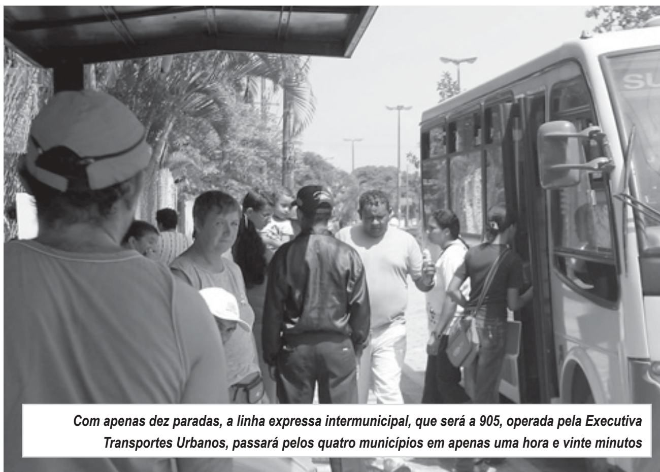
Com apenas dez paradas, a linha expressa intermunicipal, que será a 905, operada pela Executiva Transportes Urbanos, passará pelos quatro municípios em apenas uma hora e vinte minutos

Estrutura - Para viabilizar o sistema, serão construídas dez estações de embarque entre as quatro cidades, através de parceria entre a EMTU e as prefeituras. Todas contarão com proteção contra a chuva, bancos, lixeiras, bicicletários, rampas para portadores de deficiências físicas e placas de informações. Com custo estimado em aproximadamente R$ 90 mil, as obras estão previstas para iniciar na próxima semana.