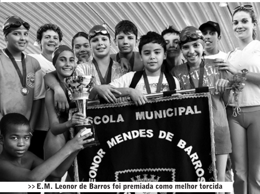
>> E.M. Leonor de Barros foi premiada como melhor torcida