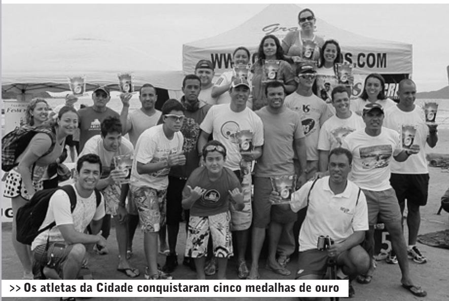
>> Os atletas da Cidade conquistaram cinco medalhas de ouro

ESPORTE >> Com cerca de 100 atletas na competição, os itanhaenses se sobressaíram aos demais participantes