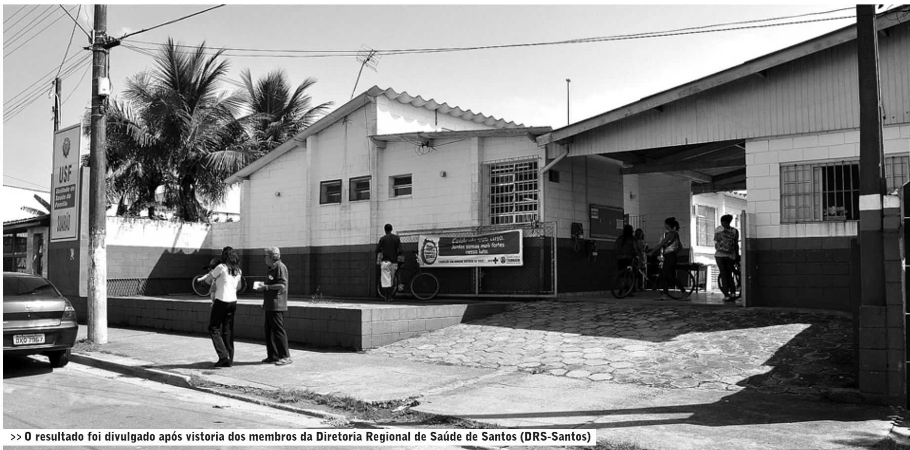
>> O resultado foi divulgado após vistoria dos membros da Diretoria Regional de Saúde de Santos (DRS-Santos)