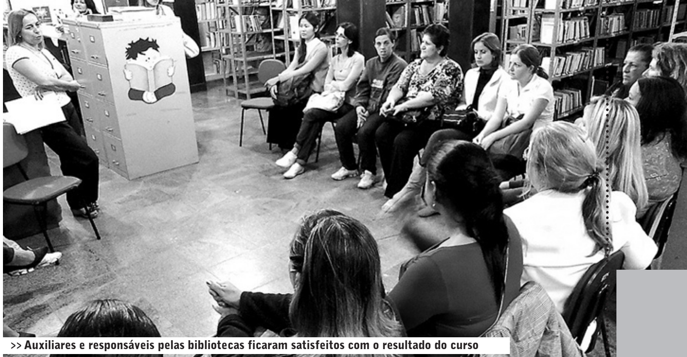
>> Auxiliares e responsáveis pelas bibliotecas ficaram satisfeitos com o resultado do curso

A previsão é que o empreendimento comece a ser erguido no mês de dezembro e seguirá os critérios de qualidade com o cumprimento dos padrões de acessibilidade e sustentabilidade conforme solicita a legislação. O projeto inclui ainda aquecimento solar e especificações para redução do consumo de água e energia.