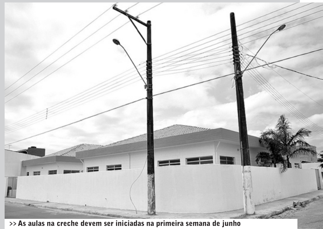
>> As aulas na creche devem ser iniciadas na primeira semana de junho

A obra é mais um resultado do investimento da Secretaria de Educação, Cultura e Esportes que está construindo mais unidades para atender a demanda escolar. Em abril, a Escola Municipal Lilian Aparecida Borges Prado, localizada na região do Savoy foi inaugurada pela Prefeitura.