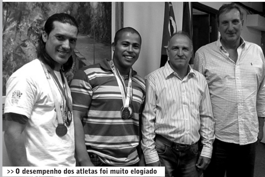
>> O desempenho dos atletas foi muito elogiado