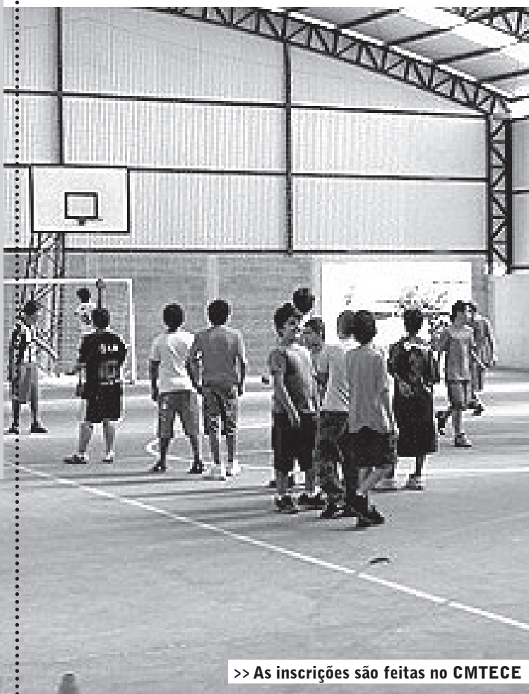
>> As inscrições são feitas no CMTECE