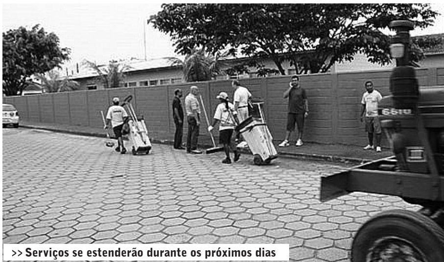
>> Serviços se estenderão durante os próximos dias

O Projeto Mutirão nos Bairros desenvolve mais uma etapa no Bairro Umuarama. Idealizada pelo prefeito João Carlos Forssell, a ação está sendo desenvolvida na região com o objetivo de solucionar os problemas mais urgentes apontados pela população.