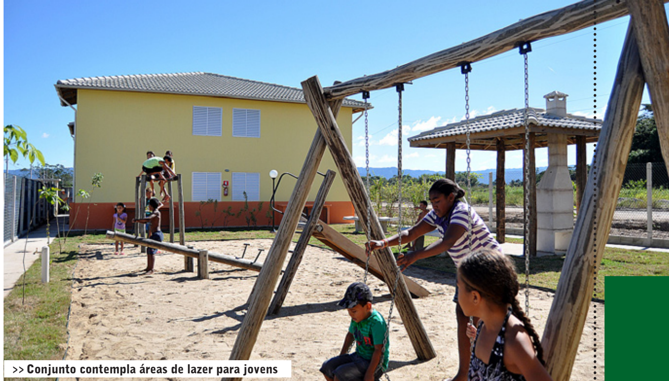
>> Conjunto contempla áreas de lazer para jovens