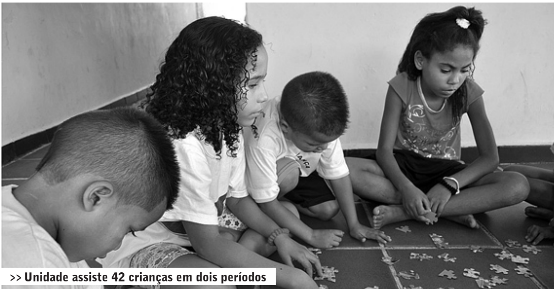
>> Unidade assiste 42 crianças em dois períodos

ATIVIDADE – São 42 crianças, divididas nos períodos da manhã e tarde, que quando não estão em horário escolar, passam o tempo desenvolvendo atividades educativas