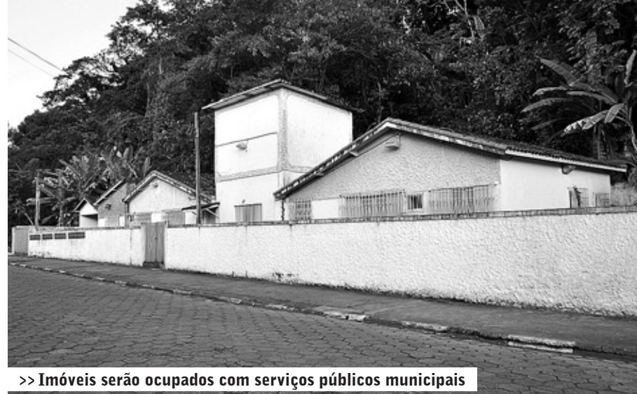
>> Imóveis serão ocupados com serviços públicos municipais

O mutirão de limpeza percorreu 13 regiões da Cidade em 2011. Para dar um impulso maior ao programa, a Prefeitura fez a aquisição de 15 equipamentos, entre caminhões, escavadeira, pás e moto niveladora. O maquinário, orçado em R$ 3 milhões, está sendo utilizado nas ruas durante a realização do projeto.