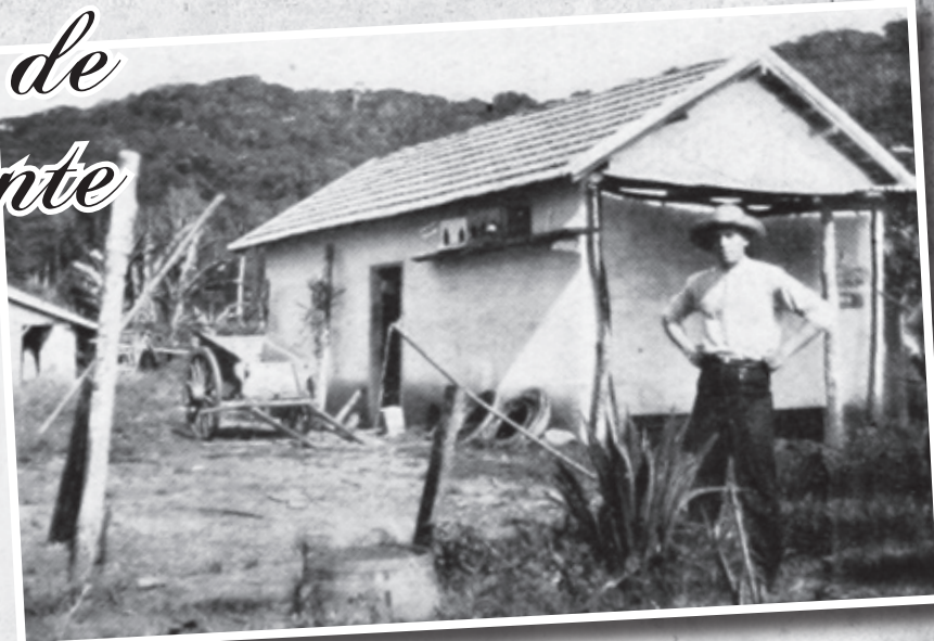
Imagem de uma colônia agrícola de Itanhaém com um depósito ao fundo, no início da década de 20. Foto extraída do livro "Itanhaem - Praia do Meio, Praia das Conchas e Costão de Paranambuque - Venda de terrenos em lotes", com imagens da década de 20.

SE VOCÊ POSSUI UMA IMAGEM ANTIGA E QUISER DIVULGÁ-LA NESSE ESPAÇO, PODE ENCAMINHAR A FOTO ATRAVÉS DO E-MAIL: COMUNICACAO@ITANHAEM.SP.GOV.BR .