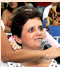
ADRIANA , melhorar atendimento na saúde