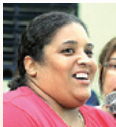
CARINA , vagas no Hospital