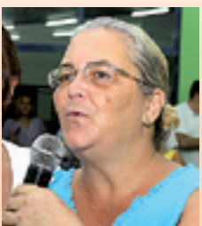
VERA , melhorias no conjunto habitacional e limpeza do lemanjá