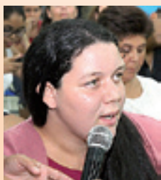
VITÓRIA , atendimento odontológico e vagas em creches