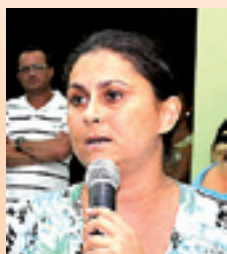
ROSE , Atendimento especializado na saúde