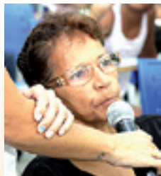
ROSELI , medicamentos e UBS no América