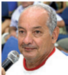
APARECIDO , funcionários na Regional