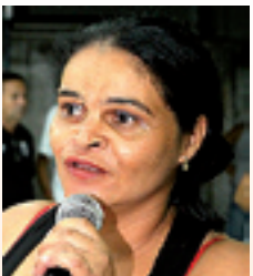
MARI , agradeceu as melhorias no bairro