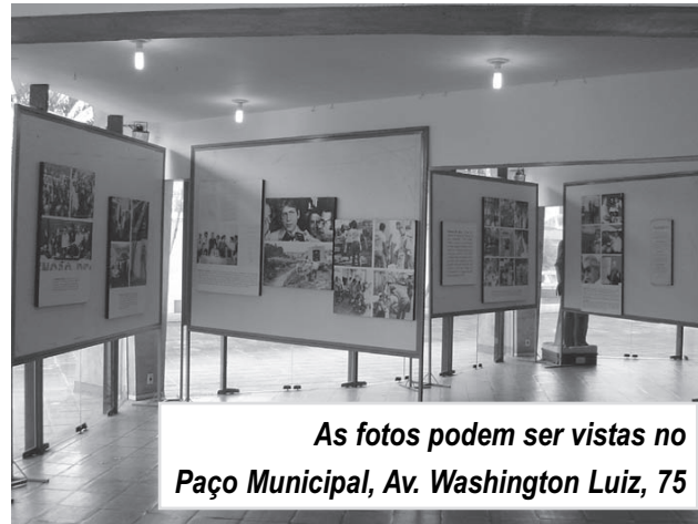
As fotos podem ser vistas no Paço Municipal, Av. Washington Luiz, 75

O Governo Municipal de Itanhaém, através da secretaria de Obras e Meio Ambiente, está realizando, aos apreciadores da arte e da política, a exposição "Mário Covas - A Ação Conforme a Pregação". Composta por 35 painéis, entre fotos e documentos, a mostra revela a trajetória política do ex-governador, desde a década de 1950, e pode ser visitada até o dia 3 de dezembro, no Paço Municipal, na Av. Washington Luiz, 75, no Centro, de segunda a sexta-feira, das 9 às 16 horas, e aos sábados das 9 às 13 horas.