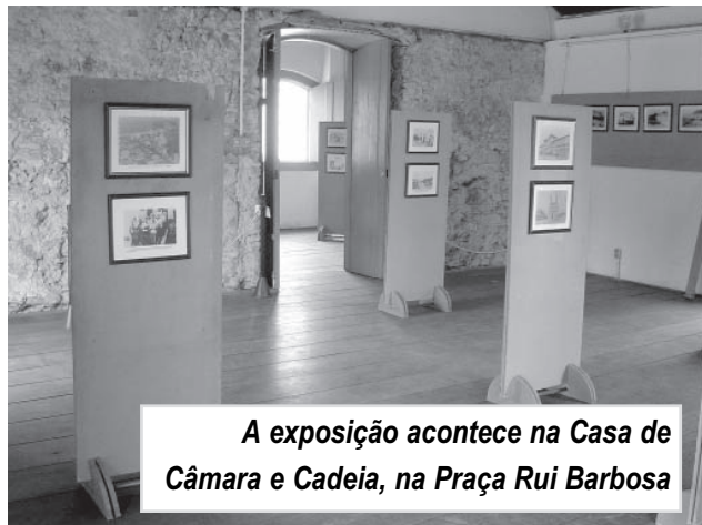
A exposição acontece na Casa de Câmara e Cadeia, na Praça Rui Barbosa

Quem quiser conhecer um pouco mais sobre a história de Itanhaém e das cidades que compõem a Região Metropolitana, não pode deixar de conferir a exposição de fotos de Valdemar Laure. O visitante verá os mais de 50 retratos, da Cidade e de pontos importantes da Região, como o Porto de Santos e a Ponte Pencil, no início do século. Para os interessados em visitar a exposição, que acontece até o dia 30 de novembro, a Casa de Câmara e Cadeia, funciona das 8 às 11 e das 13 às 18 horas, durante todos os dias.