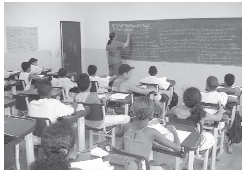
Os candidatos vão disputar uma das 145 vagas disponíveis para os cargos de professor de Ensino Fundamental

Neste caso os candidatos deverão especificar na ficha de inscrição, o tipo de deficiência de que é portador. E ainda até o dia 30 de novembro, enviar via sedex, por meio da Caixa Postal 61065-8, CEP 05001-970, identificando no envelope 'Concurso Público da Prefeitura Municipal de Itanhaém', os documentos constantes no edital publicado nesta edição.