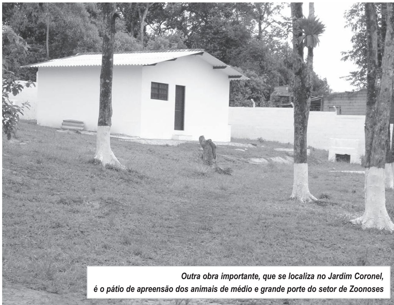
Outra obra importante, que se localiza no Jardim Coronel, é o pátio de apreensão dos animais de médio e grande porte do setor de Zoonoses

Outra obra importante, que se localiza próxima da Unidade do Coronel, é o pátio de apreensão dos animais de médio e grande porte do setor de Zoonoses. No local, os animais como suínos, cabras, jumentos, cavalos, vacas, entre outros, que estiverem soltos na área urbana do Município, serão capturados e permanecerão no pátio por 10 dias, aguardando o proprietário. Caso não haja manifestação do dono, o animal poderá ir a leilão ou ser doado.