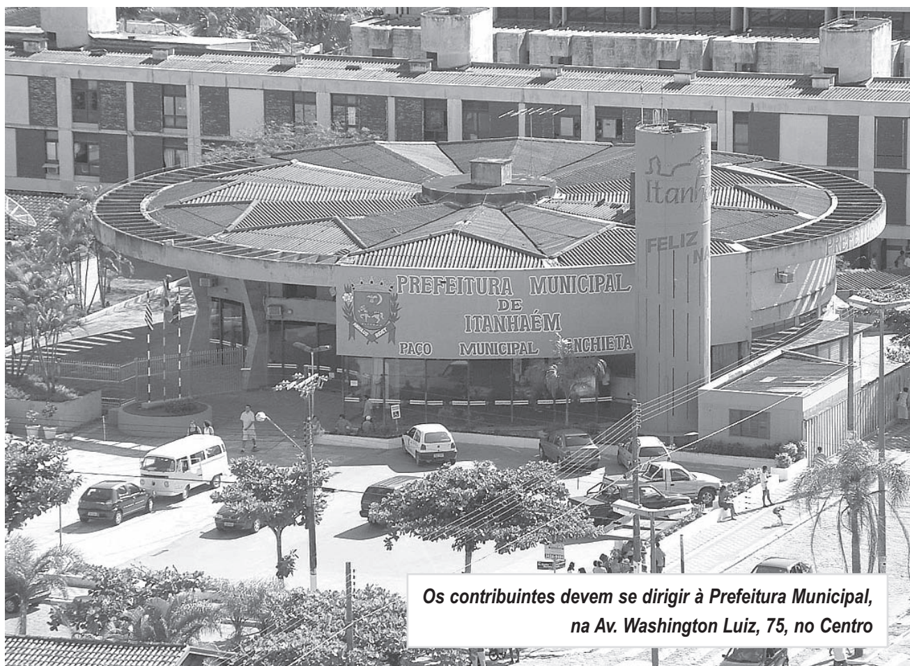
Os contribuintes devem se dirigir à Prefeitura Municipal, na Av. Washington Luiz, 75, no Centro

DOCUMENTAÇÃO - Para quitar o débito ou fazer o parcelamento é necessário comparecer ao Centro de Atendimento da Prefeitura Municipal, na Avenida Washington Luiz, 75, no Centro, munido com comprovante de propriedade, como contrato de compra e venda ou escritura do imóvel, além do RG e CPF. Mais informações na secretaria de Assuntos Fiscais pelo telefone 3421 1600.