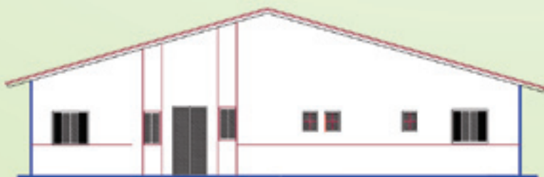
Maquete das novas Unidades Básicas de Saúde

A Cidade conta ainda com uma Unidade Regional do Serviço de Atendimento Médico de Urgência (SAMU). E inaugurou em abril deste ano a Unidade de Pronto Atendimento (UPA) do Jardim Sabaúna, que conta com um imóvel amplo e moderno para o atendimento do setor emergencial, localizado em um ponto estratégico, próximo da Rodovia Padre Manoel da Nóbrega.