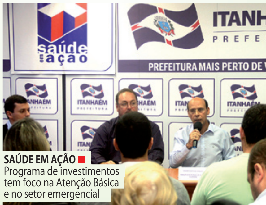
SAÚDE EM AÇÃO ■ Programa de investimentos tem foco na Atenção Básica e no setor emergencial

foram reformadas (Savoy, Jardim Coronel, Oásis, Suarão e Gaivotá). Além disso, o Centro de Especialidades Médicas do Belas Artes foi transferido para um imóvel mais amplo e melhor estruturado para os funcionários e para os pacientes. O quadro de médicos foi reforçado com a contratação de novos profissionais durante o ano.