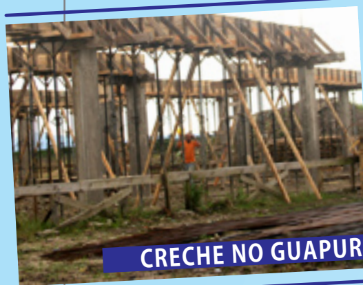
CRECHE NO GUAPURÁ