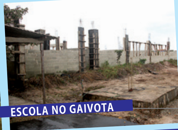
ESCOLA NO GAIVOTA