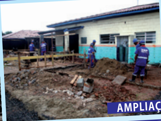
AMPLIAÇÃO DE ESCOLAS