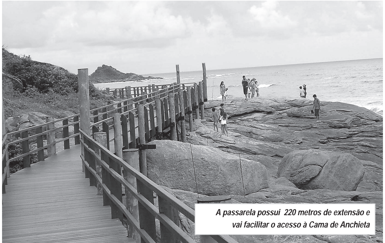
A passarela possui 220 metros de extensão e vai facilitar o acesso à Cama de Anchieta

"Eis os versos que outrora, ó Mãe Santíssima, te prometi em voto, enquanto entre tamoios conjurados, pobre refém, tratava as suspiradas pazes, tua graça me acolheu em teu materno manto e teu poder me protege intactos o corpo e alma".