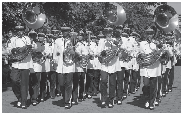
A Banda Marcial conta com inúmeras conquistas

Exemplos disso são os títulos de hexacampeã regional do Concurso A Tribuna de Santos (1975, 1976, 1977, 1978, 1981 e 1982), tricampeã nacional de Bandas e Fanfarras (1994, 1999 e 2000), campeã geral do 1º Concurso Regional de Bandas e Fanfarras da cidade de Cubatão (2003) e campeã geral da Final do 1º Circuito de Bandas e Fanfarras do Litoral Paulista e Vale do Ribeira (2004).