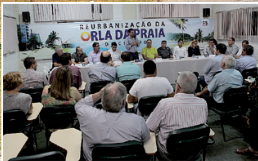
A assinatura da ordem de serviço da obra aconteceu na sede da ACAI, na noite da última sexta-feira (17)

O PAISAGISMO também terá uma transformação positiva com o plantio de 50 espécies conhecidas como Algodoeiro da Praia ( Hibiscus tiliaceus ), um tipo de árvore própria para esse local.