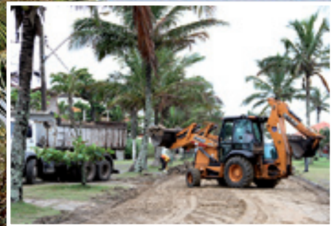
Máquinas e caminhões já trabalham na via, na altura da Rua Cunha Moreira

Está prevista a colocação de pavimentação com LAJOTAS INTERTRAVADAS VERMELHAS , similares as que foram implantadas nas ruas Cunha Moreira e Antonio Olívio de Araújo. Serão eliminados os atuais sarjetões e implantado um novo sistema de drenagem, melhorando substancialmente as condições de escoamento das águas pluviais.