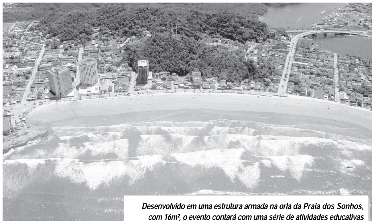
Desenvolvido em uma estrutura armada na orla da Praia dos Sonhos, com 16m², o evento contará com uma série de atividades educativas

A secretaria municipal de Obras e Meio Ambiente inicia na quarta-feira (4) o lançamento do projeto Onda Limpa, elaborado em parceria com a Entidade Ecológica dos Surfistas de Itanhaém (Ecosurfi), com intuito de preservar o patrimônio natural da Cidade e região. O trabalho será realizado na Praia dos Sonhos durante toda a temporada.