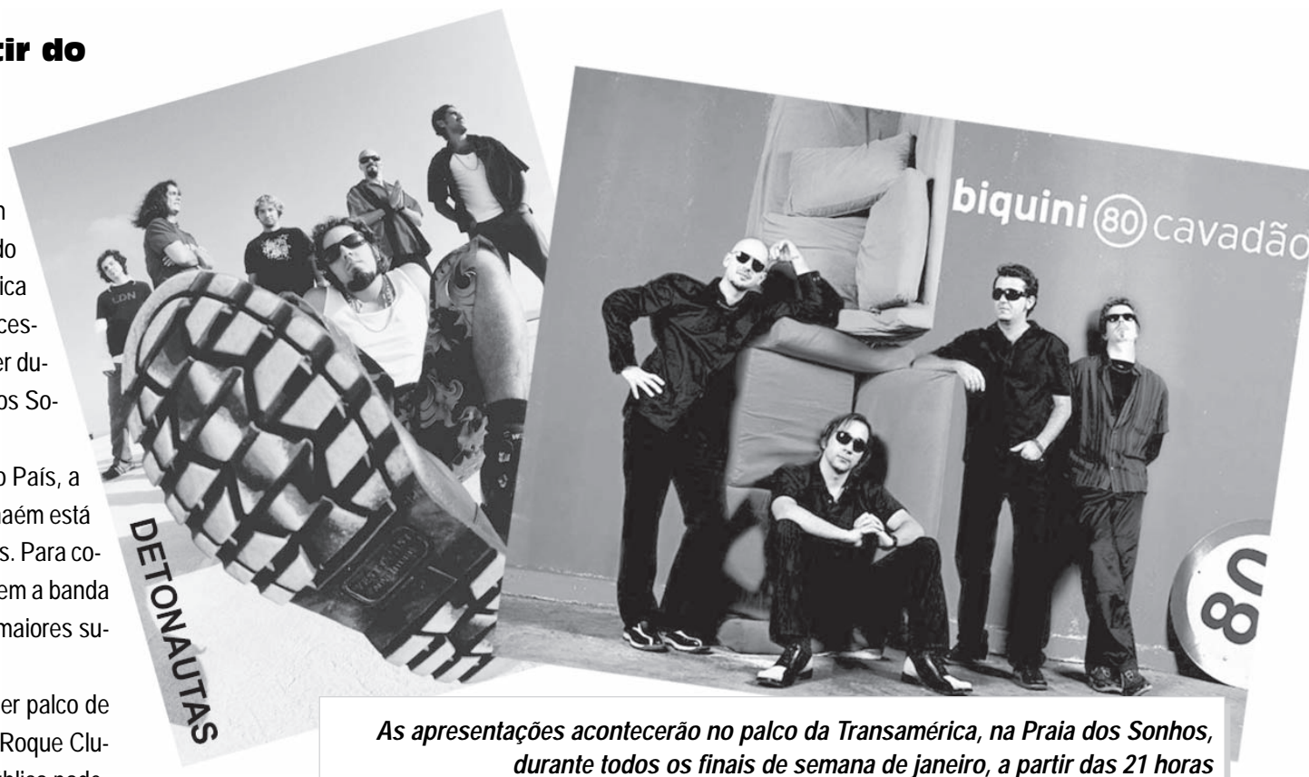
As apresentações acontecerão no palco da Transamérica, na Praia dos Sonhos, durante todos os finais de semana de janeiro, a partir das 21 horas

De acordo com a secretaria municipal de Turismo a programação foi montada para atender a todo tipo de faixa etária. Todos os shows serão apresentações de artistas consagrados, pois durante a escolha das bandas, houve o cuidado de selecionar bandas que atendam ao gosto de todas as gerações. Os shows serão realizados sempre a partir das 21 horas, na Arena Transamérica, localizada na Praia dos Sonhos.