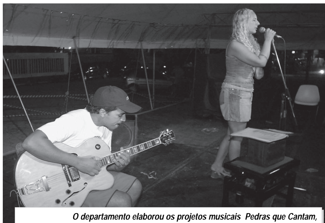
O departamento elaborou os projetos musicais Pedras que Cantam, Vem Cantar Comigo e Itinerart que acontecem na Praça Narciso de Andrade

Já o segundo, trata-se de uma proposta descontraída e inusitada, realizada na Praça Carlos Botelho, no Centro, onde um músico, acompanhado de seu violão, convida o público a cantar a seu lado, com toda a estrutura e aparato de um pequeno show acústico. Como num karaokê, o participante tem cerca de 100 opções