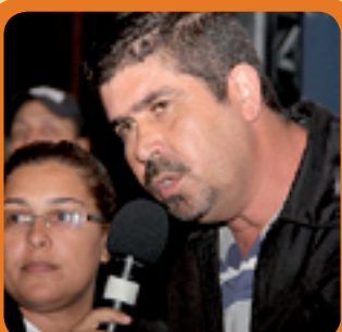
7. ERMANDO DESENVOLVIMENTO ECONÔMICO