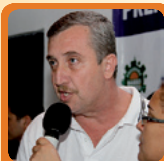
1. PANTAROTI SEGURANÇA