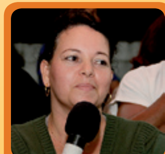
9. NEIDE COMÉRCIO