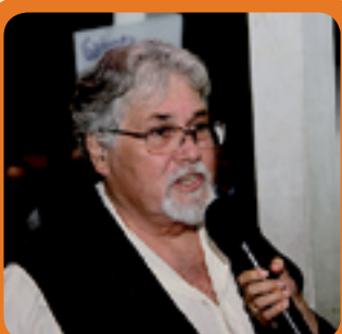
6. ANTÔNIO INFRAESTRUTURA