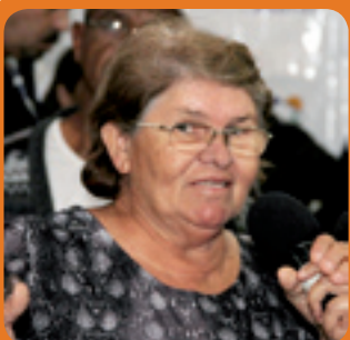
5. ANARINA SERVIÇO BANCÁRIO