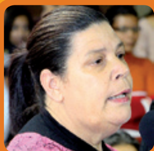
4. SUELI EDUCAÇÃO