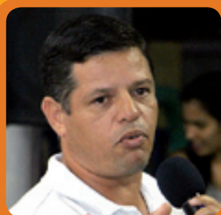
3. ROMILDO ESPORTES