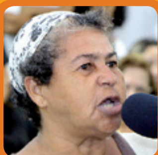
6. VERA SAÚDE

A construção de uma creche, a instalação de academia ao ar livre e pavimentação de ruas foram alguns dos anúncios apresentados à população durante audiência popular do Programa Bairro a Bairro realizada na última quarta-feira (5), na Creche Municipal Tia Pombinha, na Região do Sion. Além de investimentos em educação e infraestrutura, a Prefeitura fortalece o diálogo por meio de propostas de melhorias sugeridas por moradores da Cidade.