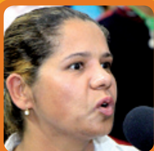
1. CLEUSA SAÚDE