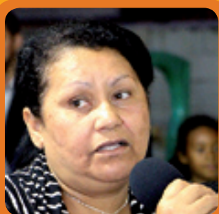
2. JUVANETE LIMPEZA DE TERRENO