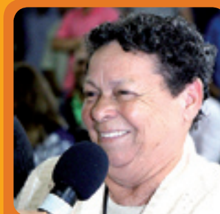
8. NEIDE SEGURANÇA