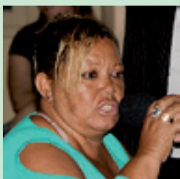
8. SIRLEI ADMINISTRAÇÃO MUNICIPAL