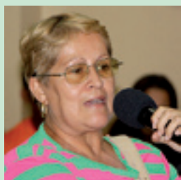
6. EDNA MANUTENÇÃO DE VIAS