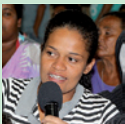
3. MARIANE PAVIMENTAÇÃO