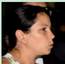
1. ROGÉRIA MANUTENÇÃO DE VIAS