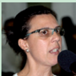
2. CIBELE VIGILÂNCIA SANITÁRIA