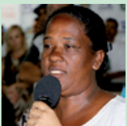
5. ROSA INFRAESTRUTURA