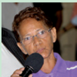
7. ROSE SAÚDE