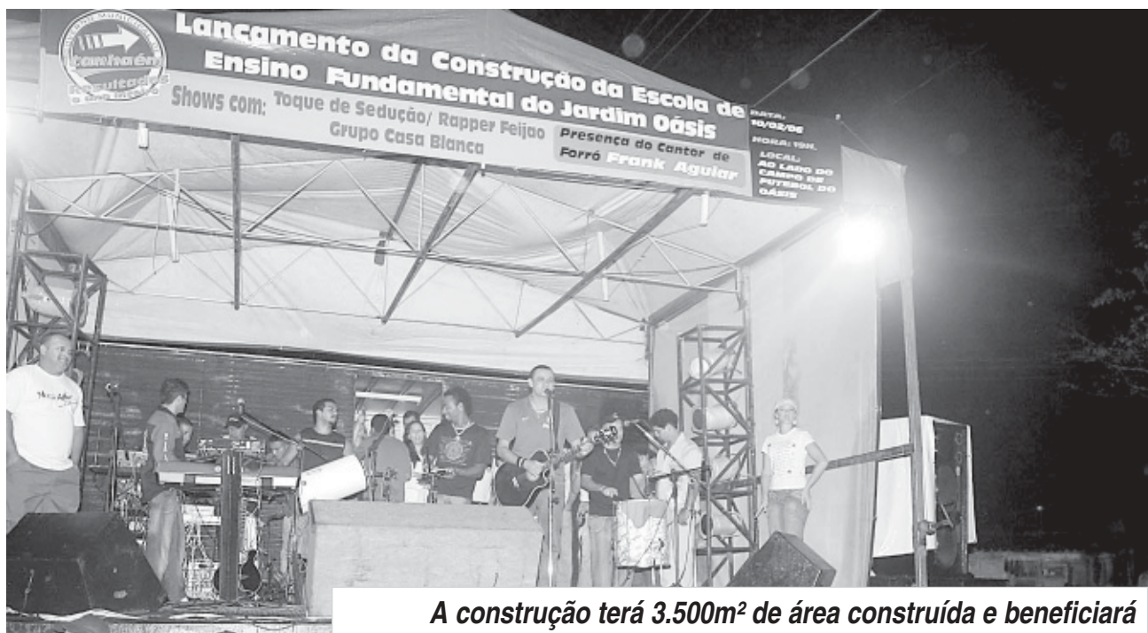
A construção terá 3.500m 2 de área construída e beneficiará aproximadamente 2 mil alunos, de 1 a a 8 a séries, do Jardim Oásis

Praça - A obra deverá ser concluída até o início do ano letivo de 2007. Além da infra-estrutura moderna e incomparável na Cidade, o empreendimento conta ainda com a construção de uma praça, que deverá ter palco fixo, playground, espelho d'água com fonte, e também um espaço coberto para múltiplas funções.