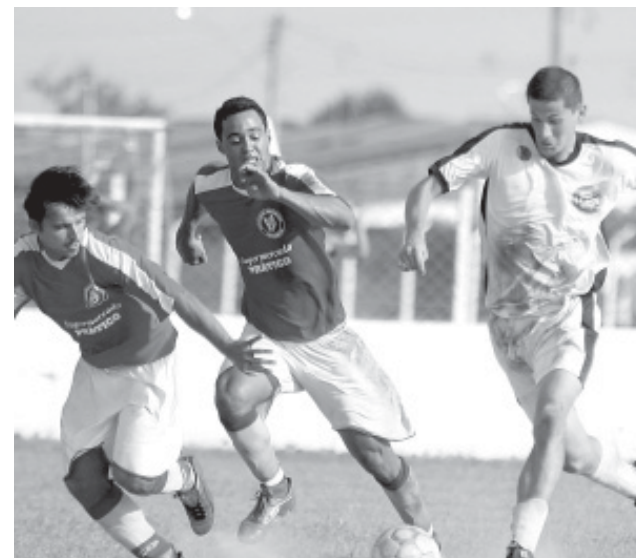
Disputam as duas vagas finais, os times XV do Suarão e São José, Iemanjá e Tropical

Rodada - O último final de semana (18 e 19) foi agitado com os jogos de ida da semifinal da LIFA. Na partida realizada no campo do Tropical, o time da casa venceu o Iemanjá,