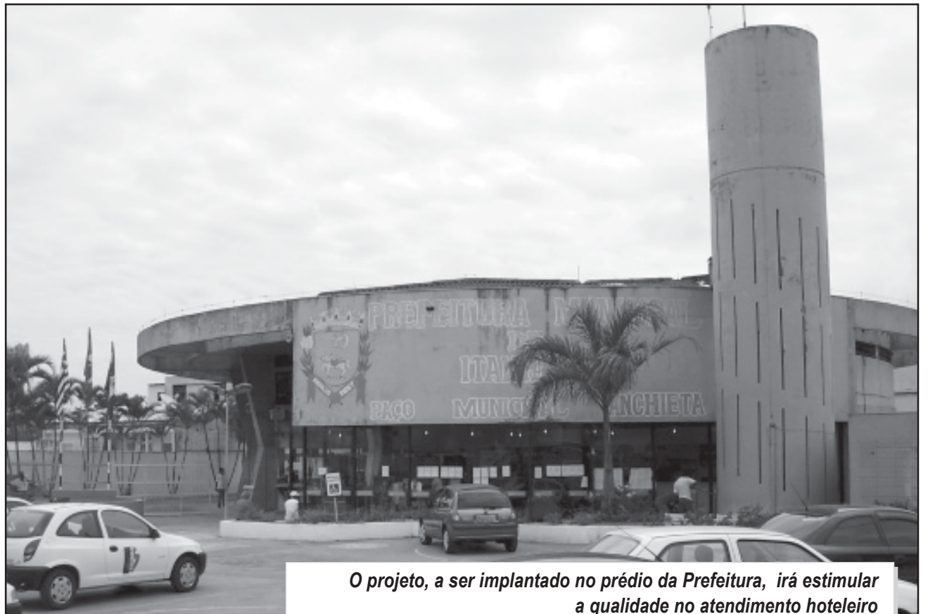
O projeto, a ser implantado no prédio da Prefeitura, irá estimular a qualidade no atendimento hoteleiro

Ainda conforme o projeto, os alunos poderão aprender, gratuitamente, sobre todos os setores que envolvem um estabelecimento do gênero, com atuação desde o setor de limpeza e alimentação até ocupação em cargos de gerência.