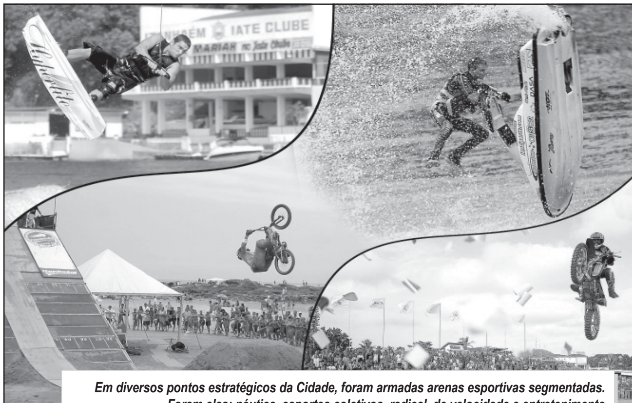
Em diversos pontos estratégicos da Cidade, foram armadas arenas esportivas segmentadas. Foram elas: náutica, esportes coletivos, radical, de velocidade e entretenimento