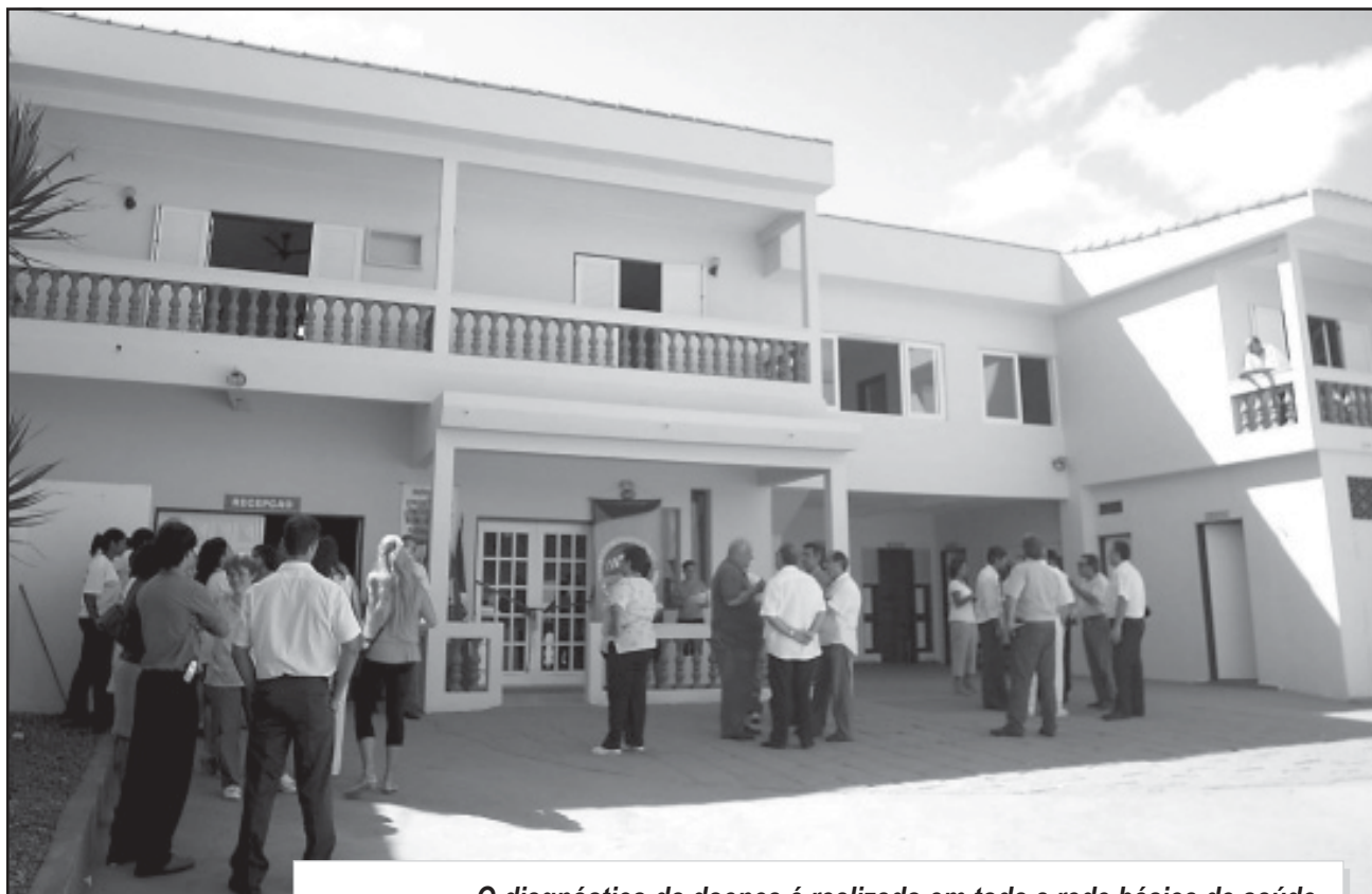
O diagnóstico da doença é realizado em toda a rede básica de saúde, como por exemplo na unidade do Belas Artes

A partir de segunda-feira (13) - às 13h30