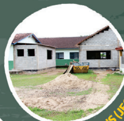
IGNÊZ MARTINS (JEQUITIBÁ)