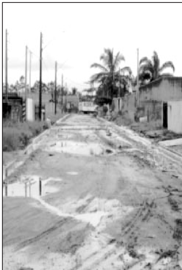
O empreendimento é resultado da parceria entre a Prefeitura, a Nossa Caixa e os municípios

E, para participar, só é necessário que os moradores de uma determinada rua se reúnam e escolham um represen-