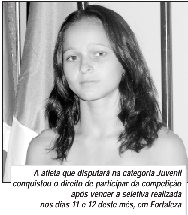
A atleta que disputará na categoria Juvenil conquistou o direito de participar da competição após vencer a seletiva realizada nos dias 11 e 12 deste mês, em Fortaleza

A delegação brasileira será composta por 32 atletas, que se dividem em 16 categorias, além da comissão técnica. Eles embarcam para a Colômbia, no dia 17 de abril e até lá, a atleta da Academia Municipal de Judô Cho Do Kan, que é a única competidora brasileira na sua categoria, irá intensificar os treinamentos, passando de duas para quatro vezes por semana, e ainda, com treinamento especial aos domingos.