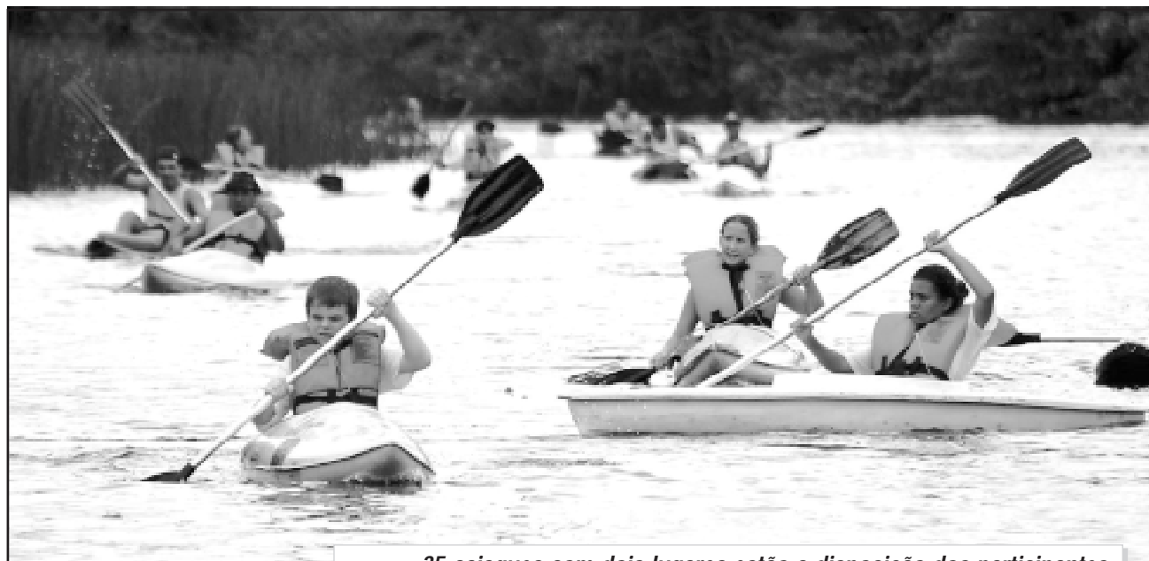
35 caiaques com dois lugares estão a disposição dos participantes

O Circuito da Expedição Chauás é uma verdadeira prova de resistência. Considerado uma das competições de maior nível de dificuldade entre os corredores profissionais, os 110km que os quartetos mistos, sendo três homens e uma mulher enfrentarão serão divididos em 28km de canoagem, 45km de mountain bike e 37km de trekking. A prova terá início a partir das 14 horas, também na Boca da Barra. Após os desafios os três primeiros de cada circuito receberão troféus e brindes dos patrocinadores.