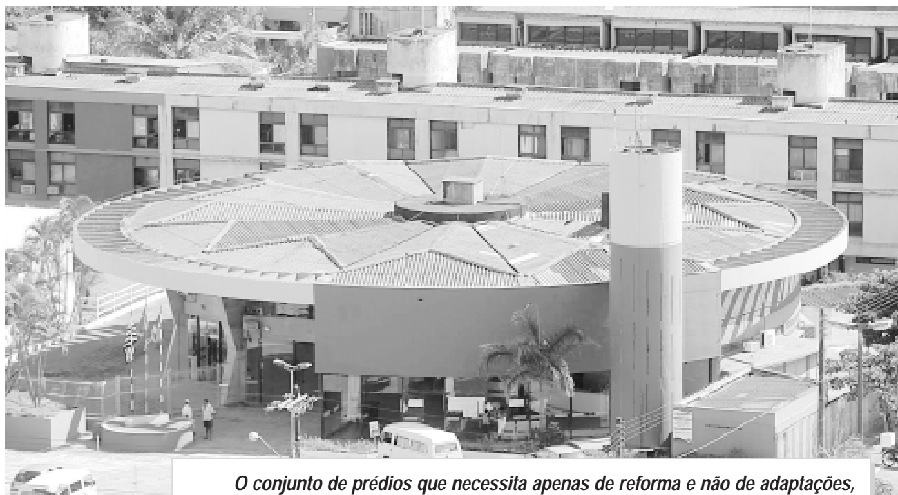
O conjunto de prédios que necessita apenas de reforma e não de adaptações, está localizado no Centro de Itanhaém, a cerca de 50 metros da praia

O hotel-escola irá proporcionar aos alunos a chance de ganhar experiência e de fazer carreira no ramo. Outro fator importante é a necessidade de mão-de-obra qualificada no setor hoteleiro que a Região exige. Situado no litoral sul do Estado, onde todas as cidades da vizinhança são estâncias balneárias que baseiam sua economia principalmente no setor de Turismo, este será um projeto que deverá contribuir, em geral, para desenvolvimento.