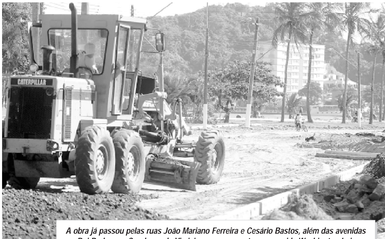
A obra já passou pelas ruas João Mariano Ferreira e Cesário Bastos, além das avenidas Rui Barbosa e Condessa de Vimieiros, e se encontra na avenida Washington Luiz

Serão beneficiados os projetos correspondentes a implantação do Roteiro do Pescador, que contará com R$ 438.427,09, o módulo III da Urbanização da Orla das praias do Cibratel e do Gaivota, onde a verba aplicada será de R$ 476.731,16, ambos referente ao ano de 2003, e também os recursos de 2005 no total de R$ 2.267.955,95 a serem investidos na complementação, ou seja, módulo IV da urbanização da Orla das praias do Cibratel e do Gaivota.