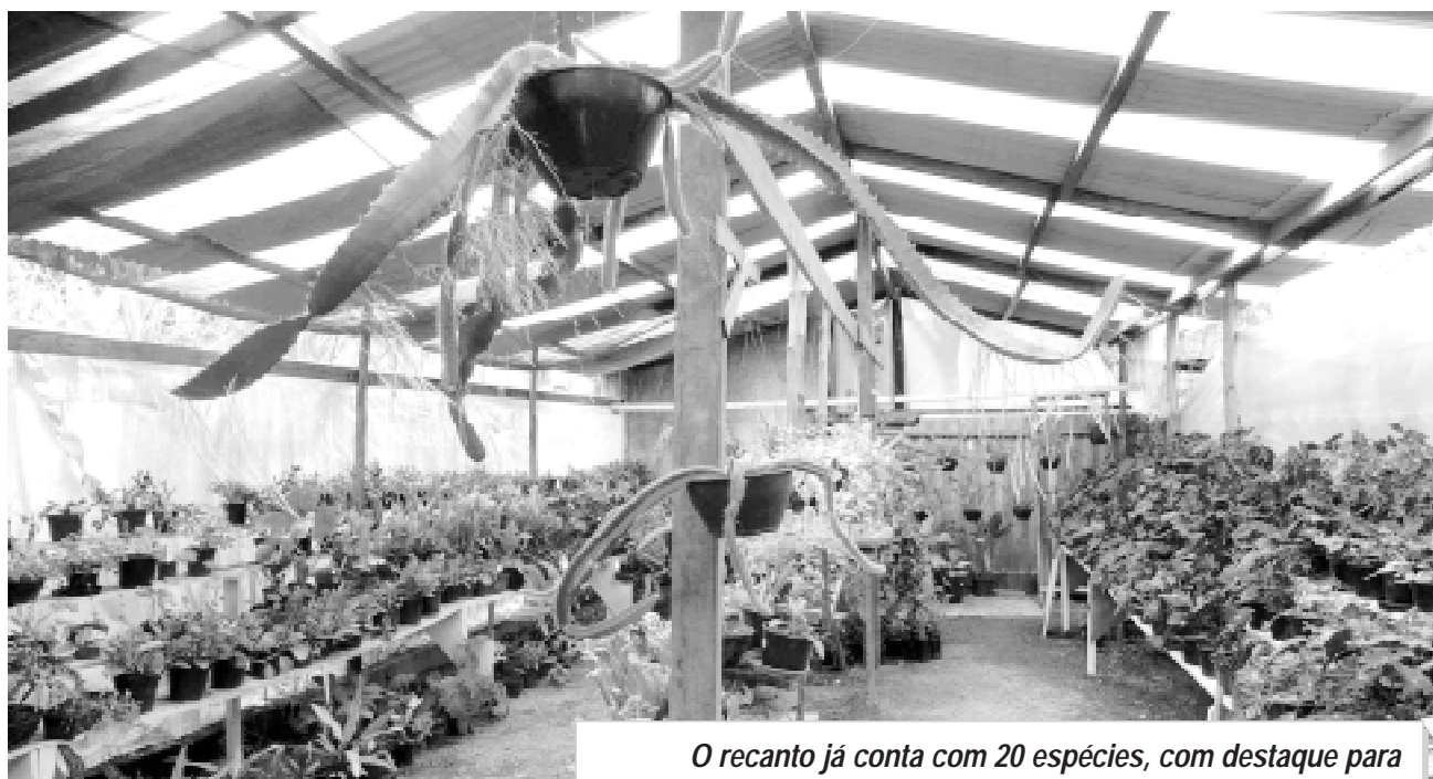
O recanto já conta com 20 espécies, com destaque para o cedro, jequitibá, jatobá e os ipês roxo e amarelo