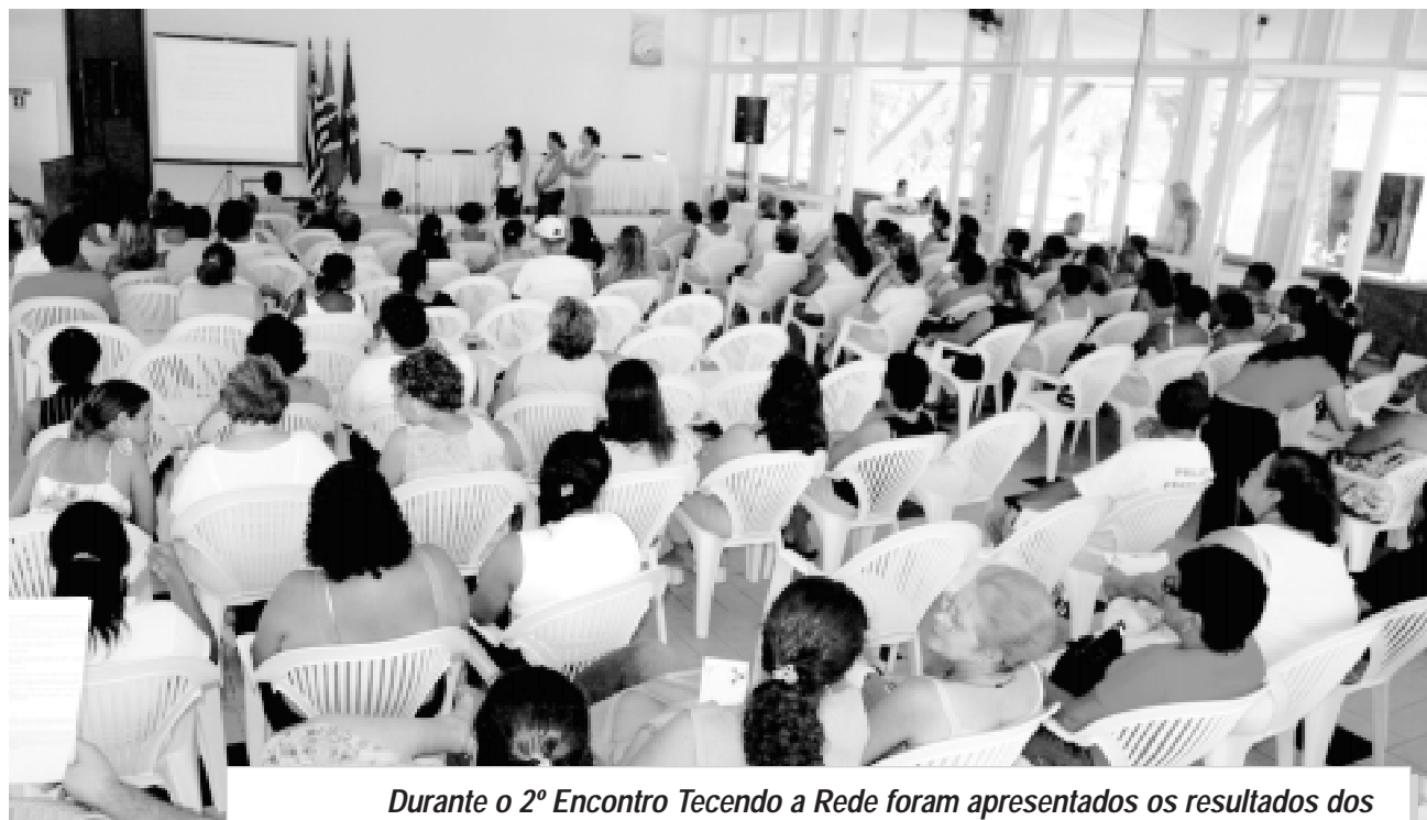
Durante o 2º Encontro Tecendo a Rede foram apresentados os resultados dos trabalhos realizados e levantadas sugestões sobre ações a serem tomadas

Além do troféu, o encontro que contou com o patrocínio da Ricard Cicle, Eletromóveis, Salomão Veículos, Churrascaria Solimar, NC Jóias e Faculdades Itanhaém, promoveu sorteio de brindes e premiou três funcionários envolvidos no diagnóstico com uma bicicleta.