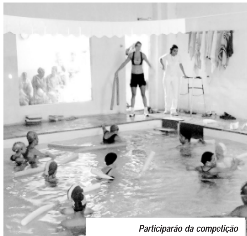
Participarão da competição 20 atletas do Projeto Lugar ao Sol

Os treinos de natação estão sendo desenvolvidos na Academia Adrenalina, onde é realizado um trabalho voltado a reabilitação, e no Satélite Esporte Clube, que visa o treinamento com os atletas que representam o projeto e o Município em competições. Além das atividades esportivas está sendo realizado um trabalho multidisciplinar nas turmas que possuem a paralisia cerebral.