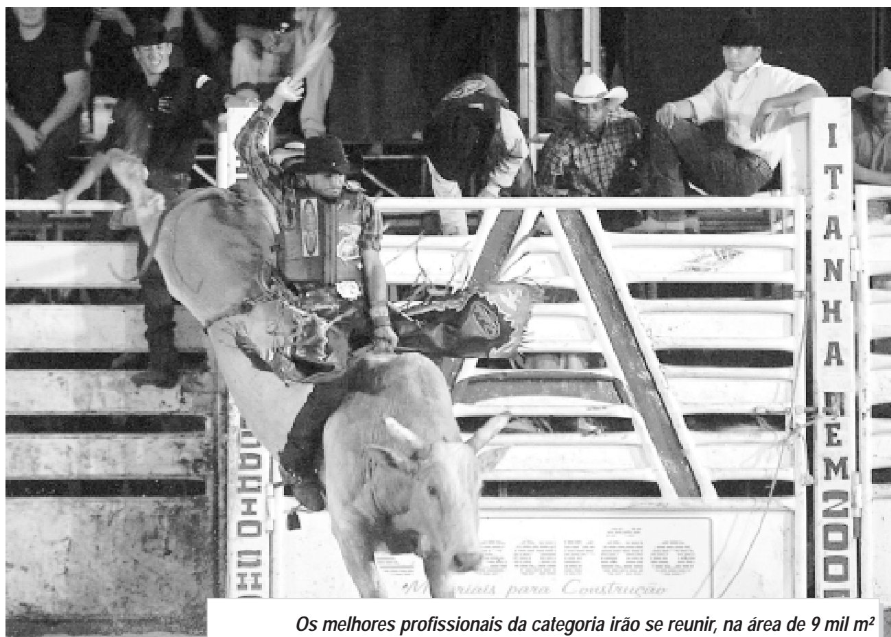
Os melhores profissionais da categoria irão se reunir, na área de 9 mil m 2 reservadas às disputas, em busca da classificação dos torneios

Consideradas os melhores campeonatos de montaria do País e do Mundo, a CBRU e a PBR irão levantar a multidão com as disputas entre os melhores profissionais da categoria