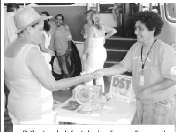
O Centro de Infectologia oferece diariamente serviços de orientação sobre DST/AIDS

As vigilâncias Sanitária e Epidemiológica e o Combate a Dengue estão atendendo na Praça 1º de Maio. Já o Centro de Infectologia foi transferido para a Rua Expedicionário Pointena