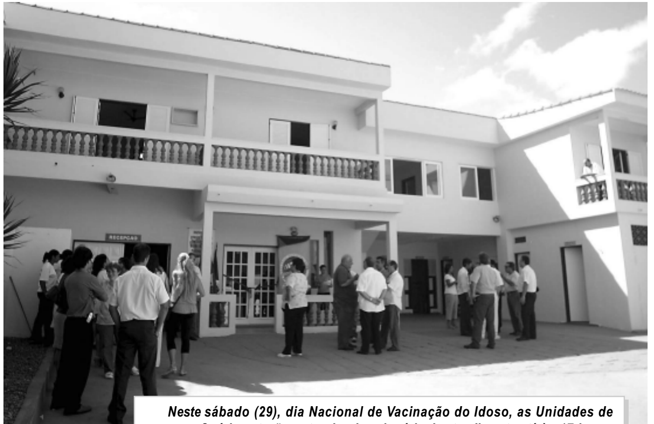
Neste sábado (29), dia Nacional de Vacinação do Idoso, as Unidades de Saúde estarão estendendo o horário de atendimento até às 17 horas

Para agendar a visita dos profissionais da Saúde, é preciso ligar para 3426-5105, 3426-6706 ou na Unidade de Saúde de mais próxima de sua casa. Confira abaixo a relação dos postos de vacinação: