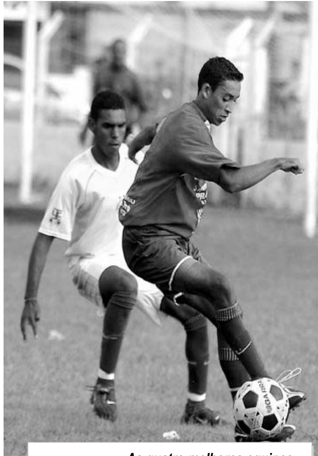
As quatro melhores equipes subirão para a 1ª Divisão da LIFA

De acordo com o regulamento os dezesseis clubes serão divididos em quatro grupos, com quatro equipes cada. Os times de cada chave jogarão entre si no sistema de turno e retorno, classificando-se as duas melhores equipes de cada grupo para as quartas-de-final. A regra ainda prevê o rebaixamento de duas equipes com as piores campanhas para a 3ª Divisão. O presidente da LIFA, Theodorico Coutinho, informou que a 1ª divisão promete muitas surpresas. "Este ano teremos um campeonato mais competitivo, o melhor dos últimos tempos. Serão 14 equipes que disputarão o título de melhor equipe da Cidade".