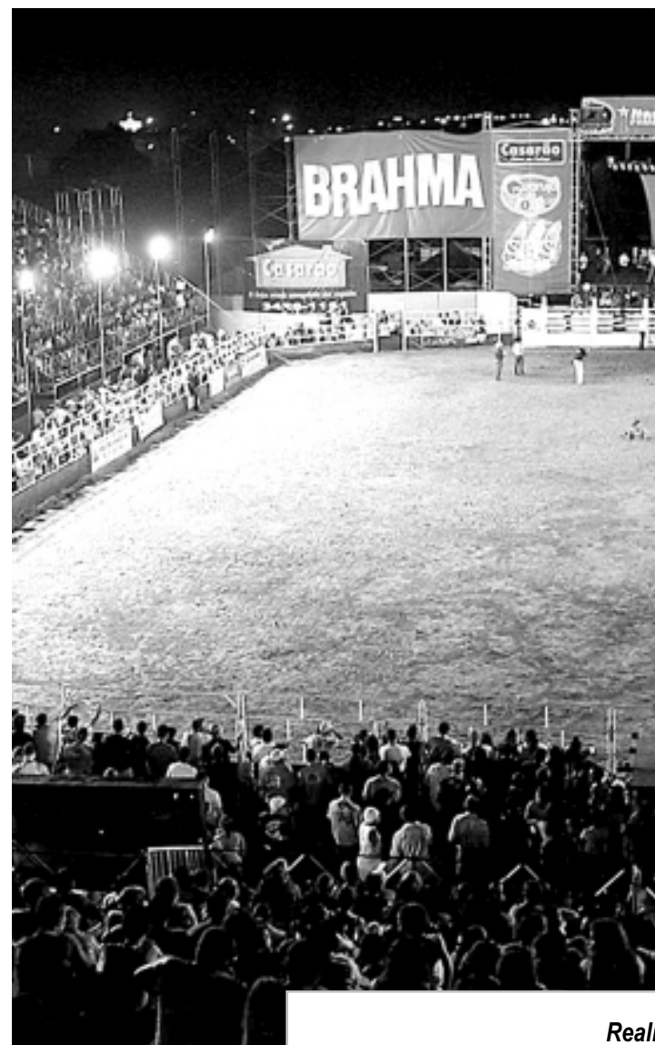
Realizado no Jardim Cibratel,

A Polícia Rodoviária, além da fiscalização na rodovia Padre Manoel da Nóbrega, com o apoio da equipe do Departamento de Estradas e Rodagem (DER) está sinalizando a rodovia com cavaletes e cones e, em caso de algum imprevisto, terá um guincho à disposição para que o trânsito possa fluir normalmente.