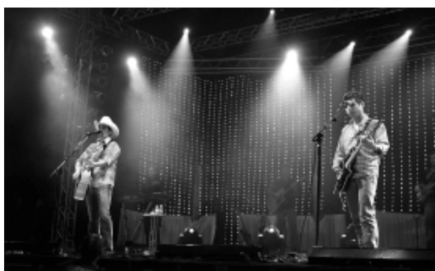
Edson & Hudson lotou a arena

izado numa área de 36 mil m², na Vila Rivera, no trevo do o 2º Itanhaém Rodeo Festival acontece até domingo (30)