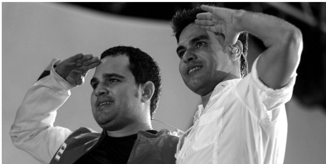
Zezé di Camargo & Luciano abriram o 2º Itanhaém Rodeo Festival