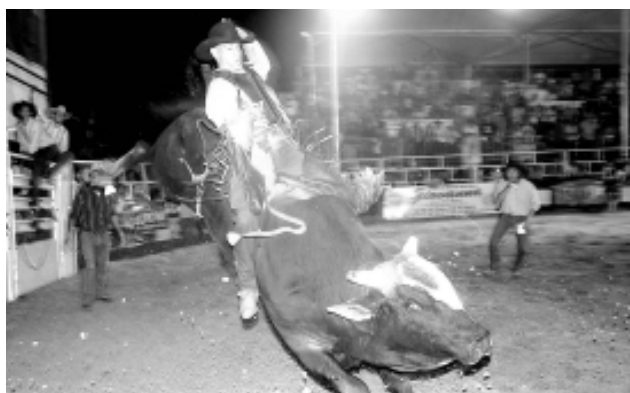
PBR trouxe os melhores peões do País