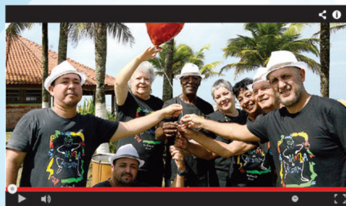
SAMBA ■ Samba da Pedra

■ O projeto tem como principal objetivo divulgar e resgatar a identidade de Itanhaém