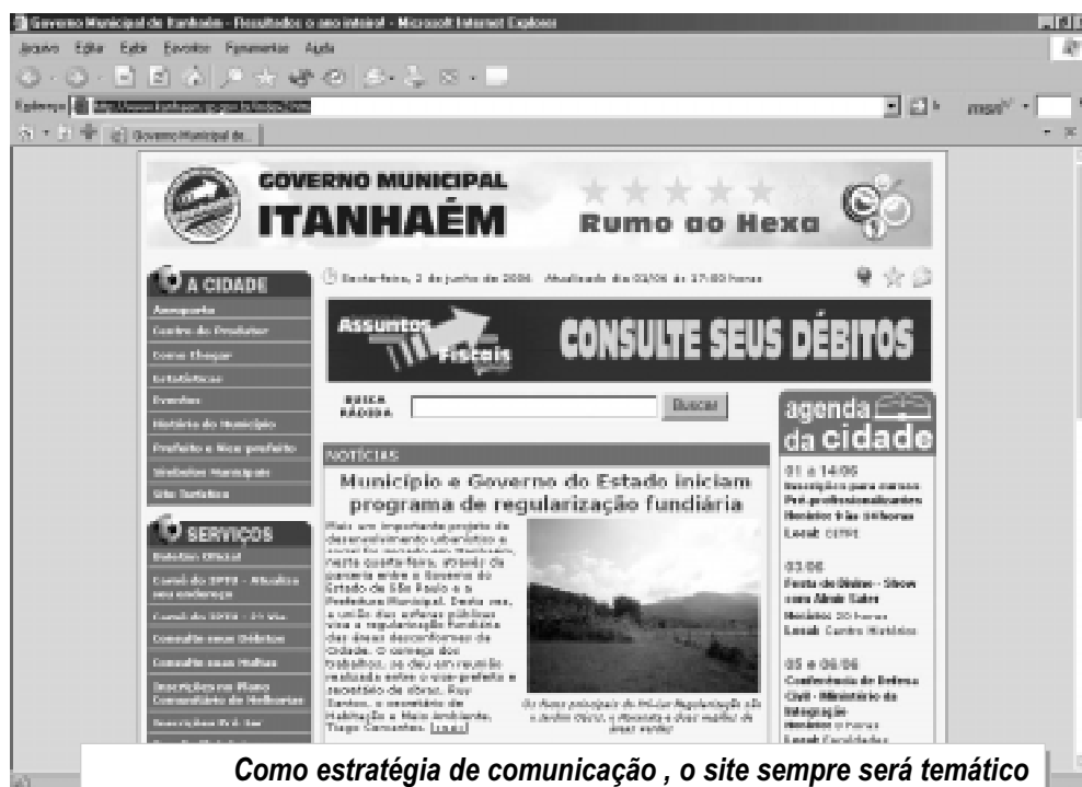
Como estratégia de comunicação, o site sempre será temático abordando grandes acontecimentos ou eventos da Cidade

Ainda de acordo com a secretaria esta é uma estratégia de comunicação que será implantada em datas comemorativas. "Em razão de sempre buscar inovações, a partir desta Copa, o site se tornará temático com os grandes acontecimentos em que o País estiver envolvido ou em eventos a serem reali-