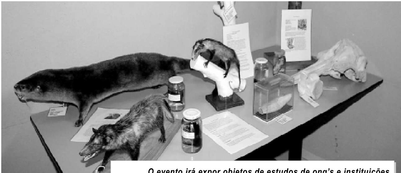
O evento irá expor objetos de estudos de ong's e instituições

Sucesso em 2005, a Exposição Ambiental de Itanhaém, realizada pelo departamento de Meio Ambiente, em parceria com a secretaria de Educação, Cultura e Esportes e organizações não governamentais, promete ser ainda melhor em 2006. Realizado até 10 de junho, no Centro de Pesquisas do Estuário do Rio Itanhaém, o evento visa marcar as comemorações do Dia Mundial do Meio Ambiente (5), atraindo a comunidade e envolvendo cerca de dois mil alunos do Ensino Fundamental.