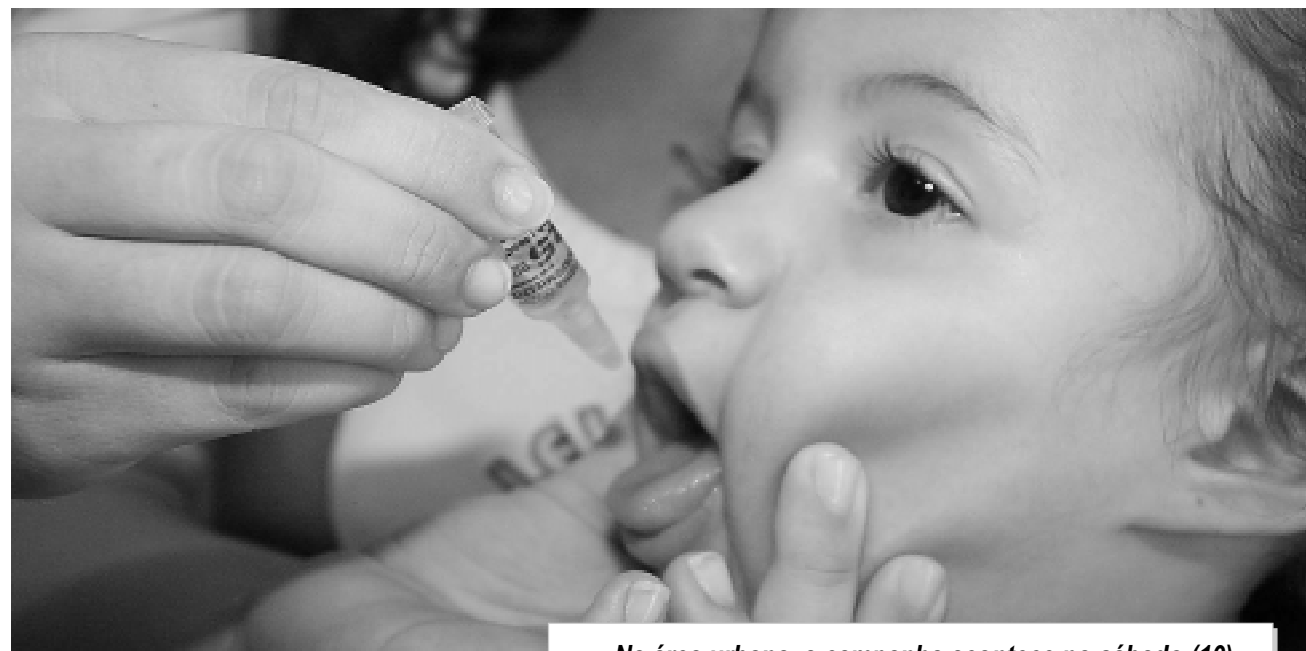
Na área urbana, a campanha acontece no sábado (10)

Rua do Telégrafo, s/n. - Jd. São Fernando - Fone: 34252020