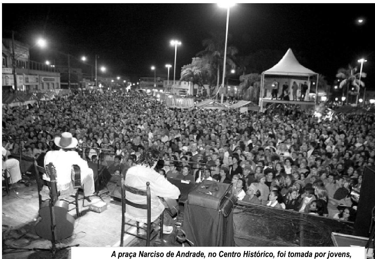
A praça Narciso de Andrade, no Centro Histórico, foi tomada por jovens, adultos e idosos que acompanharam o show do violeiro

No domingo, a programação teve início às 5 horas, com a liturgia tradicional, que inicia com a distribuição do cuscuz de arroz feito pela comunidade e a missa celebrada na Igreja Matriz de Sant’Anna. À noite, centenas de pessoas seguiram a Procissão