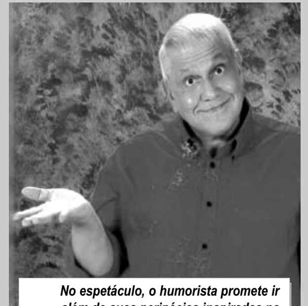
No espetáculo, o humorista promete ir além de suas peripécias inspiradas na criançada e na sátira política

SEXTA-FEIRA (16) - ÀS 21H ESPAÇO CULTURAL SUARÃO