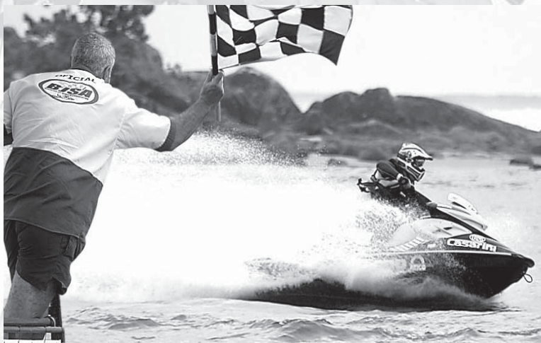
Classificatória para o Mundial, a disputa contará com pilotos consagrados

Considerado um dos maiores eventos náuticos do País, o Campeonato Brasileiro, competição classificatória para o mundial da categoria, promete mais uma vez elevar a adrenalina do público. O evento que será realizado nos dias 10 e 11 de fevereiro, a partir das 9 horas, além de contar com a participação de representantes dos estados de São Paulo, Rio de Janeiro, Minas Gerais, Paraná, Goiás, Rio Grande do Sul e Santa Catarina, também