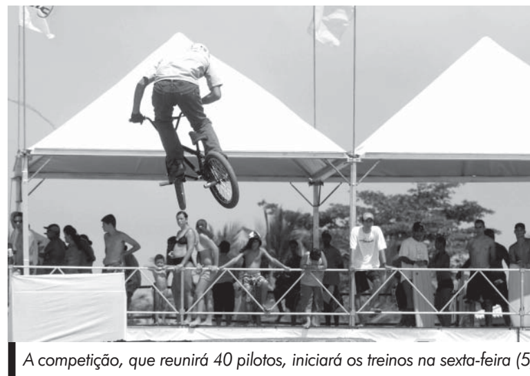
A competição, que reunirá 40 pilotos, iniciará os treinos na sexta-feira (5)

A disputa contará com atletas famosos, como o americano Ricardo Laguna, dos Estados Unidos, que possui grande destaque, e que é pa-