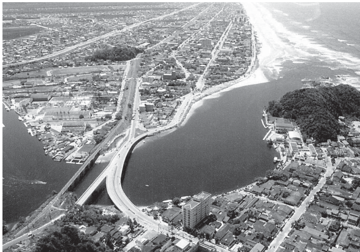
A data deste primeiro vencimento irá contemplar cerca de 6 mil contribuintes

Os prestadores e tomadores de serviço de pequeno porte, que não possuem acesso à Internet, podem procurar o setor de ISS, no Paço Municipal, para a emissão da guia eletrônica de pagamento. Informações podem ser obtidas no setor de ISSQN da Prefeitura, na Avenida Washington Luiz, 75, no Centro; na Internet pelo serviço de atendimento on-line, no endereço eletrônico www.itanhaem.sp.gov.br ; ou pelo telefone 3421-1635.