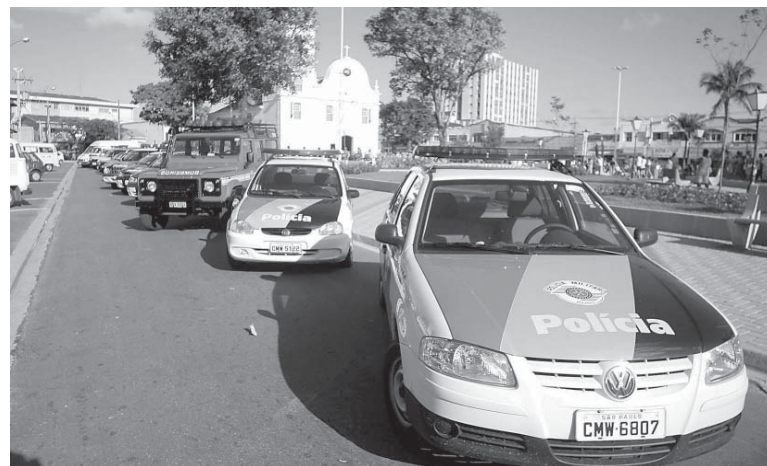
A Prefeitura estará contratando mais 50 agentes de segurança

Na enfermagem, no setor de atendimento diário a população, o contingente de enfermeiros foi ampliado de quatro para seis. O número de auxiliares de enfermagem teve um acréscimo de 84 para 96 profissionais, ampliando de 13 para 15 o acolhimento/dia aos pacientes. Isso sem contar com a Central de Ambulância, criada especificamente para a temporada, a fim de que possa atender de forma mais ágil as emergências que necessita do veículo, sem comprometer o atendimento