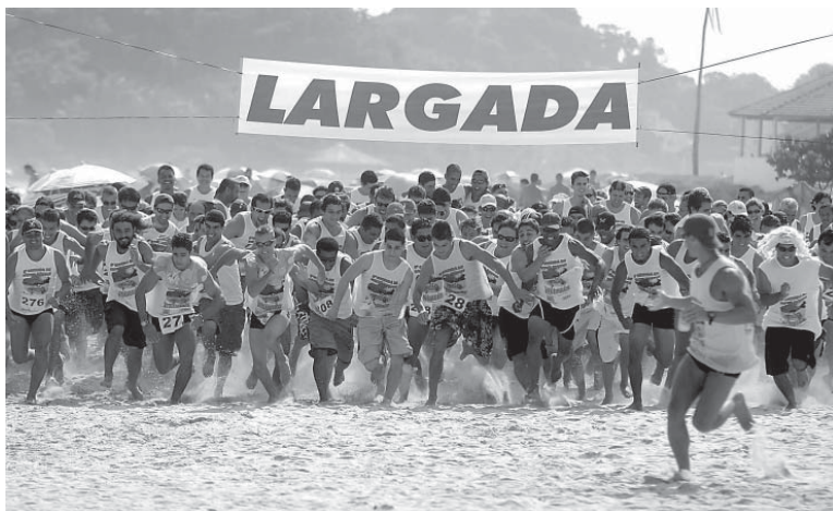
A organização espera reunir cerca de 500 participantes

reunir 500 atletas e com a expectativa de atrair um público de 10 mil pessoas, o evento, ao longo dos 1,5 km de extensão, terá várias atrações, como a bateria da escola de samba União dos