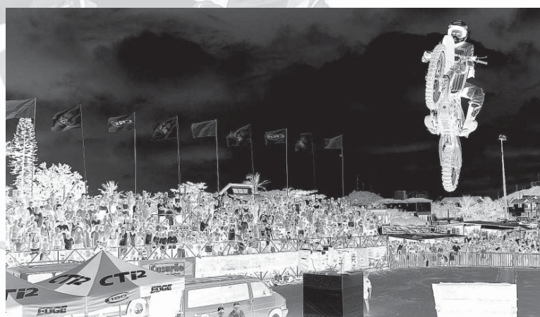
No dia 12 acontecerá o Show Noturno, a partir das 21 horas

motocicletas, a galera da equipe do piloto Jorge Negretti, 10 vezes campeão brasileiro de motocross, contará ainda com o atual campeão