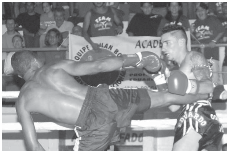
Serão disputadas 10 lutas, variando entre Kick Boxing e Vale-Tudo

Kick Boxing, a boxeadora do Município possui em seu currículo o título de atual vice-campeã brasileira de boxe, na categoria 57 kg, e o de me-