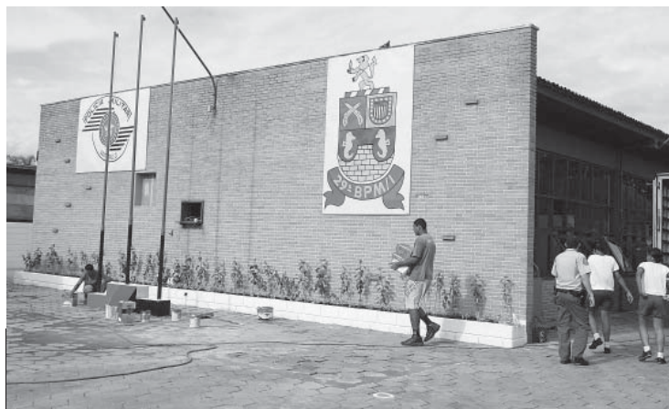
O local também abrigará um posto policial 24 horas

A ESTRUTURA POSSUI 1000 M² DE ÁREA CONSTRUÍDA, ALOJAMENTO, SALA DE INSTRUÇÃO, SETOR ADMINISTRATIVO E ESTACIONAMENTO INTERNO