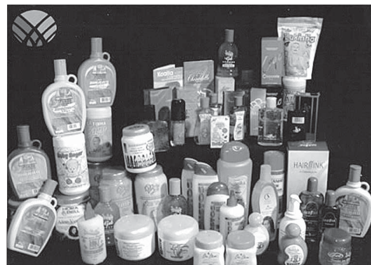
A fábrica tem capacidade para 200 toneladas/mês de aromas

COM MAIS DE 30 MIL TIPOS DE FRAGRÂNCIAS, A EMPRESA VENDE A "MATÉRIA -PRIMA" PARA INDÚSTRIAS DE COSMÉTICOS, PERFUMARIA E DOMISSANITÁRIOS