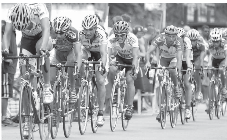
Corredores de todo o País participarão da competição

Este evento é considerado um dos mais importantes do Brasil, visto que é válido pelo ranking nacional e tem grande tradição, pois é disputado há 20 anos consecutivamente.