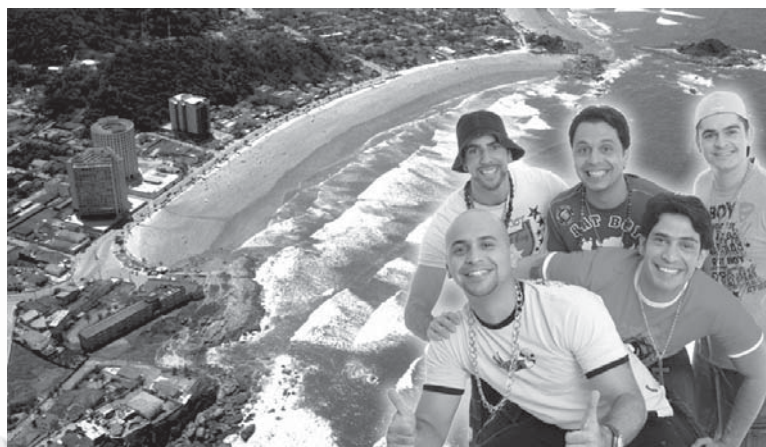
A banda tocará sobre o trio elétrico Bordoada