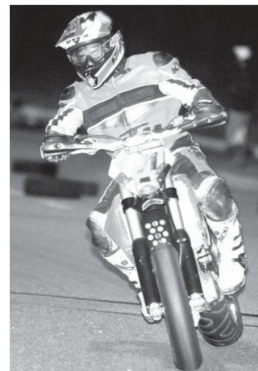
Criada na década de 70, o modalidade envolve trechos de terra e de asfalto

motocross com a adrenalina da moto velocidade.