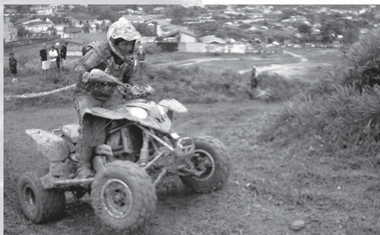
O evento reunirá os principais pilotos do País de motos e quadriciclos

O evento reunirá os principais pilotos do País de motos e quadriciclos, nas categorias profissional e amador, que buscarão demonstrar suas habilidades no intuito de ele-