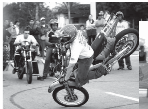
O público poderá curtir show de moto e manobras radicais com skate

SKATE – E também nos dias 20 e 21 de janeiro acontece o Itanhaém Skate Street. O torneio que também será realizado na Avenida Jaime de Castro, e terá início a partir das 9 horas. As disputas serão nas seguintes categorias: no sábado, competem as categorias mirins e iniciantes e, domingo os amadores.