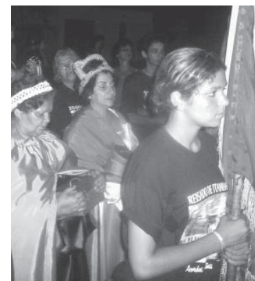
Os moradores são visitados por cantores de todas as idades

radores são acordados com versos seculares, sempre acompanhados da frase "Acordai se estais dormindo".