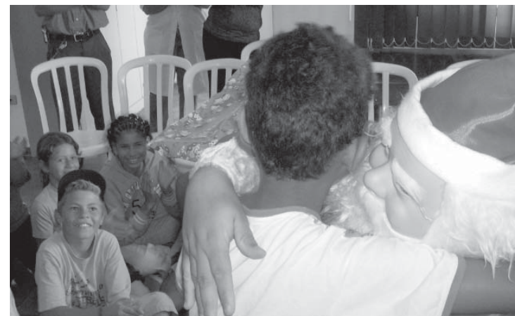
Papai Noel fez a alegria da criança

NO LOCAL, DENOMINADO ESPAÇO APRENDER SÃO CAMILO, OS ASSISTIDOS EXECUTAM ATIVIDADES CULTURAIS, ESPORTIVAS, ARTÍSTICAS E DE REFORÇO ESCOLAR