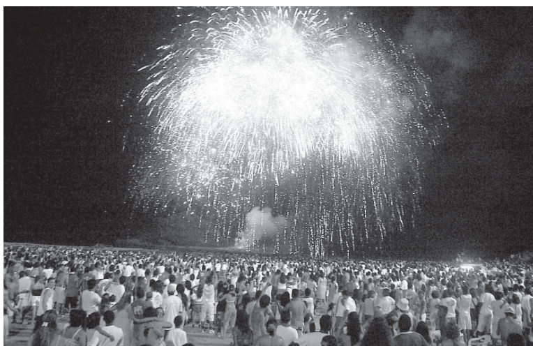
A contagem regressiva será realizada pela banda Verão

A partir das 22h30, munícipes e turistas poderão se divertir com o trio elétrico Bordoadada e a banda Verão, na Praia dos Sonhos. A contagem