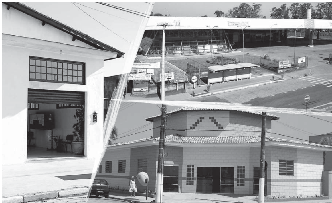
As agências na Cesp, Gaivota e Suarão estarão funcionando a partir de janeiro, as demais até março

Outra vantagem serão os empréstimos a população de baixa renda, que contemplarão de forma significativa as pessoas que não possuem comprovação de renda, visto que apenas a apresentação do documento de identidade, o RG, e Cadastro de Pessoa