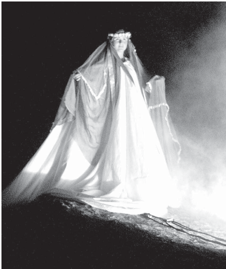
A apresentação noturna contará com efeitos especiais

A ser apresentada todo sábado, até o dia 10 de fevereiro, a peça, que reúne fé e cultura num reduto de belezas naturais, situado na praia da Gruta Nossa Senhora da Conceição, contará com efeitos especiais, que prometem deixar o evento ainda mais emocionante. Vale ressaltar que, o espetáculo é gratuito e voltado a pessoas de todas as idades, podendo sofrer alterações em datas em casos de mau tempo.