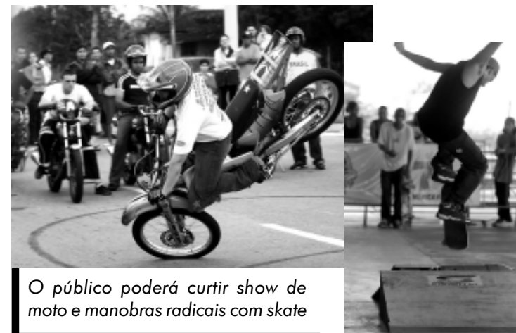
O público poderá curtir show de moto e manobras radicais com skate