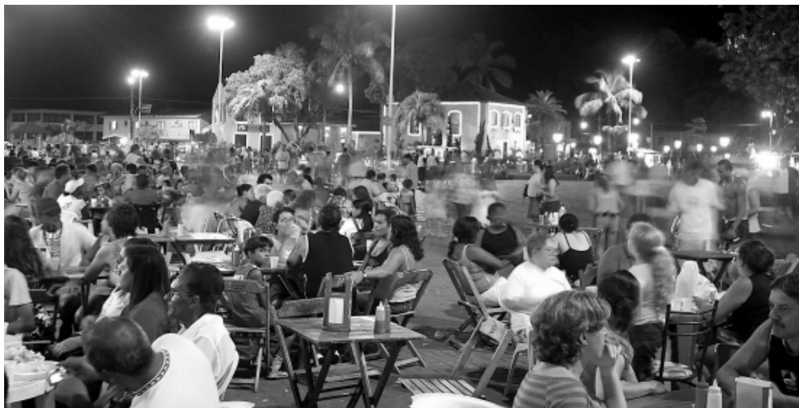
O Centro, totalmente reurbanizado, foi um dos pontos mais movimentados da cidade

ALÉM DO GRANDE FLUXO DE TURISTAS QUE SE DIRIGIRAM AO LITORAL, O FATO DA CIDADE OFERECER UMA INFRA-ESTRUTURA MELHOR CONTRIBUIU NA ELEVAÇÃO DOS NEGÓCIOS