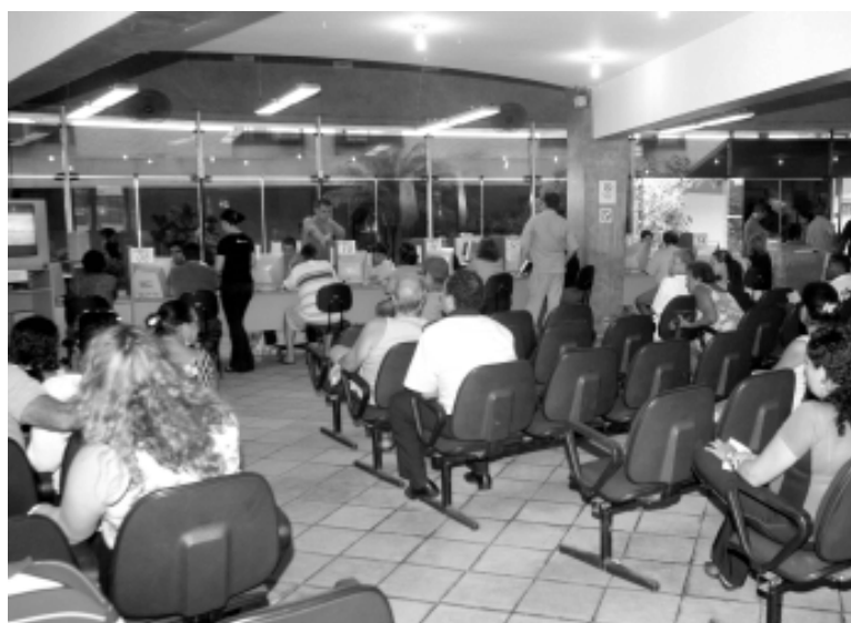
Cerca de 80% dos contribuintes atendidos estão estranhando a diferença no valor

Está cobrança que, foi readequada após estudo, tem como objetivo incentivar o desenvolvimento da economia no Município e a geração de empregos. Já para os moradores da Zona 1, região entre a praia e ferrovia, e Zona 2, que compreende entre a ferrovia e ro-