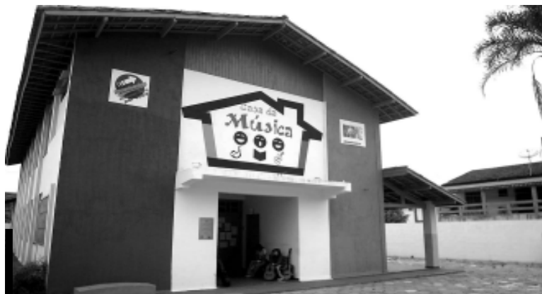
No local serão oferecidos mais de 20 cursos

Os interessados devem comparecer na Casa da Música, munidos da xerox do RG ou certidão de nascimento, xerox do comprovante de residência, duas fotos 3x4 recentes e a declaração de escolaridade, caso esteja estudando.