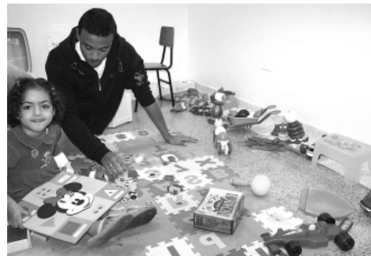
São aguardados brinquedos que atendam crianças de 8 a 12 anos

No dia 20 de dezembro, o setor recebeu a doação de um televisor de 20”, em ação promovida pelo Fundo Social de Solidariedade em parceria com Associação Comercial, Agrícola e Industrial de Itanhaém (ACAI). Agora a expectativa é ganhar também um aparelho de DVD, para exibir filmes educativos.