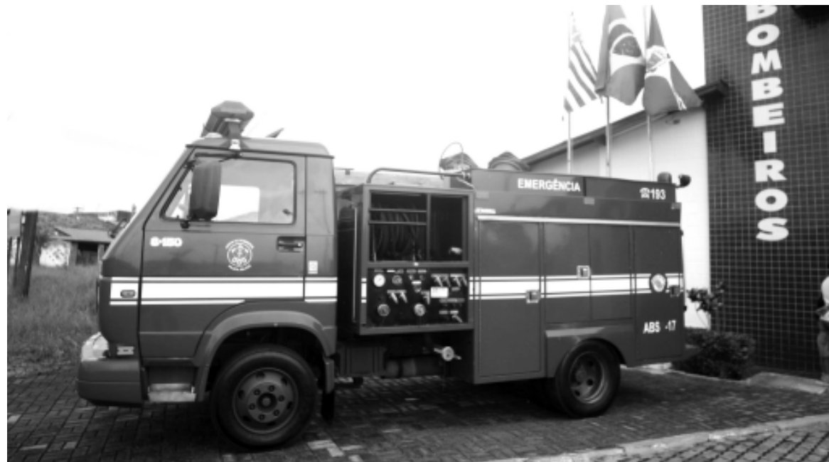
Somente em 2006 foram registradas 1.475 ocorrências, e ainda, 21.600 atendimentos pelo 193

Vale ressaltar que aqueles que não efetuarem o pagamento no vencimento terão de regularizar a situação mediante a cobrança da multa