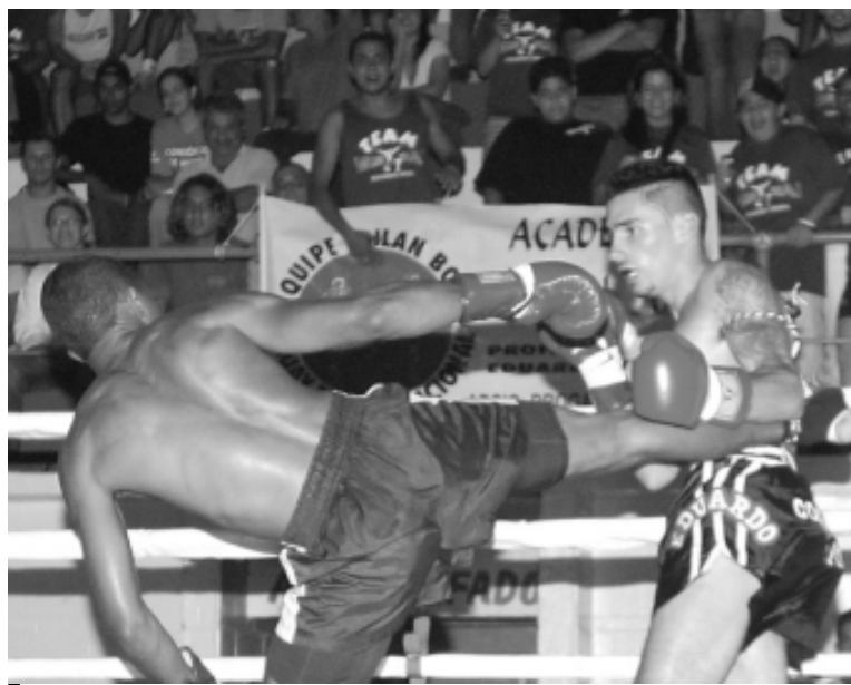
Serão disputadas 10 lutas, variando entre Kick Boxing e Vale-Tudo

Além de campeã de Thai Kick Boxing, a boxeadora do