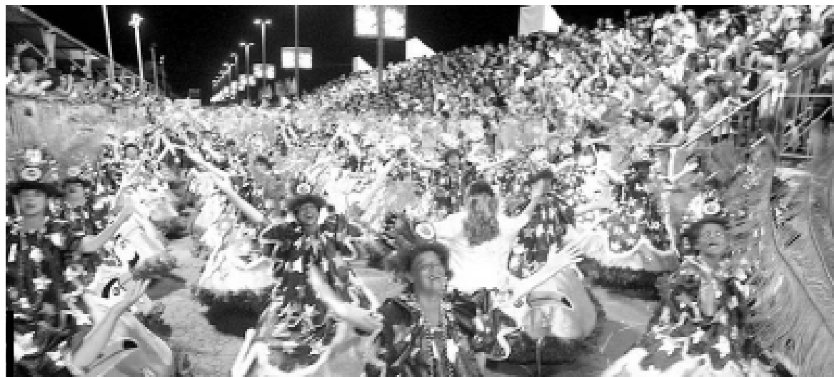
Passarão pela avenida do samba seis escolas, além dos blocos de arrasto

A ORDEM DOS DESFILES JÁ ESTÁ DEFINIDA, COM O BLOCO DE ARRASTO MARECHAL RONDON ABRINDO A FESTA