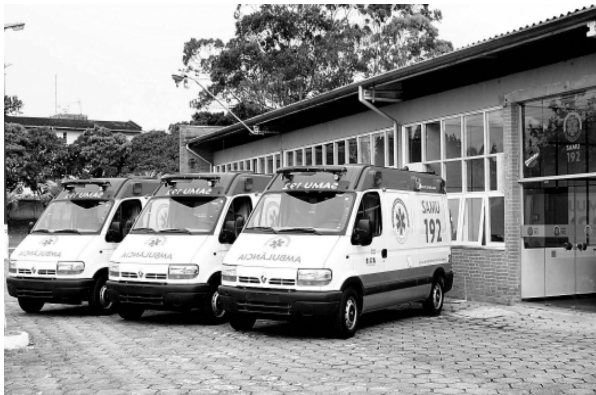
Setor aguarda Ministério da Saúde para inauguração do serviço

Com a intenção de melhorar o atendimento, a Secretaria de Saúde centralizou os serviços de remoção de pacientes, junto com as viaturas do SAMU, na Central de Regulação, instalada no Paço Municipal II, no trevo da Cesp.