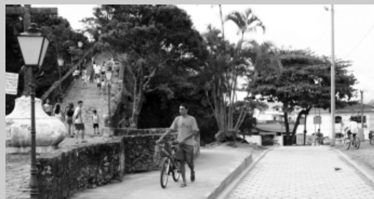
Este trecho liga a marginal da linha do trem ao Centro Histórico

Neste trecho foram utilizados 176 metros lineares de guia, 530 m 2 de lajota e 140 m 2 de calçada. Além das melhorias que estão em harmonia com a reurbanização do Centro Histórico, nos dois pontos foram instaladas luminárias para maior segurança dos usuários.