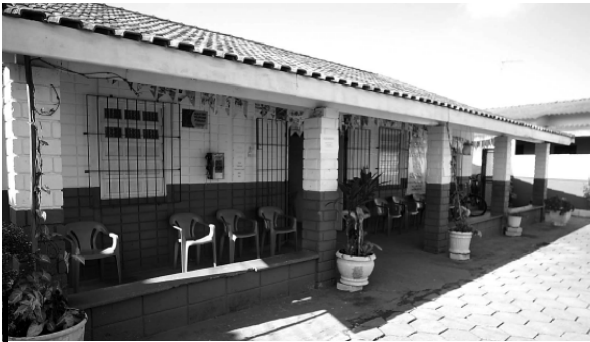
O CRAS do Oásis fica na rua José Batista Campos, 1572

O REPRESENTANTE LEGAL DEVERÁ COMPARECER AO CRAS DO OÁSIS, NA RUA JOSÉ BATISTA CAMPOS, 1.572, ENTRE OS DIAS 15 DE JANEIRO E 2 DE FEVEREIRO