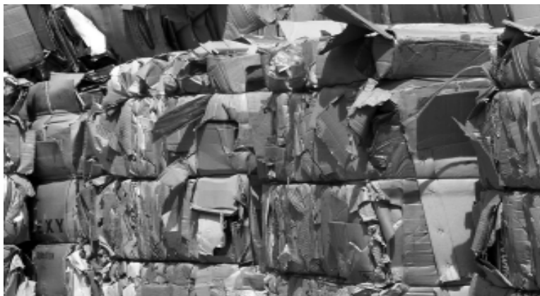
A resolução tem como intuito estimular atividades que colaborem na redução do lixo

AS NOVAS NORMAS SÃO EM TORNO DA ESTRUTURA E HIGIENE DOS ESTABELECIMENTOS, BEM COMO DA MANIPULAÇÃO DOS PRODUTOS COLETADOS, COMO PET'S, SUCATAS, VIDROS, PLÁSTICOS E PAPELÃO