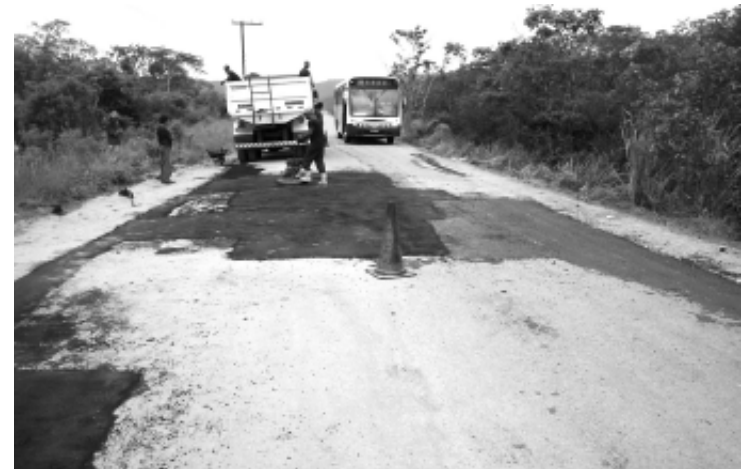
O serviço compreende 15 km da estrada Cel. Joaquim Branco

A OBRA ESTÁ TORNANDO OS BAIRROS AGUAPEÚ, COTIA E RIO BRANCO MAIS ACESSÍVEIS, FACILITANDO, CONSEQÜENTEMENTE, O TRANSPORTE DOS PRODUTOS AGRÍCOLAS DA REGIÃO