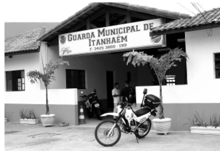
A GM tem por objetivo preservar o bem estar da população

SEGUNDO LEVANTAMENTO ANUAL DA CORPORACÃO, SOMENTE NO APOIO AOS ÓRGÃOS DE SEGURANÇA, COMO CENTRAL DE AMBULÂNCIA, ORIENTAÇÃO NO TRÂNSITO E POLICIAMENTO NOS EVENTOS PÚBLICOS SOMAM-SE 953 OCORRÊNCIAS