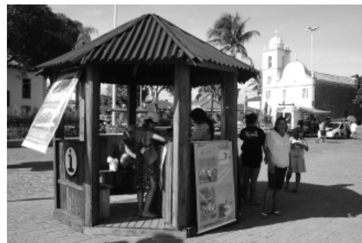
Os postos funcionam todos os dias com horários diferenciados

Os PIT's funcionam das 9 às 19 horas, com exceção para a Praça Narciso de Andrade e a Regional do Suarão, estas funcionam até às 22 horas, e a da Praça do Suarão, que fica com atendimento até às 20 horas. Para poder atender os visitantes estrangeiros, estão de plantão, na Casa de Câmara e Cadeia, dois funcionários bilíngües. Caso haja alguma dúvida, os demais agentes entram em contato com os profissionais, que facilitam a comunicação. Os PIT's funcionarão de segunda a segunda até 2 de março, voltando às atividades em feriados prolongados e nas férias de julho.