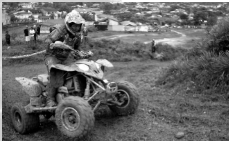
O evento reunirá os principais pilotos do País de motos e quadriciclos

O evento reunirá os principais pilotos do País de motos e quadriciclos, nas categorias profissional e amador, que buscarão demonstrar suas habilidades no intuito de ele-