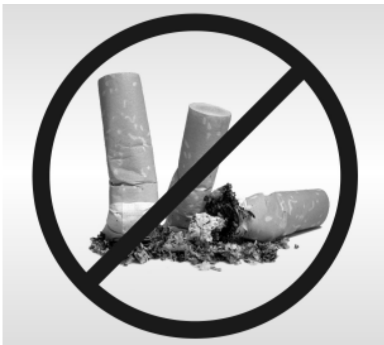
A unidade estará oferecendo a oportunidade àqueles que desejam parar de fumar

De acordo com a secretaria de Saúde a população poderá contar com todo o suporte necessário. "Todos que recorrerem ao Programa terão a disposição acompanhamen-