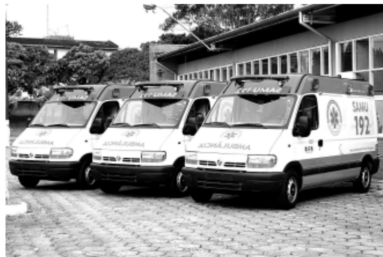
O SAMU é composto por três ambulâncias, sendo uma de suporte avançado e duas de suporte básico

As unidades operarão na rodovia e nas áreas urbanas e marítimas. O trabalho será realizado em conjunto com o Corpo de Bombeiros, os Guarda-vidas, e também a Defesa Civil nos casos de urgência e emergência. O SAMU – atenderá pelo telefone 192 - é composto por três ambulâncias, sendo uma