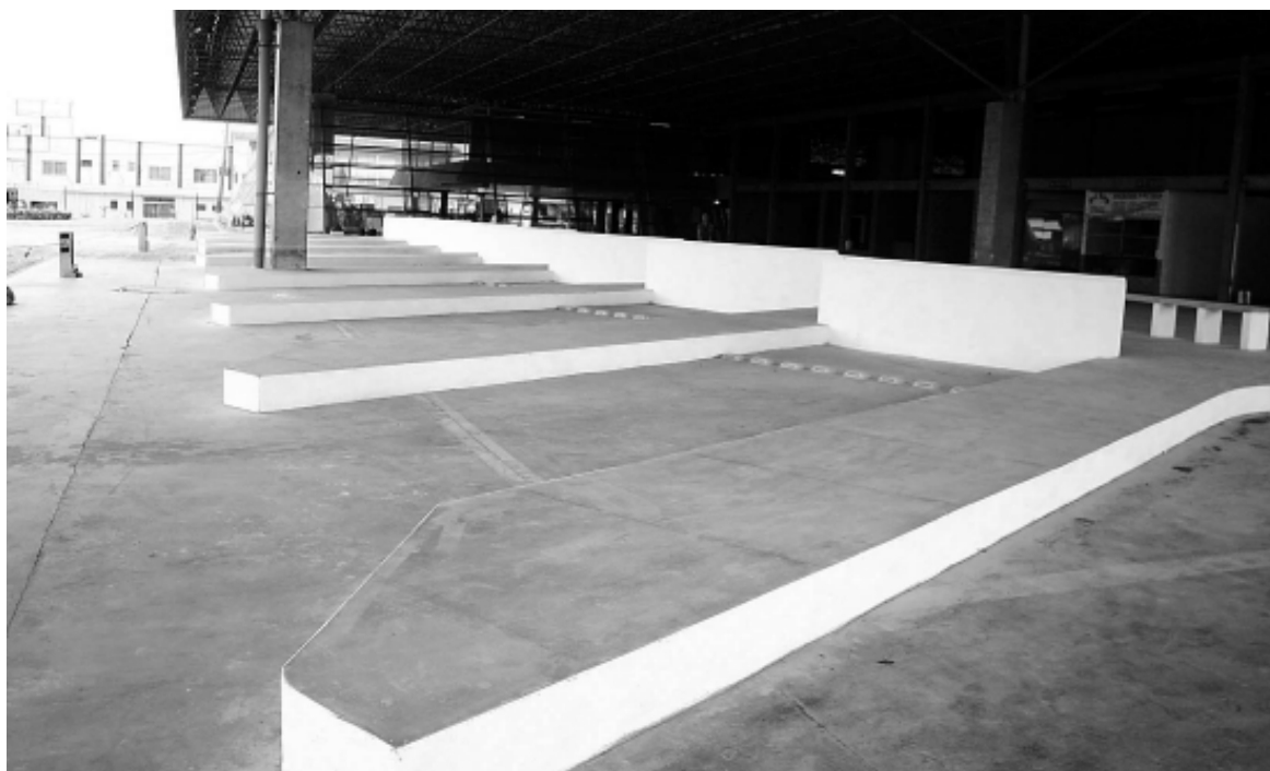
As viações Breda, Intersul, Piracicabana, Novo Horizonte e Pluma já estão confirmadas

ESTRUTURA - O local contará com sete plataformas, além de restaurante, ponto de táxi, caixas eletrônicos, lanchonete, espaço para exposição de artesanato e dois estacionamentos, com capacidade para aproximadamente 200 carros. Futuramente, será implantada uma Central de Monitoramento com câmeras de vigilância e serviços de som, no intuito de facilitar o embarque dos passageiros, avisando os horários e destinos. "Queremos proporcionar aos munícipes e turistas um lugar adequado e com segurança", concluiu o chefe do Executivo.