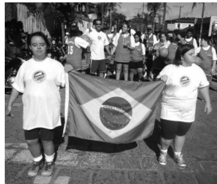
O programa atende cerca de 150 pessoas de diversas deficiências e síndromes

Informações sobre o projeto Lugar ao Sol podem ser obtidas no telefone 3421-1700 ramal 1774. Para modalidades esportivas o Lugar ao Sol conta com o apoio do Clube Náutico e da Academia Adrenalina.