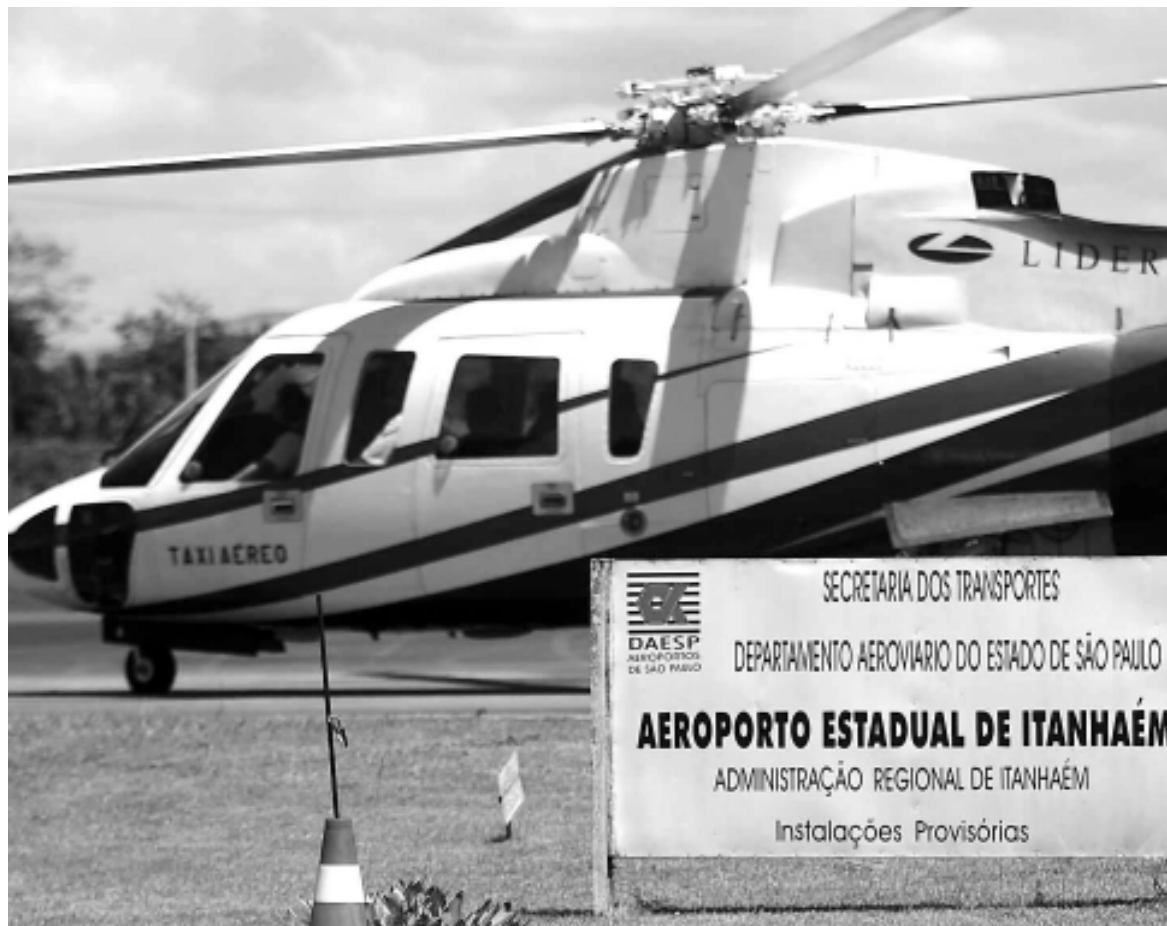
A Petrobras utiliza o Aeroporto Estadual de Itanhaém para as operações de vôos com helicópteros, no transporte de funcionários para a Plataforma de Merlusa, na exploração de petróleo e gás natural

"Sem dúvida esta é uma ferramenta que irá beneficiar não só a Itanhaém, como também todas as cidades da Região. O reflexo já pode ser visto nos setores de hotelaria, gastronomia e transporte", enfatizou o Governo Municipal, em relação ao benefício que o empreendimento pode gerar, principalmente no setor de turismo.