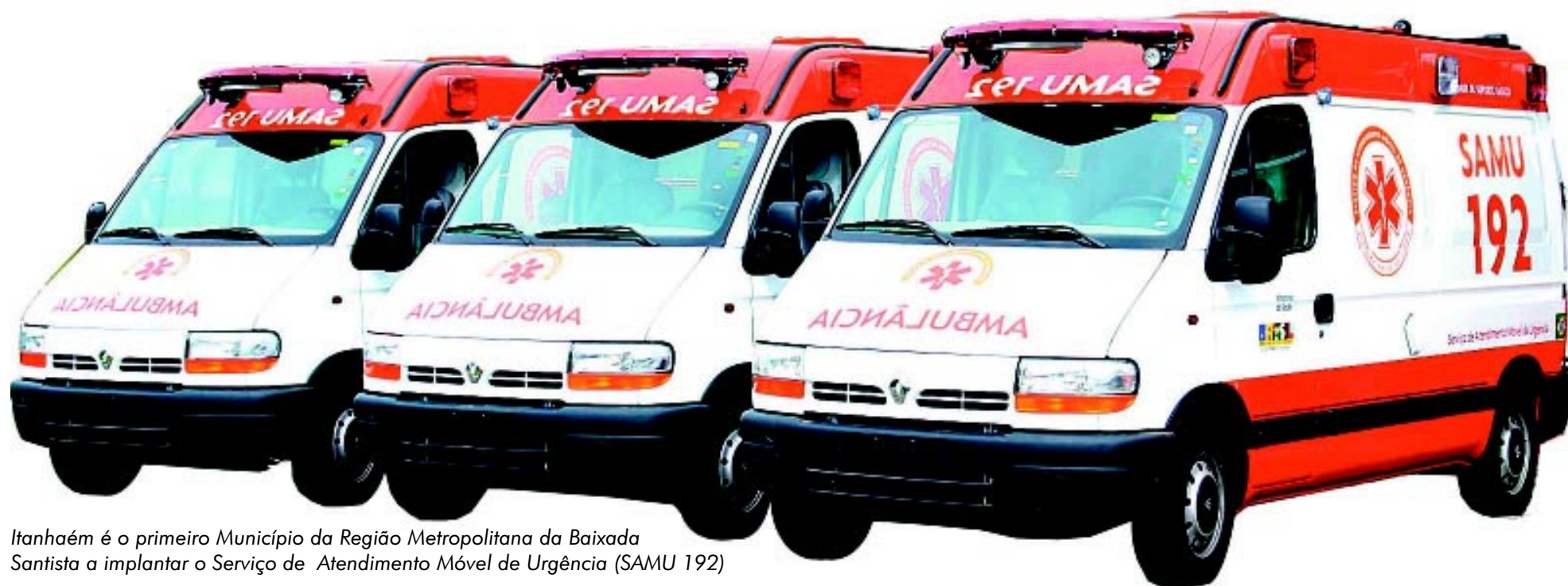
Itanhaém é o primeiro Município da Região Metropolitana da Baixada Santista a implantar o Serviço de Atendimento Móvel de Urgência (SAMU 192)