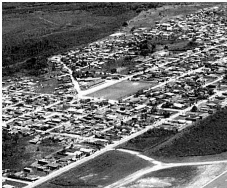
A fiscalização preventiva tem sido efetuada duas vezes por semana, em conjunta pelos departamentos de Meio Ambiente e de Áreas Verdes

A fiscalização preventiva tem sido efetuada duas vezes por semana, de forma conjunta pelos departamentos de Meio Ambiente e de Áreas Verdes, com base na Portaria SHMA n° 01/07. Já