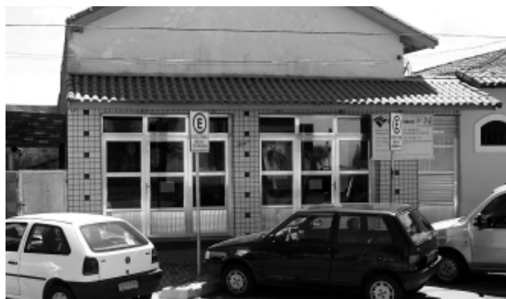
Atualmente a Receita Federal atende na Praça Carlos Botelho, nº 221 - no Centro

O empreendimento que será localizado na Avenida Rui Barbosa, em frente à Escola Estadual Benedito Calixto, no Centro, contará com tecnologia de ponta para atendimento ao público e controle de documentos.