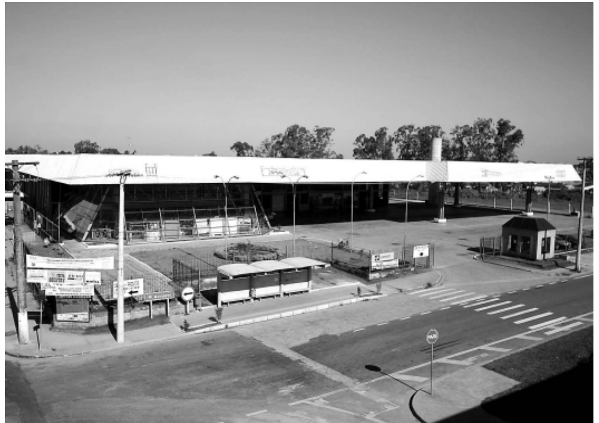
O terminal disponibilizará viagens para várias cidades do País e também do Exterior

A estimativa é que haja uma circulação média de 100 mil pessoas por mês, somente na baixa temporada. Na alta, esse número poderá quadruplicar. O novo terminal, que tem sete plataformas, possui uma