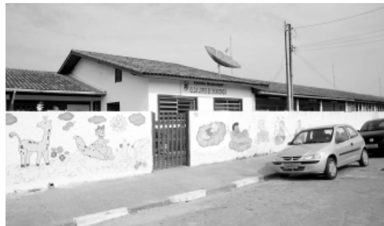
A E.M. Olga Lopes de Mendonça fica na Rua São Luis, 136, Balneário Gaivota

Após esta primeira etapa, os aprovados serão entrevistados