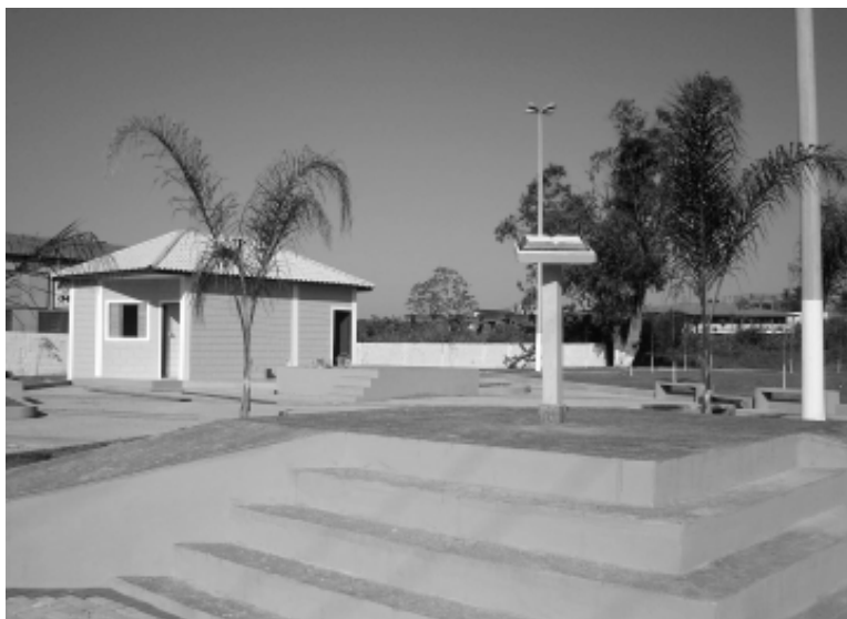
Após a cerimônia de inauguração será realizado um culto com música, dança e apresentação teatral

Após a cerimônia de inauguração será realizado um culto com música, dança e apresentação teatral.