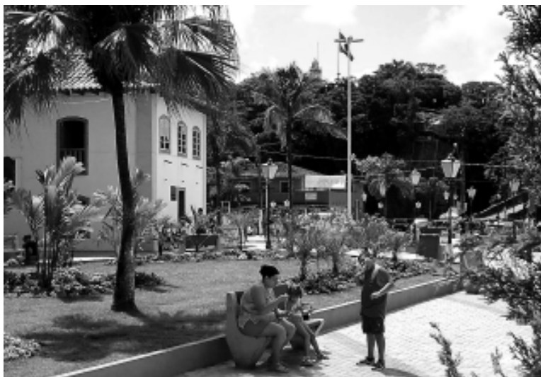
A exposição conta com gravuras e fotos que narram a história do padre no Brasil

A mostra conta com gravuras e fotos, além da distribuição de santinhos e fitas bentas. Dentre os objetos de maior significado está uma relíquia, a lasca do osso da tíbia do famoso padre, cedida