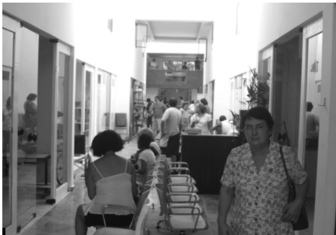
A unidade disponibiliza consultas com cardiologista, dermatologista, urologista, gastroenterologista, reumatologista, entre outras

Parte deste índice também é resultado dos investimentos realizados pelo Governo Municipal, disponibilizando no-