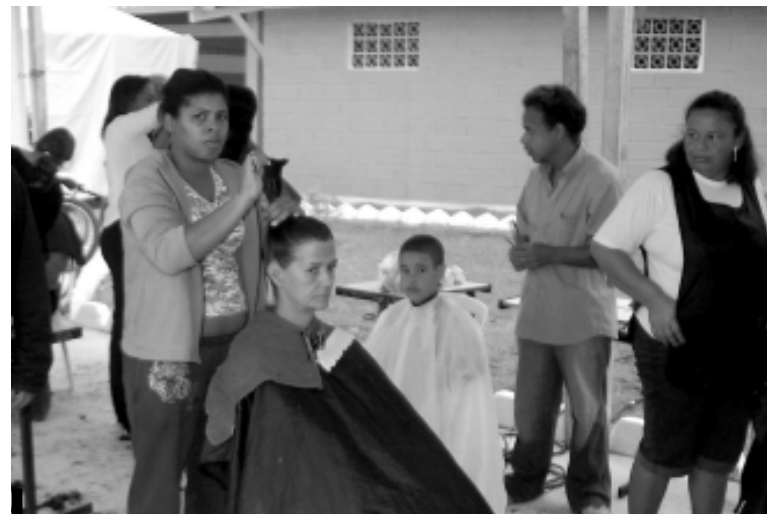
O balanço final do mutirão encerrado na quinta-feira (21) demonstrou um saldo positivo

ministração Municipal, a 3ª edição do programa teve sua meta atingida. "Estamos muito satisfeitos com a repercussão positiva que o programa está tendo junto aos bairros contemplados. Isso se deve, principalmente, a possibilidade de obterem serviços essenciais perto de casa e gratuitamente".