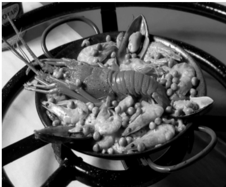
A população poderá degustar comidas típicas do Norte e do Nordeste como sarapatel, buchada de boi e mexilhões

A Miss Melhor Idade recebeu um conjunto de colar e brincos, uma sessão de beleza, com direito a massagem e limpeza de pele, uma viagem para Holambra e flores. O Mister foi premiado com um relógio, uma sessão de estética e a viagem para Holambra. A Miss Simpatia e a Miss Elegância também ganharam um conjunto de colar e brincos.