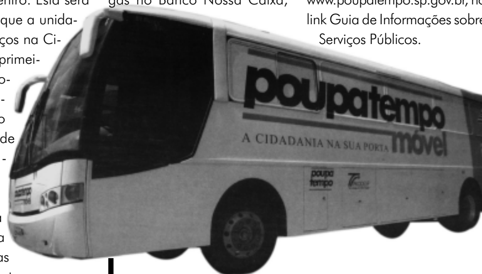
A unidade possui capacidade para atender cerca de 300 pessoas por dia

instalado no interior da unidade. No local, o munícipe poderá adquirir também duas fotos 3x4 por R$ 3,50 e xerox pelo custo de R$ 0,15. Mais informações pelo Disque-Poupatempo 0800-7723633, ou pelo site www.poupatempo.sp.gov.br , no link Guia de Informações sobre Serviços Públicos.