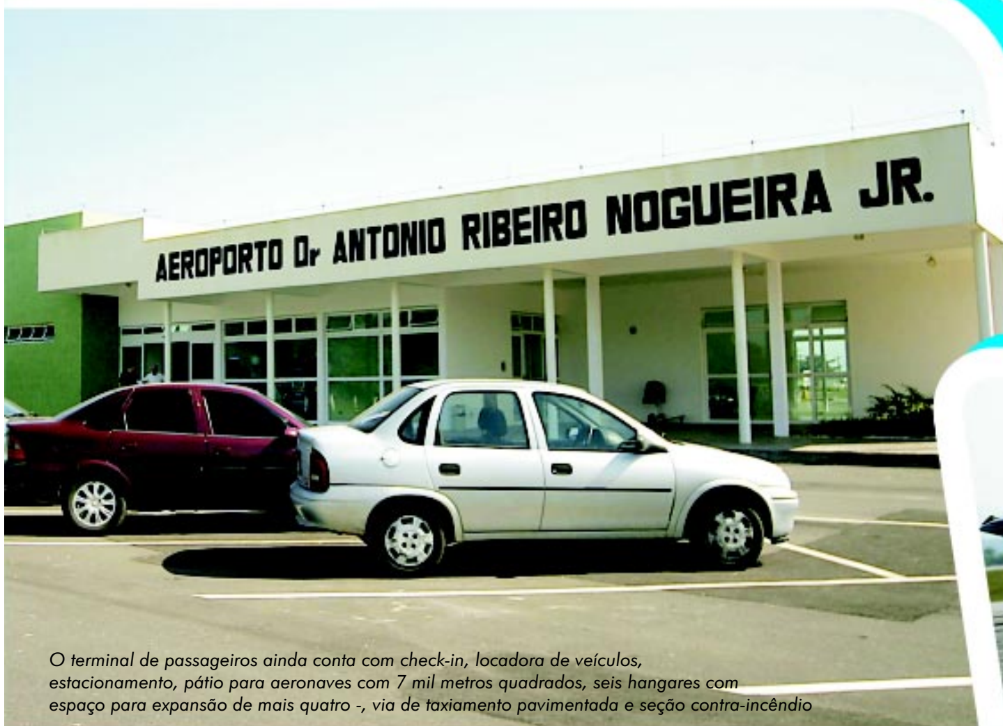
O terminal de passageiros ainda conta com check-in, locadora de veículos, estacionamento, pátio para aeronaves com 7 mil metros quadrados, seis hangares com espaço para expansão de mais quatro -, via de taxiamento pavimentada e seção contra-incêndio

O aumento da pista em cinco vezes possibilitará o recebimento de 500 passageiros por hora e 500 mil toneladas de carga. Hoje, o aeroporto atua como base de operações da Petrobras no