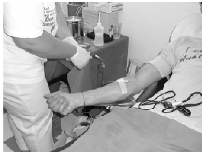
Atualmente o estoque atende o Hospital e o Pronto-Socorro de Itanhaém, além de contribuir com Mongaguá e Peruíbe

As principais causas de inaptidões para a doação de sangue são os candidatos com história de doenças hematológicas, cardíacas, renais, pulmonares, hepáticas, autoimunes, diabetes, hipertireoidismo, hanseníase, tuberculose, câncer, sangramentos anormais, convulsões, ou portadores de doenças in-