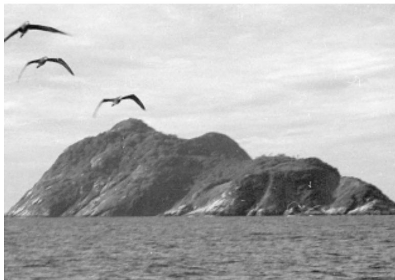
A exposição conta com um clima natural de vegetação, e destaque para a cobra Jararaca Ilhoa