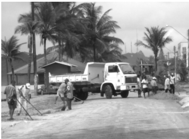
Os selecionados terão um contrato de seis meses e receberão bolsa auxílio de um salário mínimo, mais cesta básica

Os interessados devem comparecer no Posto de Atendimento ao Cidadão, na Avenida 31 de Março, 1505, no trevo da Cesp, levando o Registro