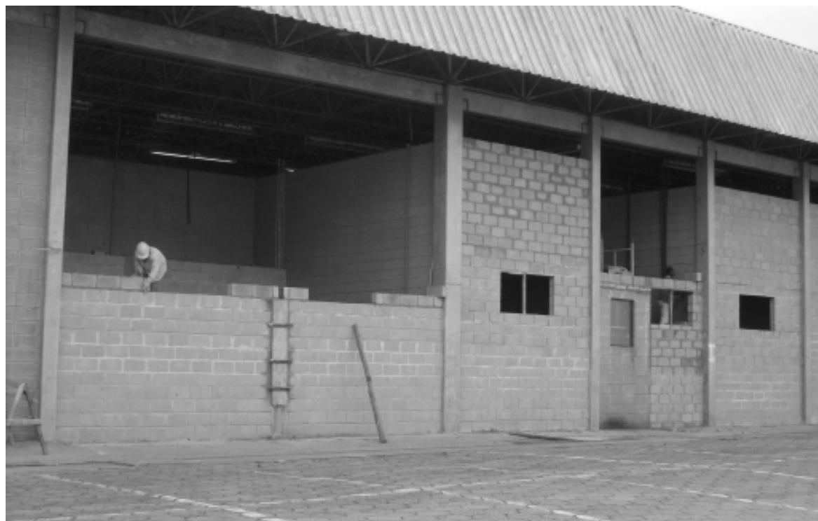
O local, localizado no Centro do Produtor, que está sendo reformado, receberá o Kit Equipamentos, no valor de R$ 60 mil, enviado pelo Ministério de Desenvolvimento Social e Combate à fome (MDS)

OBRAS - As reformas de adequação das instalações do Banco de Alimentos estão sendo realizadas no Centro do Produtor e devem ser finalizadas também em agosto. O local deverá conter área administrativa, espaço de treinamento, área de recebimento, expedição, depósito, triagem, carga e descarga, higieniza-