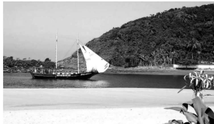
A Boca da Barra conquistou o 1º lugar com 3.226 votos

A votação envolveu paisagens naturais, obras artísticas, monumentos e construções arquitetônicas