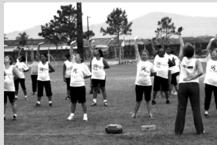
A técnica já contribuiu com a melhora da saúde de muitos praticantes, principalmente da terceira idade

De 100 pessoas cadastradas no programa do Governo Federal Hipertensão, mais e 50% já apresentaram regularidade na pressão arterial graças a prática do Lian Gong