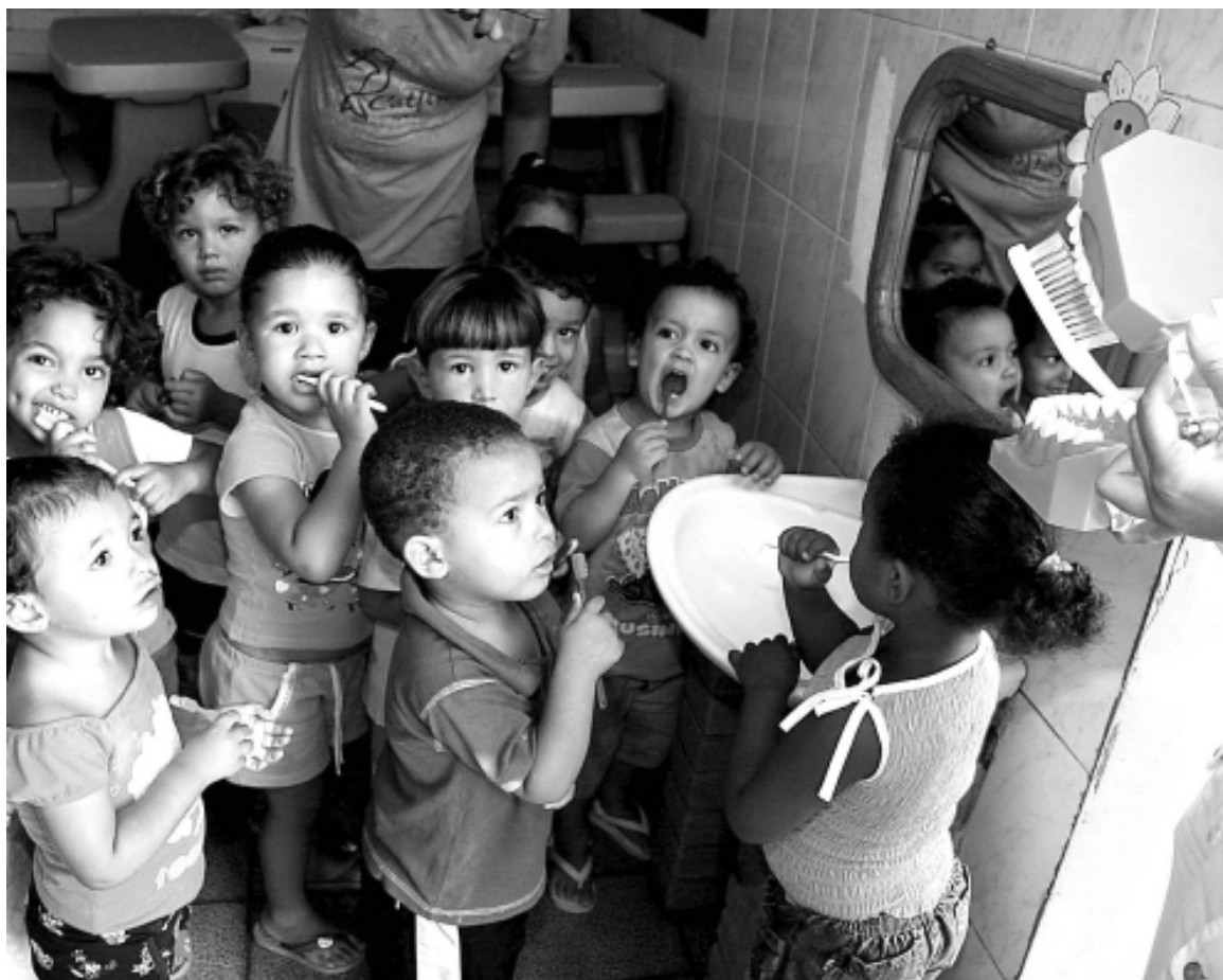
As ações acontecerão até o dia 15 de fevereiro e estarão envolvendo na primeira fase 1.117 crianças

Além de atividades lúdicas como recortes de revistas, colagens e brincadeiras, os pais e responsáveis também receberão orientações através de palestras sobre orientação alimentar, hábitos prejudiciais a arcada dentária, dieta e aleitamento materno