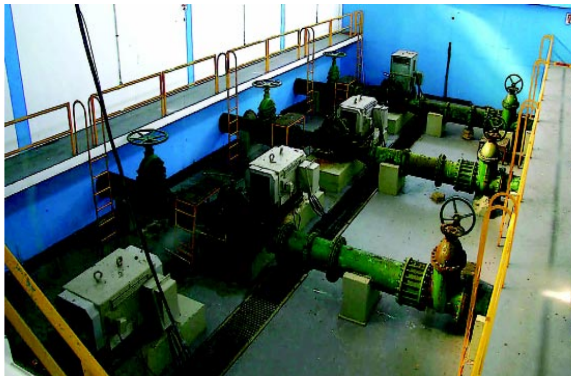
As melhorias serão realizadas numa área próxima da atual Estação. A antiga unidade também será reformada

As melhorias serão realizadas numa área próxima de onde opera a atual Estação. Além do processo de construção, a unidade atual tam-