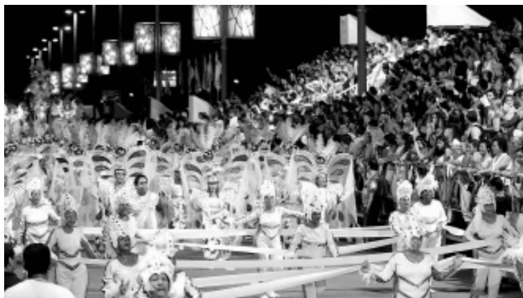
A novidade deste ano ficará por conta da inclusão dos Blocos de Enredo

A programação na Avenida do Samba iniciará na sexta-feira (1º), com a apresentação da Corte Carnavalesca, do bloco de arrasto Dragões do Oásis e dos trios-elétricos