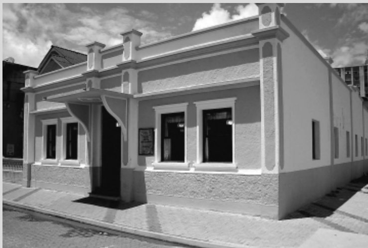
O valor total da melhoria que Itanhaém receberá é de aproximadamente R$ 41 mil

cessário estar munido do RG, comprovante de residência e pagar uma taxa de matrícula no valor de R$ 1,00.