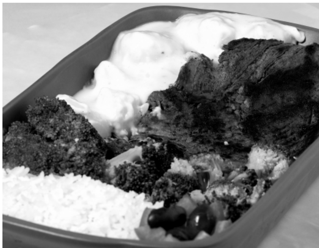
Guias com a lista completa de pratos e localização dos estabelecimentos participantes podem ser encontrados na Secretaria de Turismo, que fica na av. 31 de Março, 1.505, trevo da Cesp

Guias com a lista completa de pratos, valores e localização dos estabelecimentos participantes podem ser encontrados nos pontos de maior circulação da Cidade ou na Secretaria de Turismo, na avenida 31 de Março, 1.505, no trevo da Cesp. Informações pelo telefone da Acaitur 3426-2000.