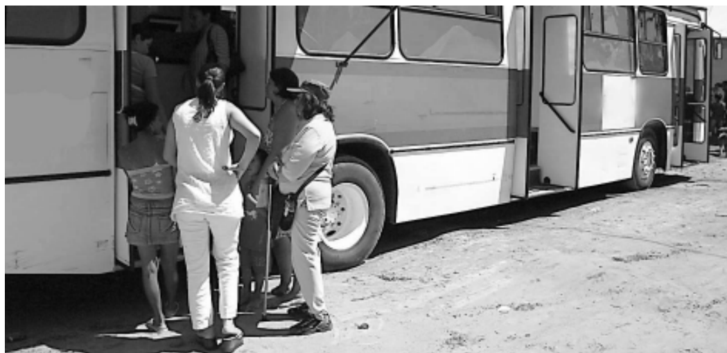
O projeto Saúde Sobre Rodas, está atuado desde o mês de fevereiro, e já beneficiou mais de 17 mil pessoas

A unidade móvel estará entre os dias 22 e 26 de setembro, na escola Diva do Carmo Alves de Lima, situada a rua 2, s/ nº, de segunda a sexta-feira, das 9 às 16 horas