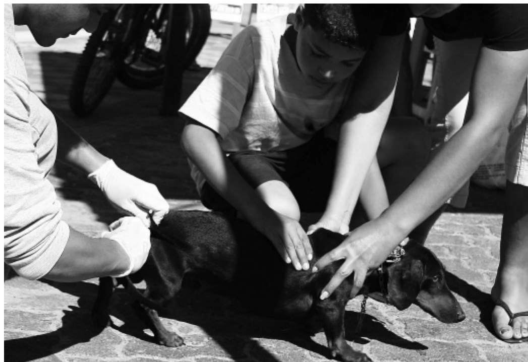
De acordo com estimativa do Departamento de Vigilância à Saúde, a meta para este ano é imunizar mais de 23 mil cães e gatos do Município

Para as pessoas que têm dificuldades em levar o animal até o posto fixo, o Departamento está solicitando que entrem em contato pelos telefones 3426-5105 ou 3422-1944 para que, de acordo com a disponibilidade, seja agendada a vacinação na residência. Vale ressaltar que este serviço é somente para aqueles que realmente não conseguem transportar o animal até o local de vacinação.