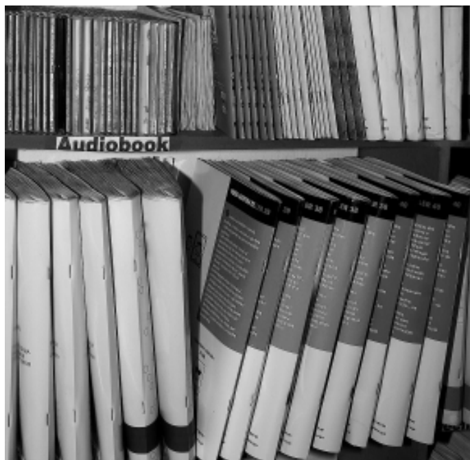
O material faz parte do projeto da Fundação Dorina Nowill para Cegos (FDNC), que visa levar obras contemporâneas aos deficientes visuais

Dentre os novos clássicos da literatura nacional e best-sellers em braille estão: História de Ficção Científica, Poesia Marginal, Mitos Indígenas, São Bernardo, Menino de Engenho, entre outros