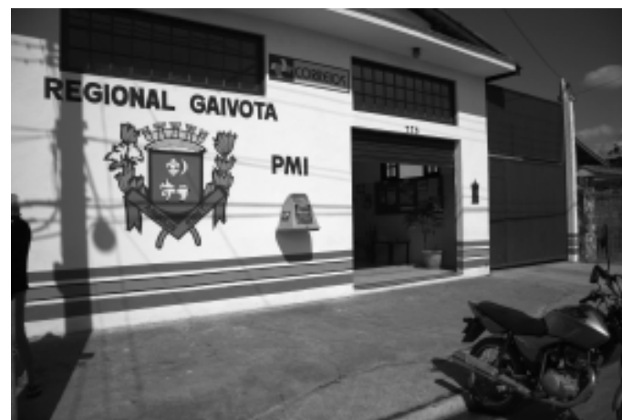
O serviço está disponível nos bairros Suarão, Jardim Oásis, Umarama e também no Posto de Atendimento do Gaivota

De acordo com a Secretaria a descentralização facilitará aos cidadãos que encontrarão na sua região uma base para estar sempre a par da sua situação junto aos Governos Federal e Estadual, além de ter um acesso facilitado para esclarecimento de dúvidas. Ainda segundo dados do setor, atualmente o Município possui em sua base de dados 6.300 famílias cadastradas no Bolsa Família, 110 pessoas no Renda Cidadã, 150 no Ação Jovem, 50 no PETI, 620 no Viva Leite e 50 no Projovem-Adolescente.