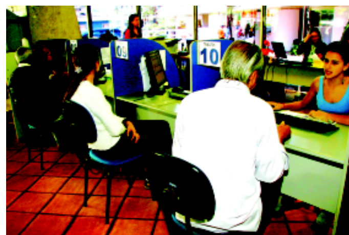
O contribuinte deve possuir no máximo duas propriedades e ter renda mensal que não ultrapasse dez salários mínimos, dentre outros requisitos

Para outras informações, inclusive sobre demais documentos, basta ligar no telefone 3421-1636.