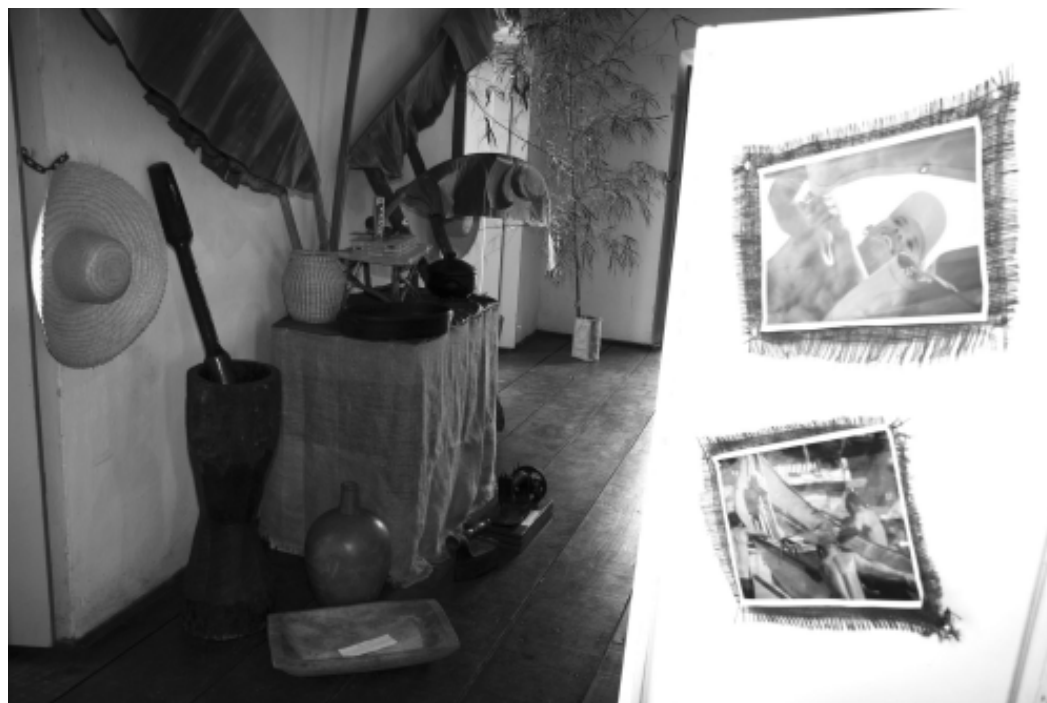
A mostra segue até o dia 24 com diversos objetos como fotos, panelas de barro, fogão à lenha e redes de pesca

A mostra acontece de segunda a sexta-feira, das 9 às 18 horas. Durante finais de semana e feriados, o atendimento é estendido até às 20 horas. O ingresso custa R$ 1,00, sendo que para crianças com até 12 anos e idosos acima de 60 a entrada é franca.