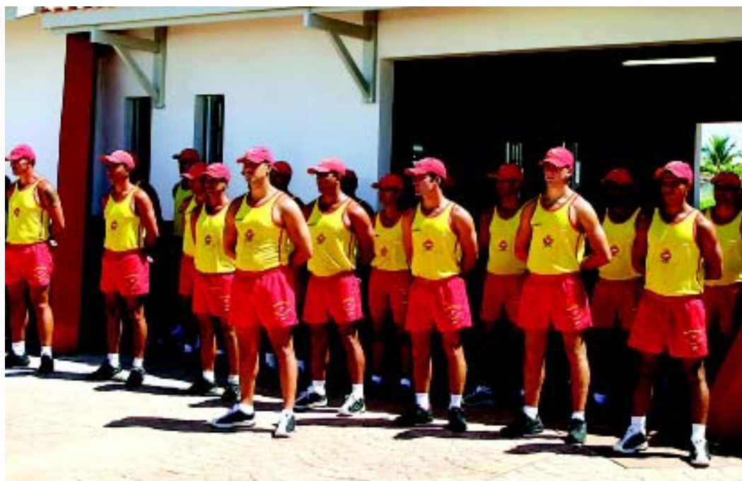
Os interessados devem comparecer ao Posto do Corpo de Bombeiros, na avenida Mario Covas Júnior, s/nº, no Cibratel II, todos os dias, das 9 às 17h

Para realizar o cadastro é preciso ter no mínimo 18 anos, ensino fundamental completo, não possuir antecedentes criminais e, no caso dos homens, estar quite com a situação militar