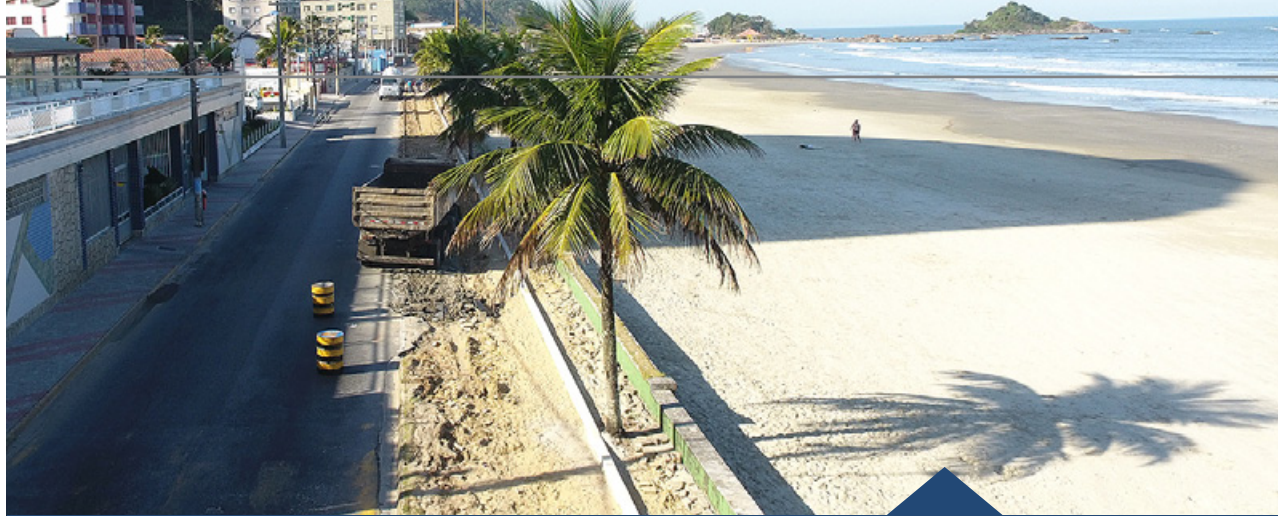
Av. Vicente de Carvalho • Praia dos Sonhos