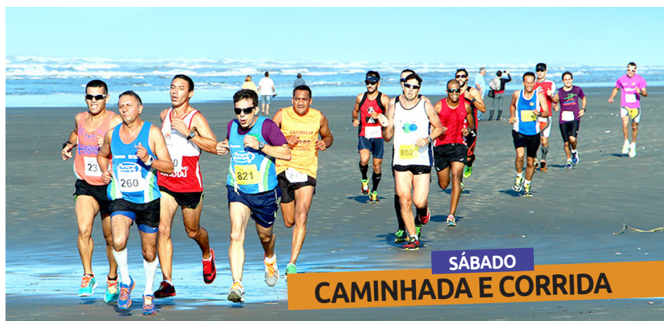
SÁBADO CAMINHADA E CORRIDA

Clima. Já no domingo (28), uma prova para os fortes: a Travessia Harry Forssell agitará a Boca da Barra, com provas de natação de 750 e 1.500 metros, além de prova militar (voltada a policiais e bombeiros) de 1.500 metros.