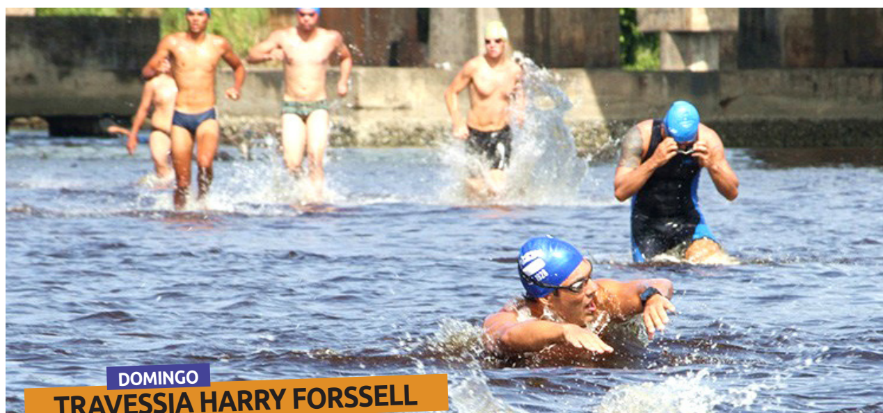
DOMINGO TRAVESSIA HARRY FORSELL

A largada será às 9 horas no sábado, na Praia do Centro. Os participantes ganharão camisetas e também medalhas de participação. Um dos intuitos da prova é de alertar para a preservação ambiental – ela será integrada às ações do Verão no Clima. As inscrições já foram encerradas.